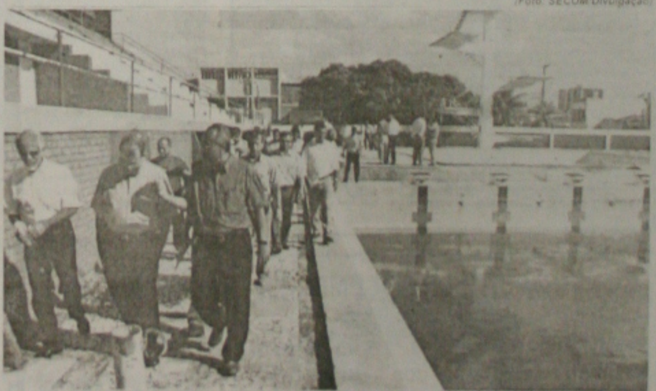
A recuperação do Parque Aquático vai proporcionar o retorno dos treinamentos e competições na piscina olímpica do Batistão