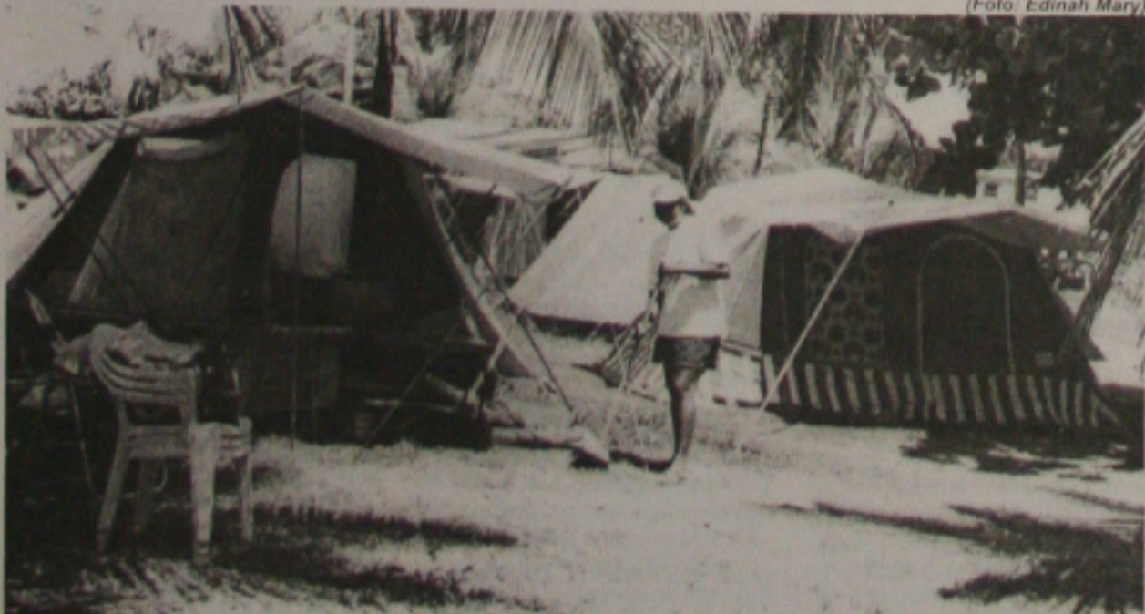
O Camping Club do Brasil, em Sergipe, tem se constituído numa boa alternativa para turistas que optaram em descansar no verão, em Aracaju. (Página 1B)