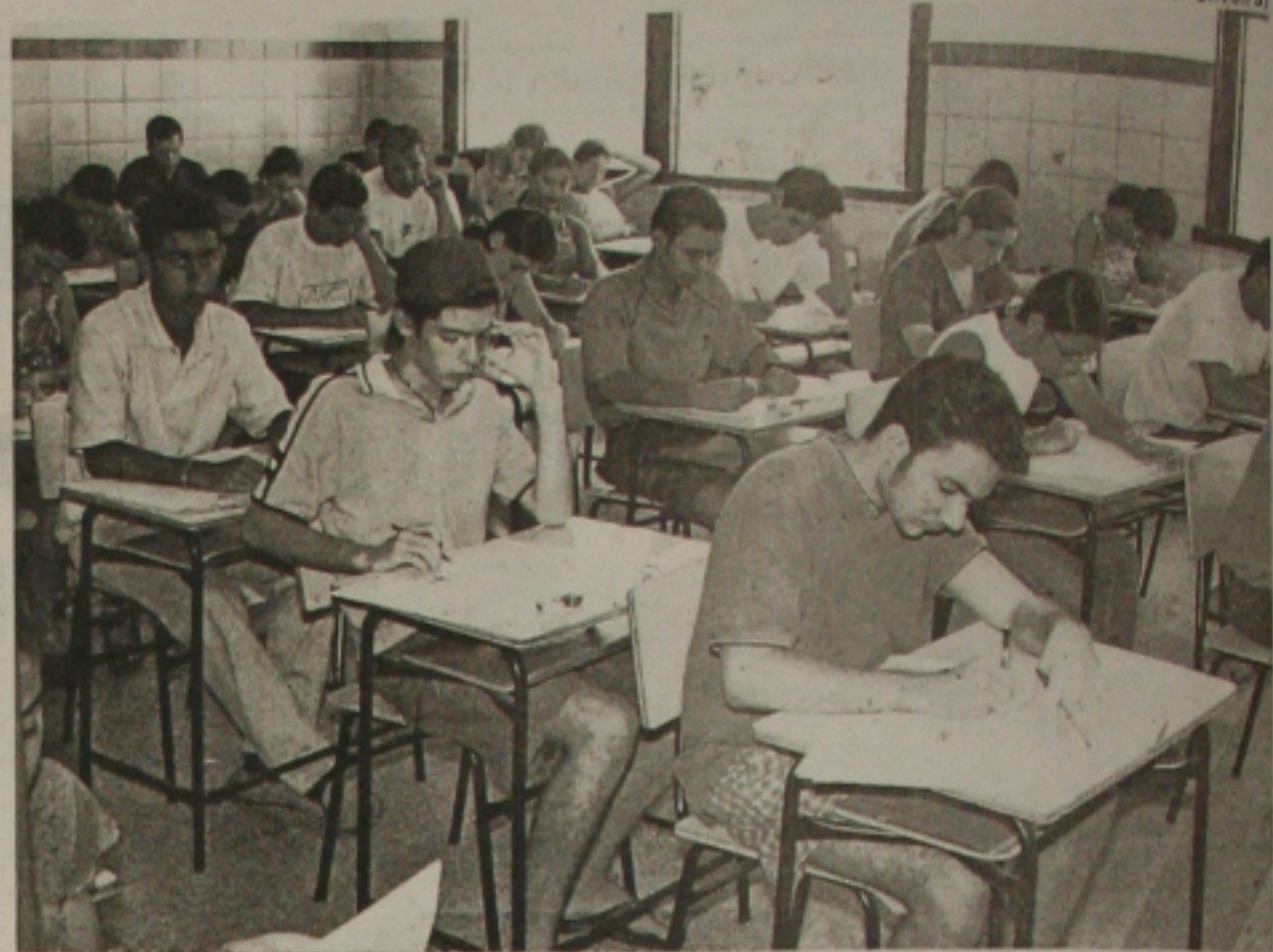
Mais de vinte mil candidatos disputam até amanhã uma vaga na Universidade Federal de Sergipe