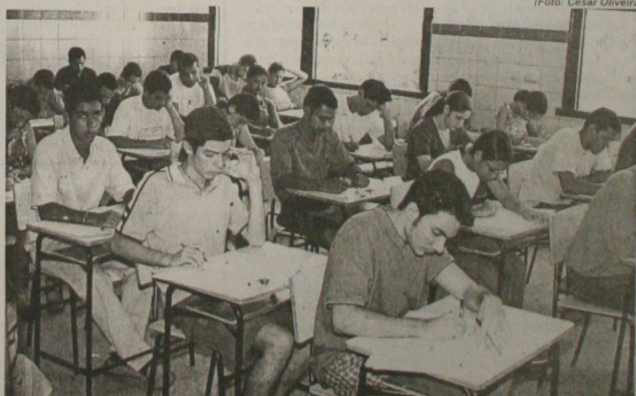
O Vestibular da UFS entra hoje no terceiro dia. Mais de 20 mil candidatos disputam as 2 mil vagas oferecidas pela instituição. (Página 2B)