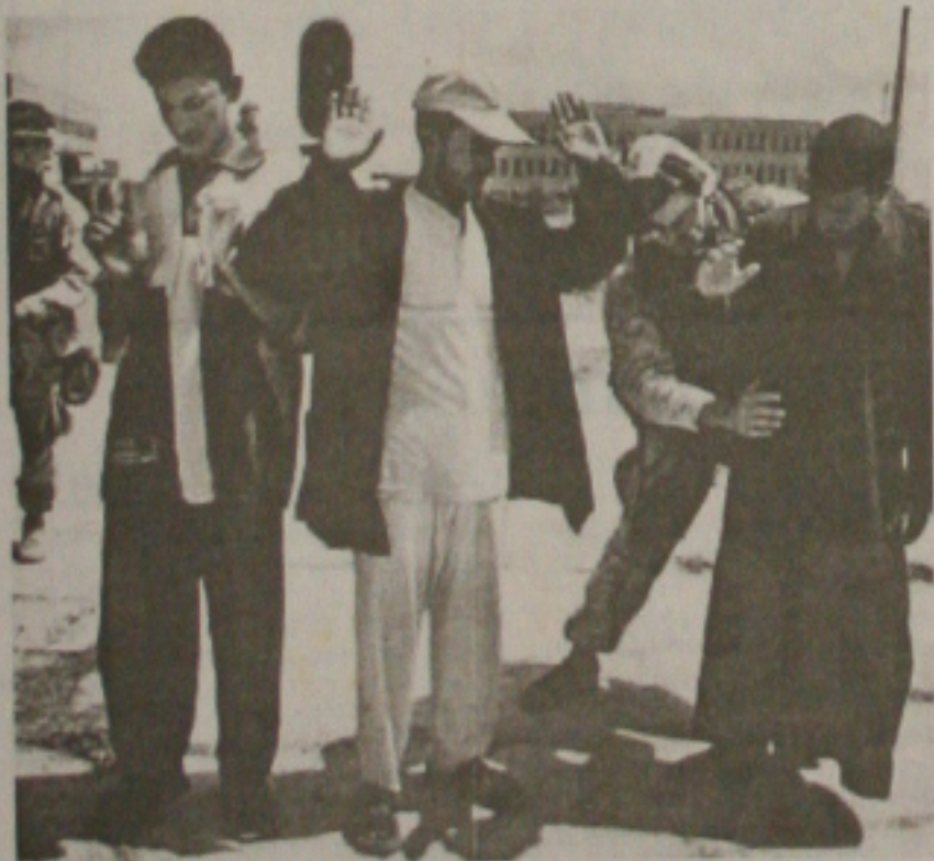
Em Tikrit, ainda há focos de resistência do antigo regime, soldados americanos examinam civis, temendo atentados suicidas, enquanto em Bagdá, iraquiano recolhe uma máscara usada para proteção contra ataques com armas químicas.

Os norte-americanos tencionam entrar na Síria para eliminar o ex-presidente iraquiano Saddam Hussein, cujo regime teria ligações com um grupo terrorista de Uganda, segundo informações do jornal britânico "The Times". De acordo com o jornal, o Exército norte-americano está pronto a lançar uma operação de comando em território sírio para eliminar Saddam, caso o ex-ditador seja localizado no país. Ontem, o ministro sírio de Relações Exteriores, Faruk al-Shara, disse que a Síria "não permitirá nenhuma inspeção" de seu arsenal militar ou de seu território para invalidar as acusações americanas de que possui armas químicas. (Página 7A)