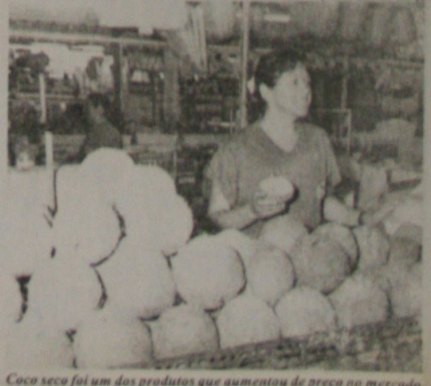
Coco seco foi um dos produtos que aumentou de preço no mercado