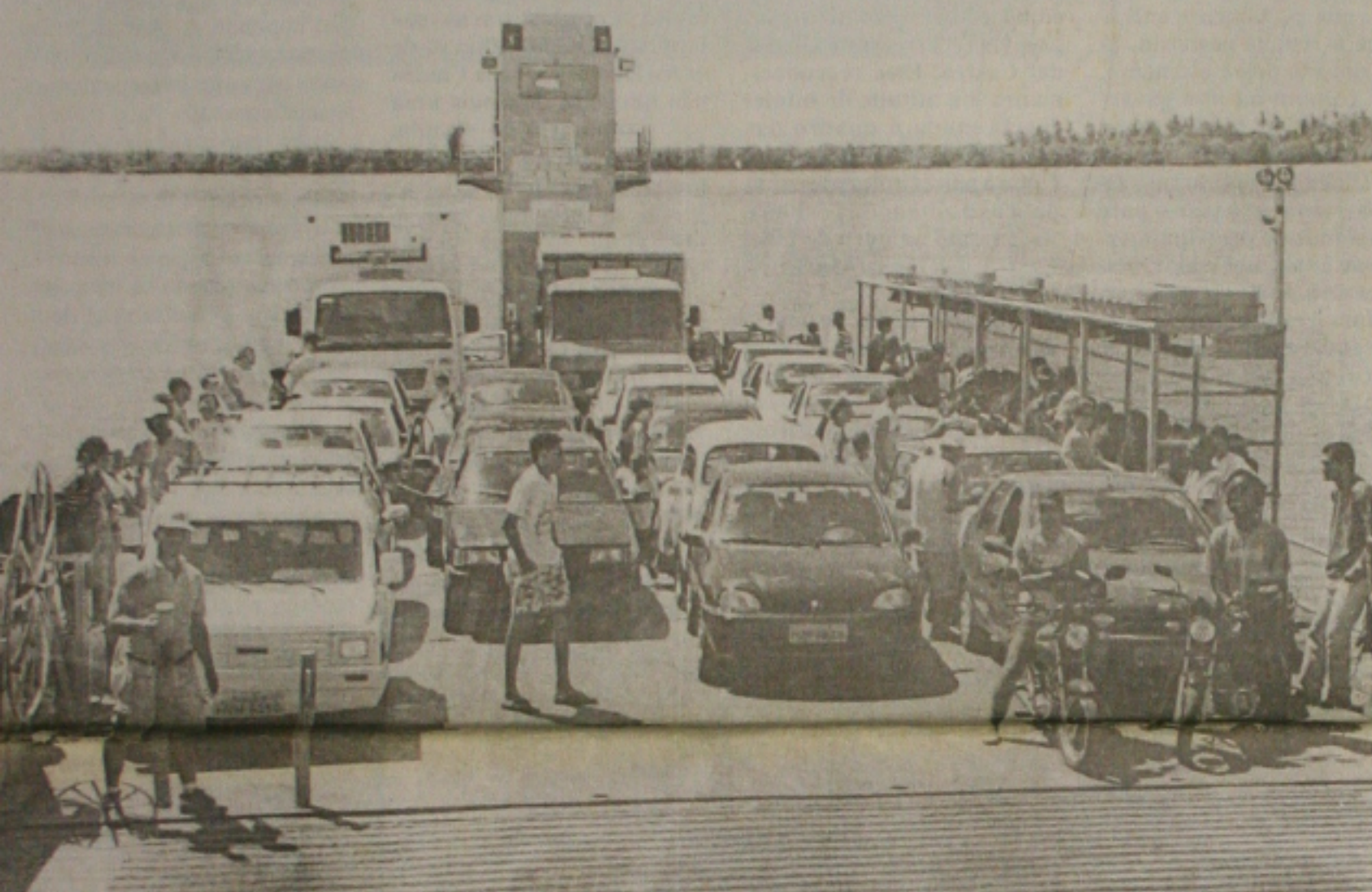
Muita gente iniciou ontem mesmo o feriadão da Semana Santa, mas o fluxo de veículos nas balsas da travessia do Rio Sergipe ainda era pequeno. Cerca de 40 mil pessoas devem viajar através do Terminal Rodoviário de Aracaju. (Página 1B)

A Agência Nacional de Energia Elétrica (Aneel) autorizou ontem novo aumento nas tarifas de seis distribuidoras das regiões Sul e Nordeste, entre os quais o da Energipe (Empresa Energética de Sergipe), que variam de 11,49% a 35,18%. Para a Energipe e a Companhia de Eletricidade da Bahia (Coelba) o aumento será escalonado. No caso da Energipe, a revisão é de 35,18% mas neste ano será concedido reajuste de 29,71%. A diferença de 5,47 pontos percentuais será repassada em qua-