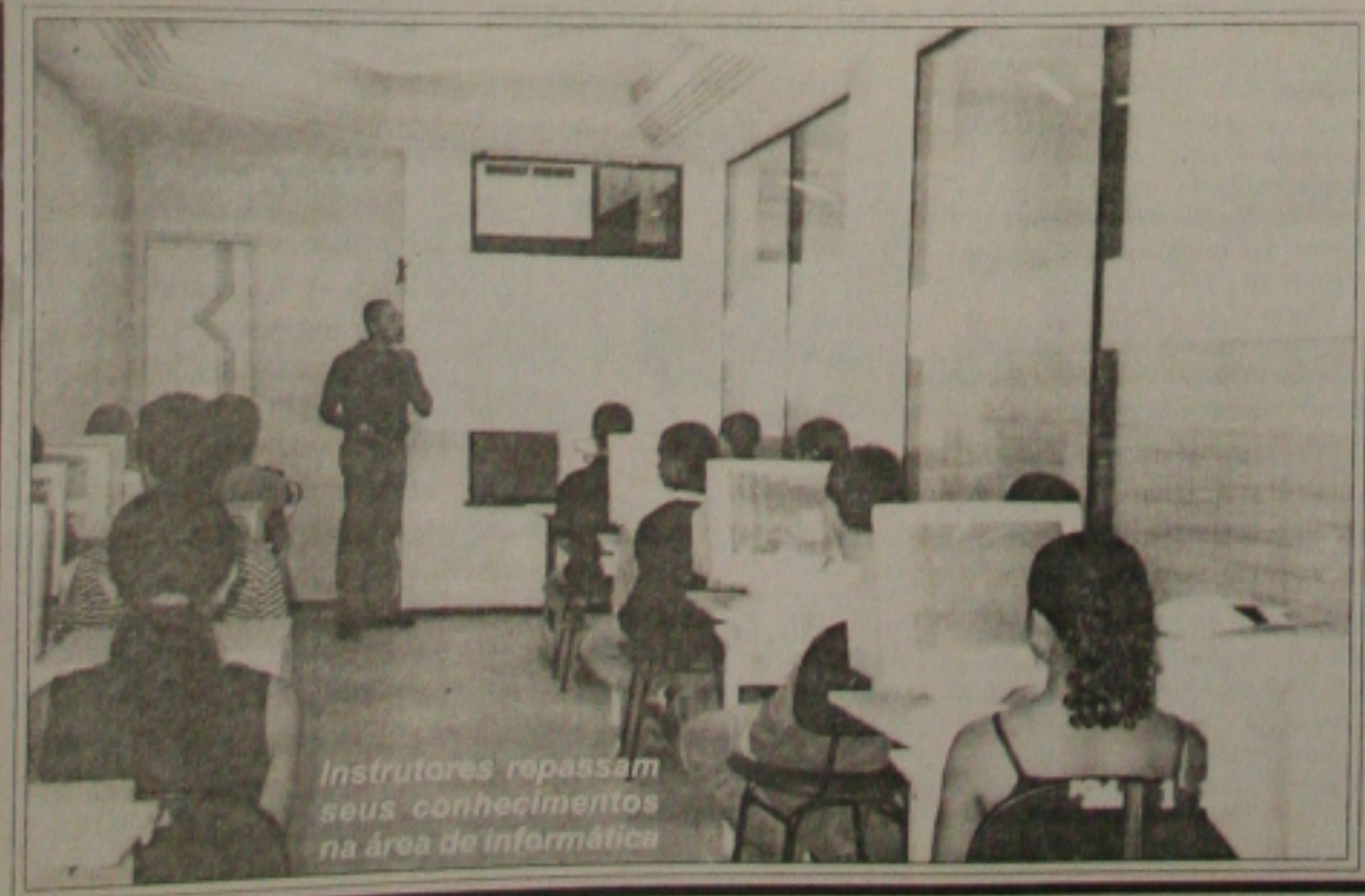
Instrutores repassam seus conhecimentos na área de informática

Aulas de informática estão sendo ministradas nas Unidades de Qualificação Profissional da Praça Olímpio Campos, Centro e do bairro Santos Dumont. Também, no Sindicato dos Trabalhadores na Indústria Têxtil - Sinditêxtil. Na próxima terça-feira, 60 jovens iniciarão o curso na Associação Jardim Atlântico, sediada na Rua Maria Pureza de Jesus, 209, Coroa do Meio. Ainda, de acordo com o calendário de início de cursos, dia 5 de maio, quatro turmas também começarão o aprendizado na Associação Comunitária do Conjunto Bugio.