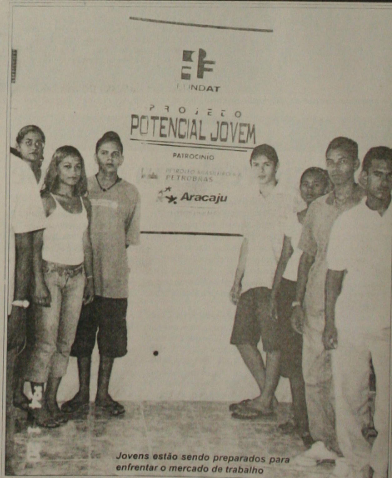
Jovens estão sendo preparados para enfrentar o mercado de trabalho