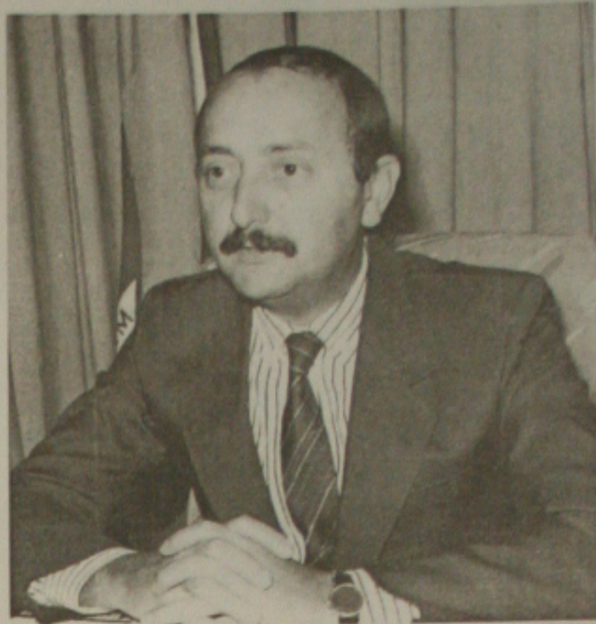
Walter, preocupado com desemprego, quer que todos ajudem os carentes

Entendemos que o empresariado brasileiro é por demais sacrificado com impostos abusivos e, em alguns casos, é obrigado a concorrer com empresas do exterior que não tem a mesma carga tributária que no Brasil.