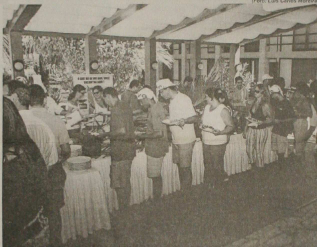
OLANÇAMENTO NACIONAL - Da Vivo, foi realizado com festa em oito Estados brasileiros. Em Sergipe a Feijoada foi em clima de beira-mar e bate-papo entre os convidados.