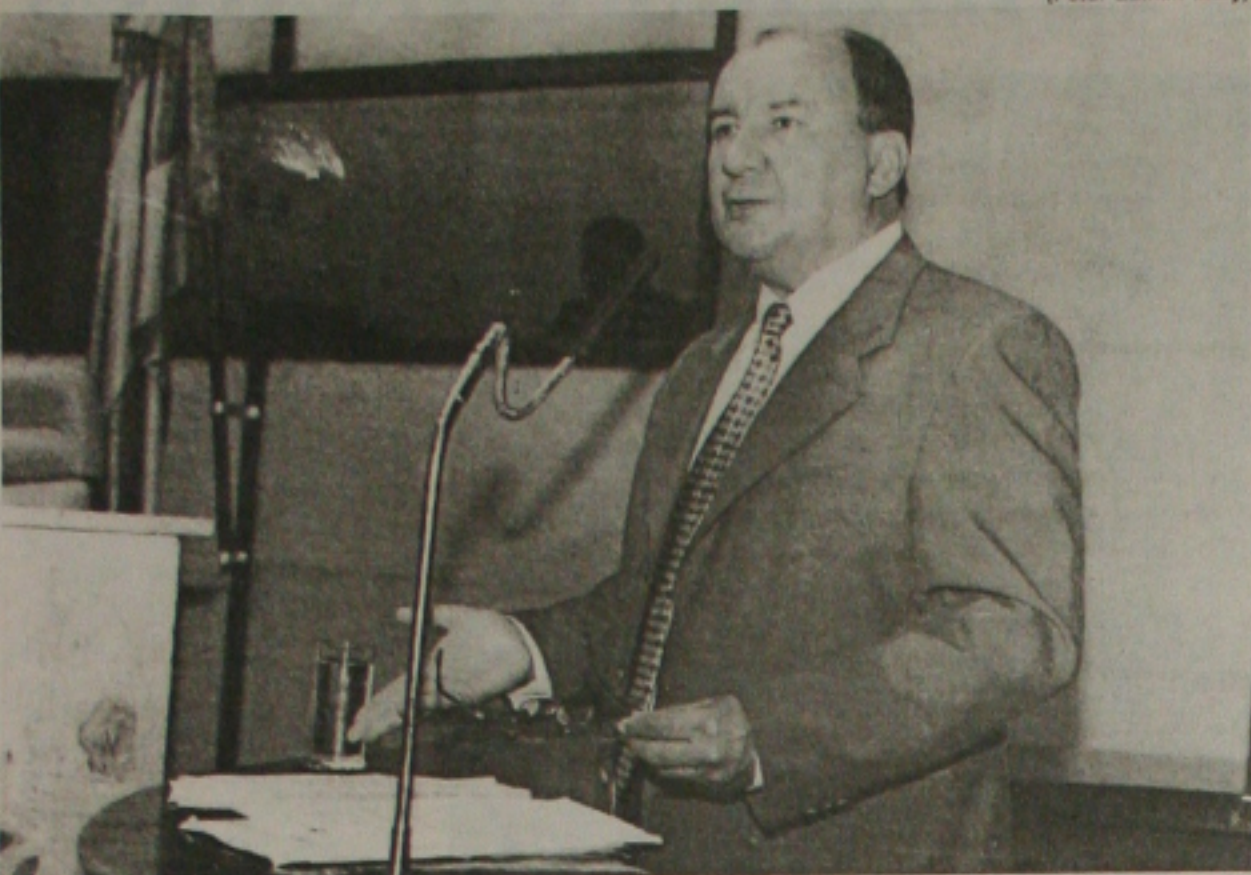
Augusto: existe um clima ruim