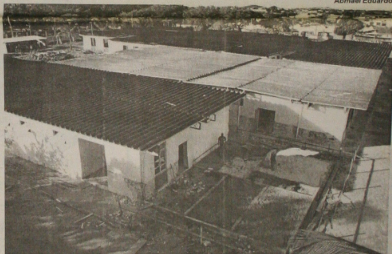
Continua em ritmo acelerado a construção das casas financiadas pelo programa Habitar Brasil/Bid na Coroa do Melo. A obra vai beneficiar 600 famílias que hoje vivem em palafitas. (Página 03)

O Banco Nacional de Desenvolvimento Econômico e Social (BNDES) não vai se pronunciar sobre a possibilidade de socorrer a subsidiária brasileira da Parmalat, até que um pedido formal de financiamento da empresa dê entrada na instituição. A proposta de socorro empresarial do BNDES à Parmalat do Brasil deve ser apresentada por alguns segmentos produtores ao Ministério da Agricultura, mas encontra resistência de lideranças do setor. Ontem, a holding pernambucana Intergrupo anunciou a compra da fábrica da Parmalat em Natal (RN). (Página 04)