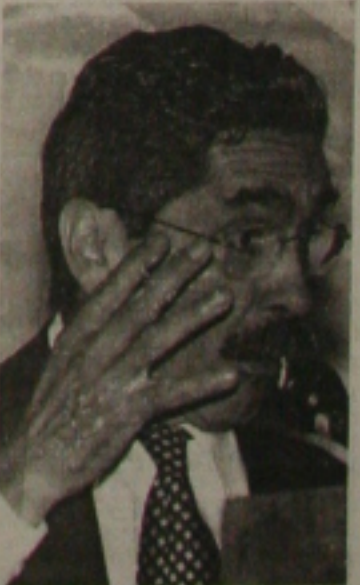
Olívio Dutra disse que está tranquilo quanto à reforma

O ministro das Cidades, Olívio Dutra, um dos cotados para deixar o governo a partir da reforma ministerial, tem se mostrado tranquilo diante dessa possibilidade. Olívio sabe que o seu cargo tem gerado a cobiça de muita gente, mas sabe também que se trata de um ministério estratégico, portanto, de difícil negociação por parte do governo. Ou Lula vai entregar o "filé" ao PMDB?