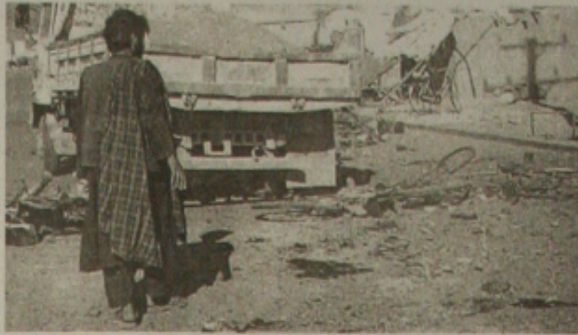
Afeição observa estragos provocados pela explosão

"Durante a onda de frio, muitas pessoas morreram de pneumonia, bronquite e asma", afirmou Dilwara Begum, diretor-geral suplementar do Diretório de Saúde de Bangladesh. No Estado de Uttar Pradesh (norte da Índia), no qual se verificou a maior parte das mortes neste inverno, 38 pessoas morreram devido às baixas temperaturas nos últimos dois dias, afirmou um porta-voz do governo, elevando o número total de vítimas no Estado a 407.