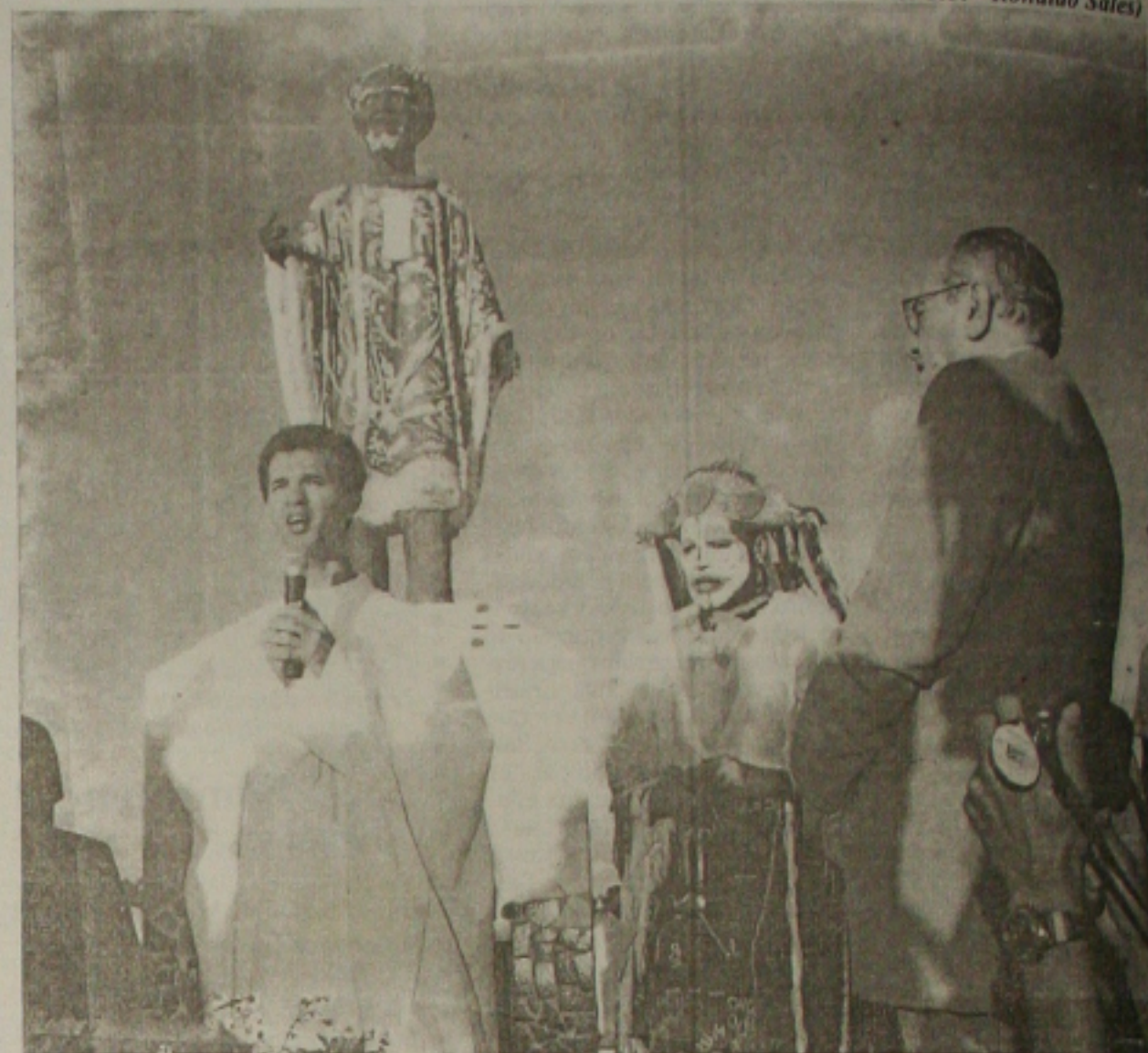
Solenidade católica realizada no obelisco

Natural de Japarutuba, Arthur Bispo do Rosário (1909 - 1989) é o mais conhecido artista plástico no Brasil e no exterior. Foi para o Rio de Janeiro na década de 20. Em 1938, considerado como esquizofrênico é internado em um manicômio durante alguns anos, onde iniciou sua produção artística. Entre suas obras, que chegam a quase mil, o Manto da Apresentação, é o mais