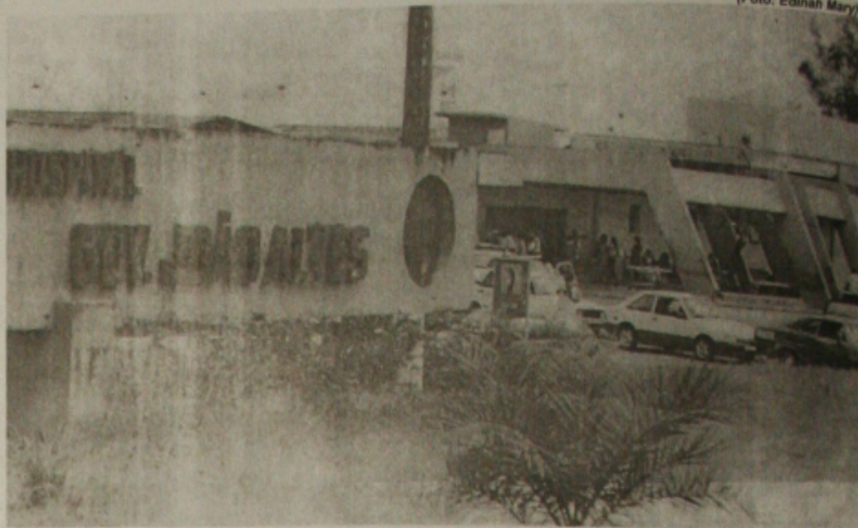
O hospital João Alves reforça o quadro de empregados com a contratação de novos servidores

A Feira de Sergipe 2004 é mais uma ação do Sebrae, com o apoio do Governo do Estado, Banese, Codise, Banco do Brasil e Caixa Econômica Federal. Informações na Unidade de Apoio a Comercialização, telefones (79) 216-7733, 216-7721 e 216-7752.