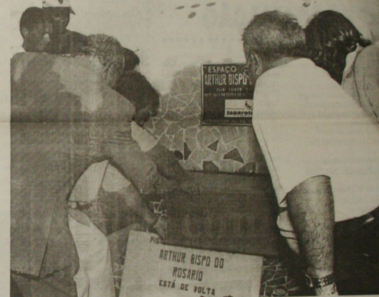
Os restos mortais sendo colocados no monumento

importante, considerado pela crítica cultural, uma síntese de todo o seu trabalho.