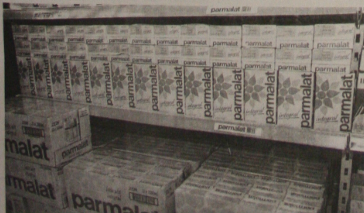
Até o final do ano, a holding pretende ampliar a produção de leite pasteurizado tipo A, longa vida e novos produtos