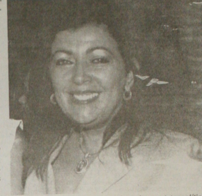
Deputada Susana Azevedo fazendo muitos contatos políticos.

04.25h - Telecurso 2000 - Curso Profissionalizante 04.45h - Telecurso 2000 - 2º Grau 05.00h - Telecurso 2000 - 1º Grau 06.15h - Globo Rural 05.25h - Telecurso 2000 - Curso Profissionalizante (reprise) 05.45h - Telecurso 2000 - 2º Grau (reprise) 06.00h - Telecurso 2000 - 1º Grau (reprise) 06.15h - Globo Rural (reprise) 06.30h - Bom Dia Sergipe 07.00h - Bom Dia Brasil 07.30h - Mais Você 08.10h - Xuxa no Mundo da Imaginação 08.30h - Sítio do Picapau Amarelo 09.30h - TV Globinho 10.30h - SE TV - 1ª Edição 11.45h - Globo Esporte 12.30h - Jornal Hoje 13.45h - Vídeo Show 14.25h - Vale a Pena Ver de Novo