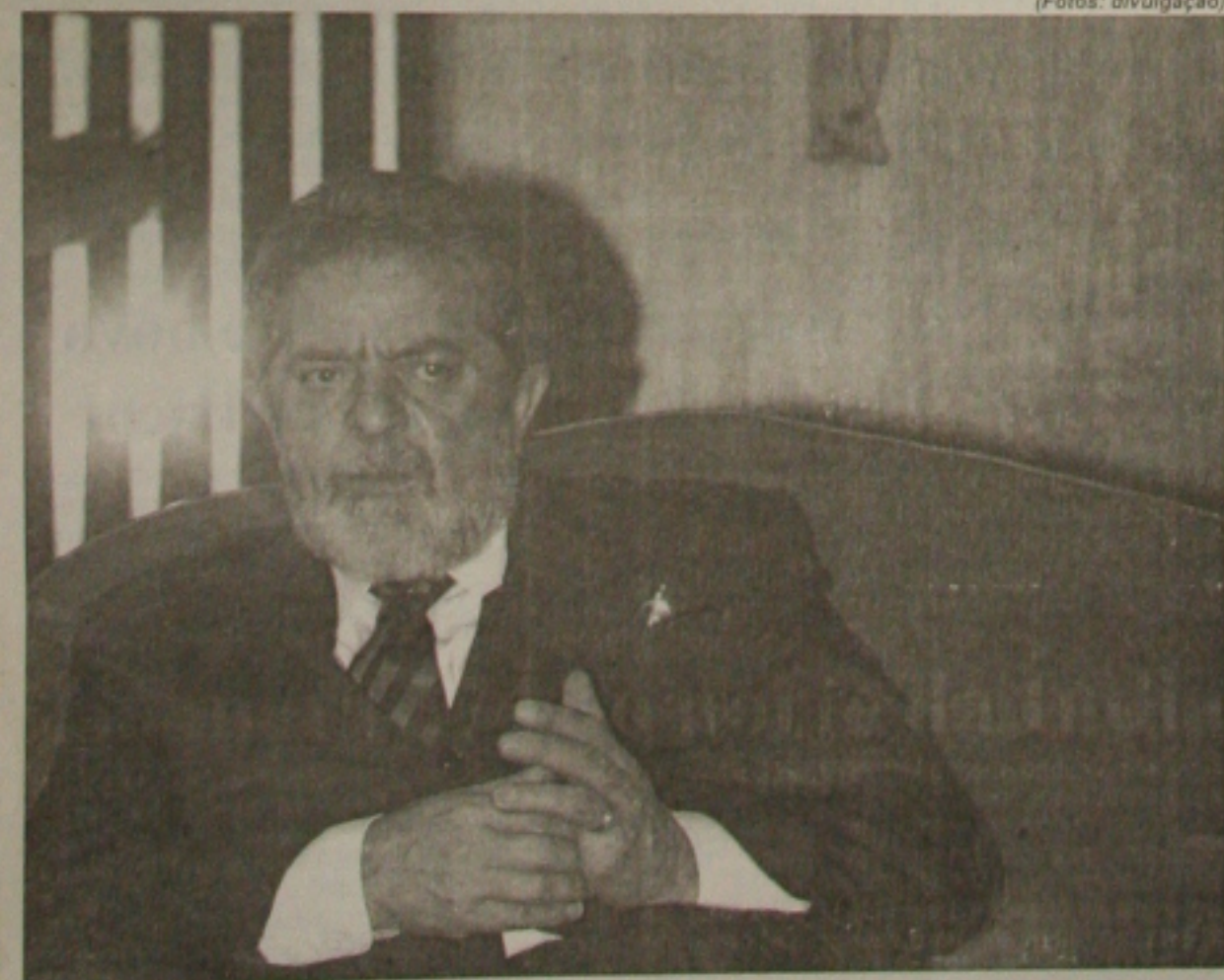
Presidente Lula emite nota oficial dizendo que não tomou ainda qualquer decisão a respeito da reforma ministerial