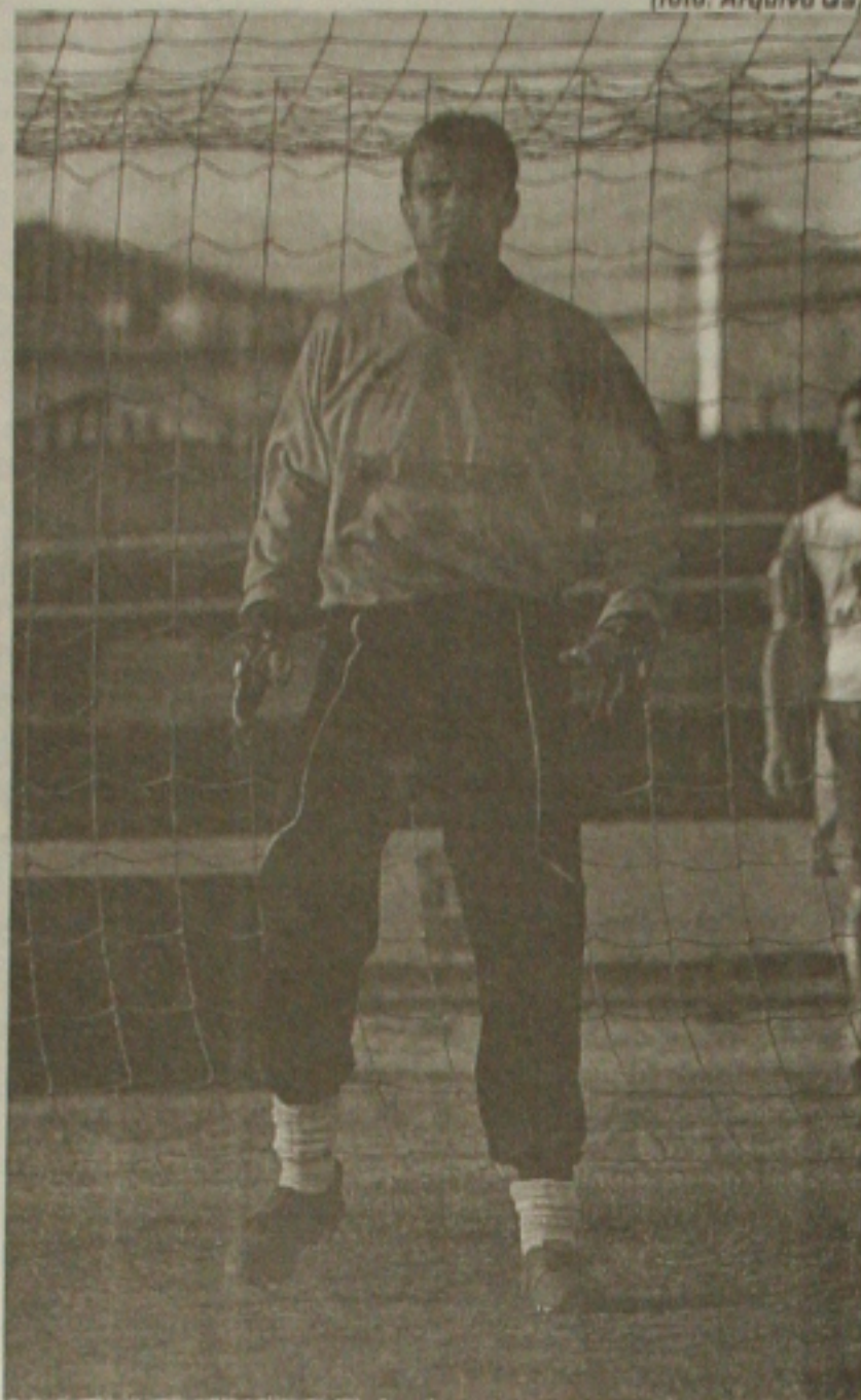
O goleiro Schumacher participou do treino de ontem e está confiante no trabalho do novo treinador

GIVALDO BATISTA Da editoria de Esportes givaldoba@yahoo.com.br