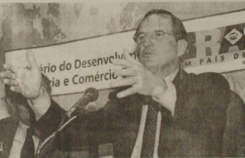
Luiz Fernando Furlan, ministro do Desenvolvimento, Indústria e Comércio, aposta na criação de 1 milhão de empregos no País com o crescimento das exportações