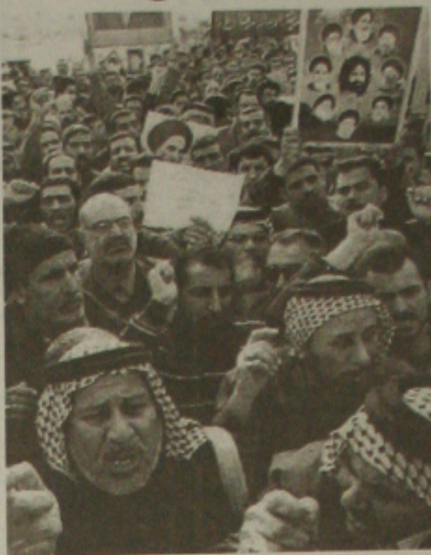
Milhares de xiitas reúnem-se no centro de Bagdá

Sistani quer que o governo interino seja eleito diretamente,