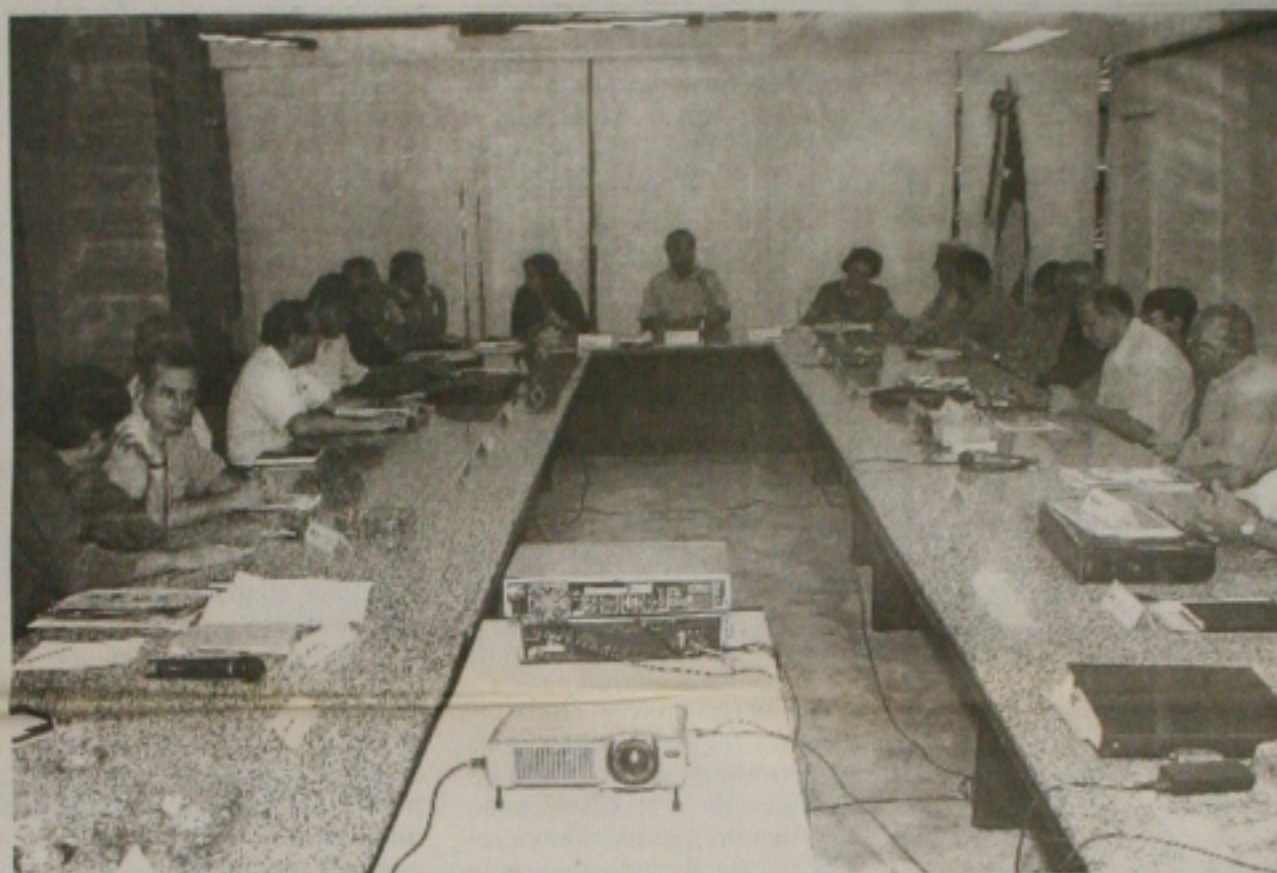
Governador quer renegociação de contratos