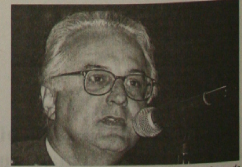
Presidente da CEF, Jorge Mattoso, quer aumentar o número de financiamentos de imóveis em 2004

O governo federal decidiu colocar um freio nas próprias despesas no início deste ano. Segundo decreto presidencial publicado no Diário Oficial da União de ontem, os ministérios e outros órgãos públicos só poderão utilizar em janeiro 6% dos investimentos e despesas de custeio previstos no Orçamento de 2004.