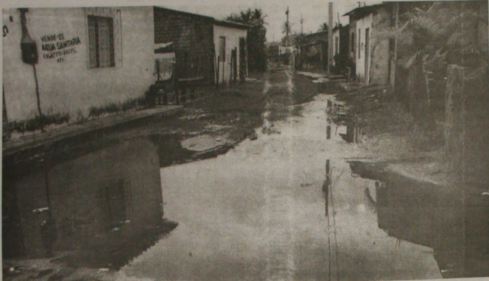
Em Aracaju, muitas áreas da periferia da cidade continuavam alagadas ontem...

Prefeitos decretam calamidade em Poço Redondo, Canindé e Porto da Folha