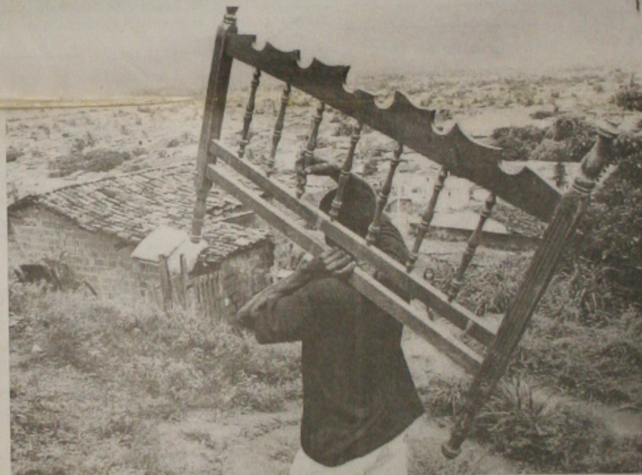
...enquanto famílias desabrigadas em áreas de risco, como no Morro do Tangará, recebem ajuda da prefeitura para deixar o local

cretariado e dirigentes de órgãos públicos. Ele anunciou a extinção dos escritórios de representação de Sergipe em São Paulo e no Rio de Janeiro, e a criação da central de compras do Estado, como medidas necessárias para a redução de gastos no Estado, para garantir os recursos necessários ao pagamento do piso de R$ 250 para os servidores públicos, a partir de maio. (Página 03)