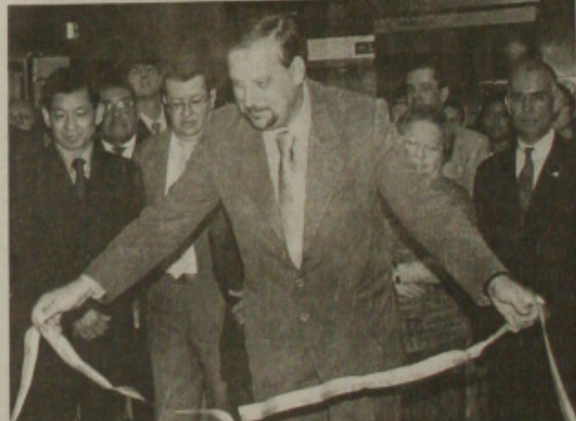
Ministro Ricardo Berzoini aciona os seus lobbistas

formação sobre os bastidores da reforma foi intenso, durante todo o dia de ontem. O objetivo da reforma é, sem dúvida alguma, efetivar o PMDB no governo o mais rápido possível, em troca de apoio no Congresso - que já está sacramentado - e agilizar alianças, visando às eleições de 2004. Um esforço hercúleo na tentativa de se conquistar um grande número de prefeituras no próximo pleito. E, dessa forma, sedimentar a força do PT em todas as regiões. As definições já foram tomadas. Lula já definiu os peemedebistas que ocuparão os Ministérios da Previdência e Comunicações. A grande dificuldade, contudo, paira sobre o nome de quem irá ocupar o superministério da área social a ser criado. Mais uma vez, fica claro que o problema está dentro do próprio PT. Já que todos os principais líderes do partido não abrem mão da indicação de um superministro. Todos querem ser o pai da criança.