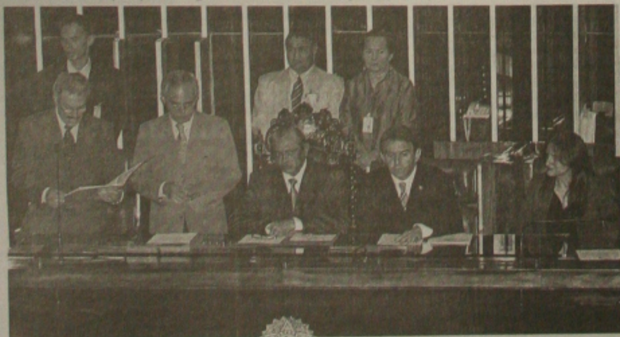
Convocação extraordinária do Congresso começa com a presença de apenas 30 parlamentares

O governo decidiu liberar R$ 200 milhões em empréstimos para a estocagem de leite e derivados em todo o País. A decisão foi motivada pela crise na