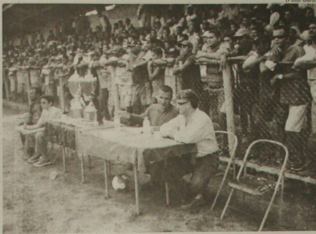
O torcedor de Neópolis lotou o estádio para ver o seu time ser campeão, mas deixou o campo frustrado com o empate em 3x3 contra a seleção de Arauá