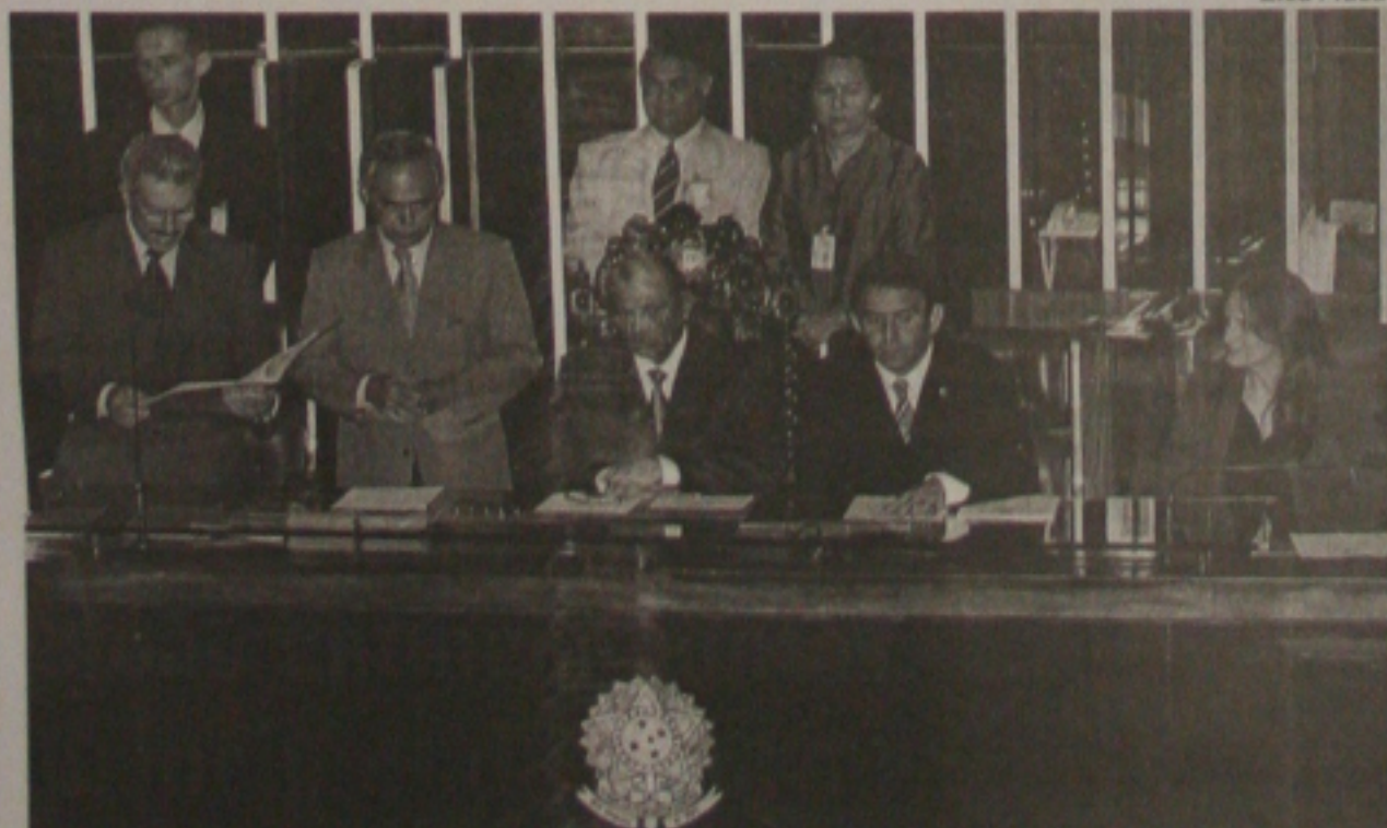
O senador Romeu Tuma discursa na sessão de abertura da convocação extraordinária do Congresso Nacional, que durou pouco mais de cinco minutos. (Nacional - Página 09)

Encoberto a nu- blado com pancadãs de chuvas. Ventos fracos/moderados, direção S-W, temperatura estável. Máxima de 28°C e mínima de 23°C na capital e no litoral. No sertão e região oeste máxima de 28°C e mínima 22°C.