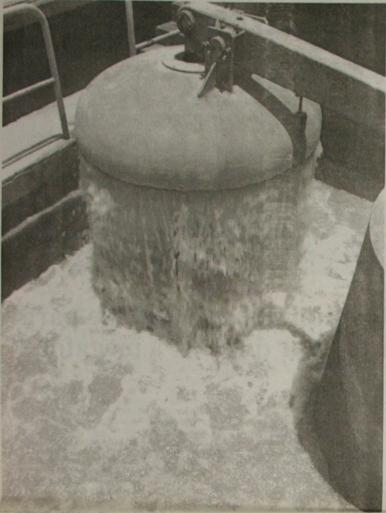
O elevado índice de turbidez na água do Velho Chico fez o Deso diminuir a oferta do produto na Grande Aracaju

O índice de turbidez na água captada no São Francisco diminui fornecimento na Grande Aracaju