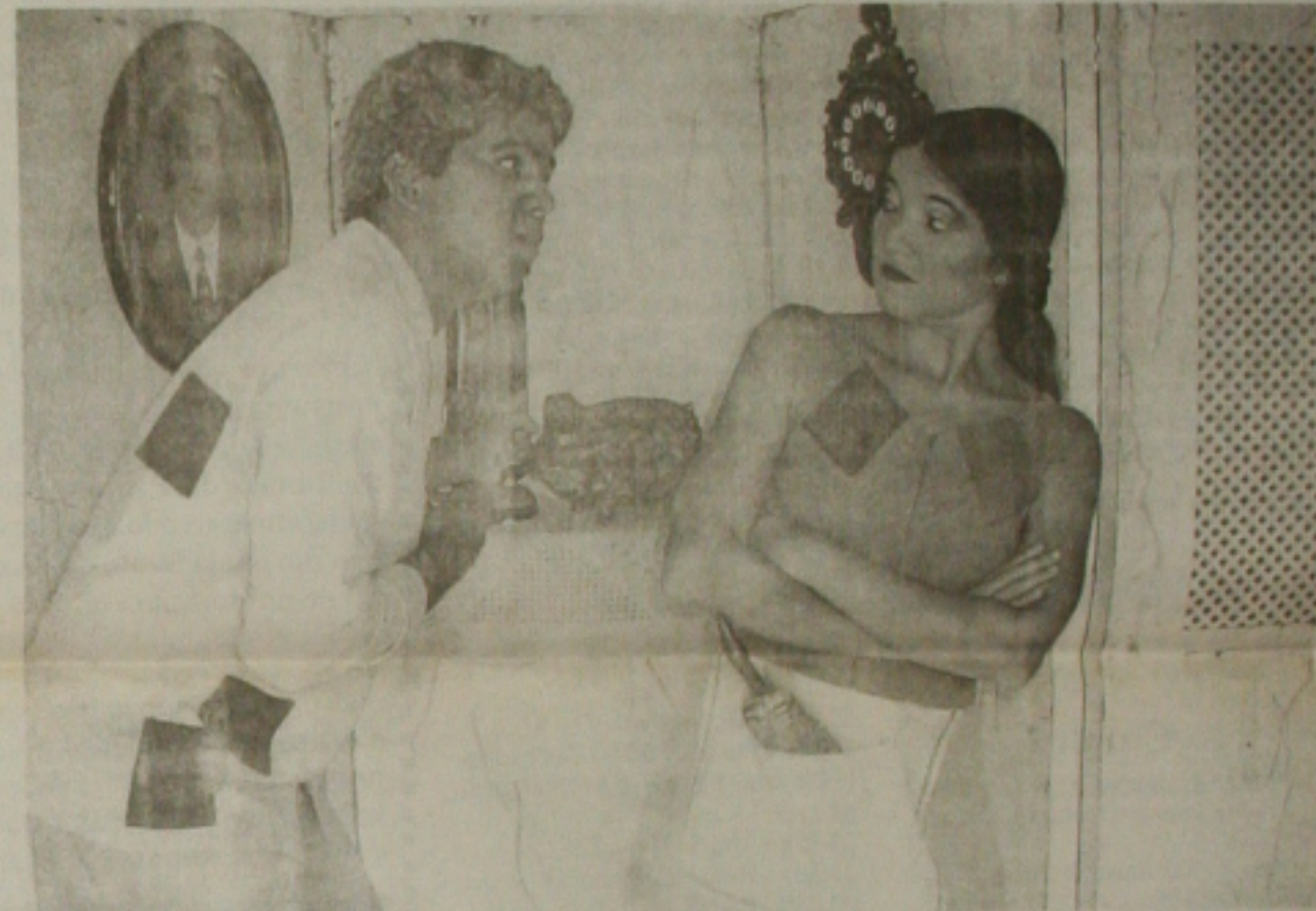
A peça já percorreu várias capitais brasileiras