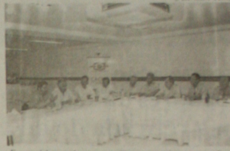
Empresários sergipanos: reunião no Aquarius contra o ComprasNet