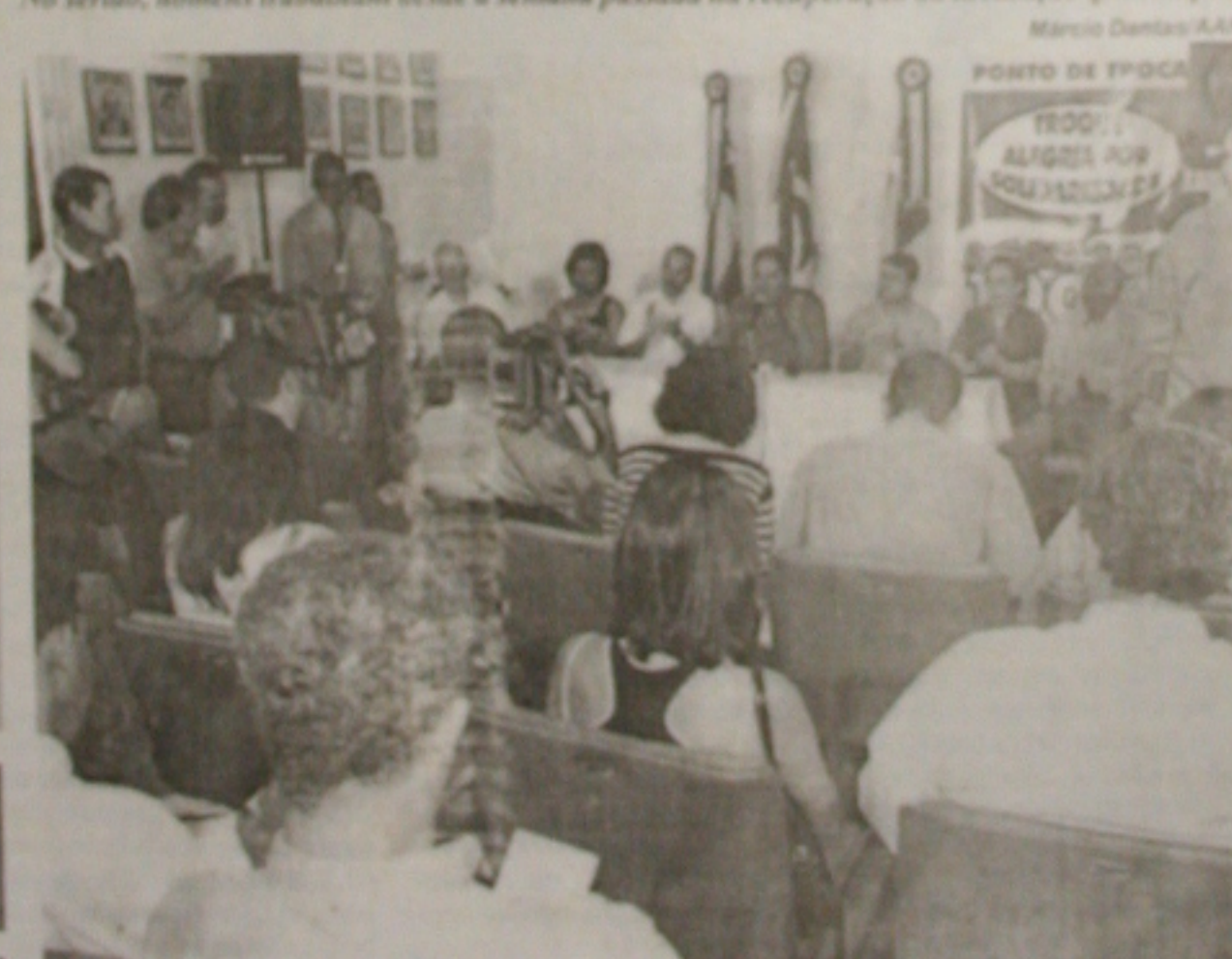
O prefeito, ao lado do vice, secretários e dirigentes da ASBT anunciou as mudanças

A Companhia de Saneamento de Sergipe (Deso) continua mantendo a redução de 50% no fornecimento de água para a Grande Aracaju, em virtude da elevação da turbidez das águas do Rio São Francisco - no ponto de captação do sistema - provocada pelas fortes chuvas que caem sobre o Estado desde a semana passada. Devido ao alto índice de turbidez, está havendo retardo no tratamento de água bruta e, com isso, diminuição da capacidade de tratamento. A adutora do São Francisco é responsável pelo abastecimento de 54% de toda a água tratada que chega à ca-