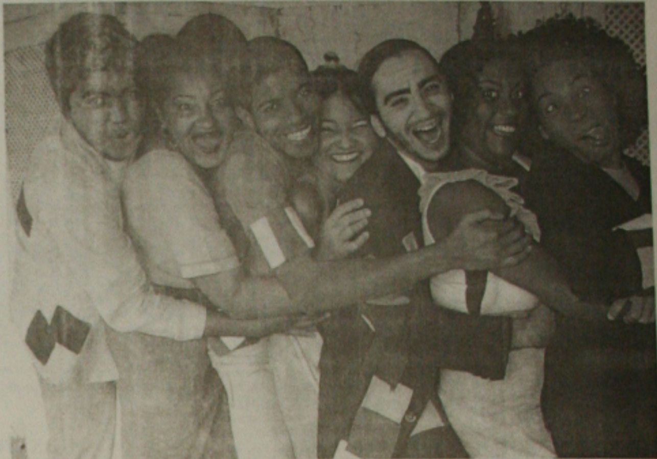
Todo o elenco de O Santo e a Porca

O árabe entende literalmente o roubo a seu dinheiro e trata de escondê-lo num vão do cemitério, próximo ao túmulo de sua mulher. Margari-