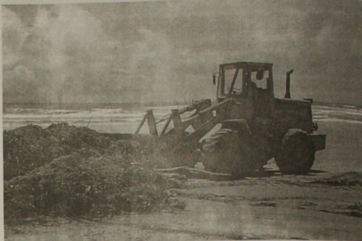
Trator da prefeitura recolhe sargaço acumulado na praia de Atalaia

Às sextas-feiras uma equipe percorre as áreas mais frequentadas com o objetivo de prepará-las para o fim de semana seguinte. Aos domingos também é feita uma limpeza nas chamadas áreas críticas, onde há uma maior concentração de pessoas e se re-