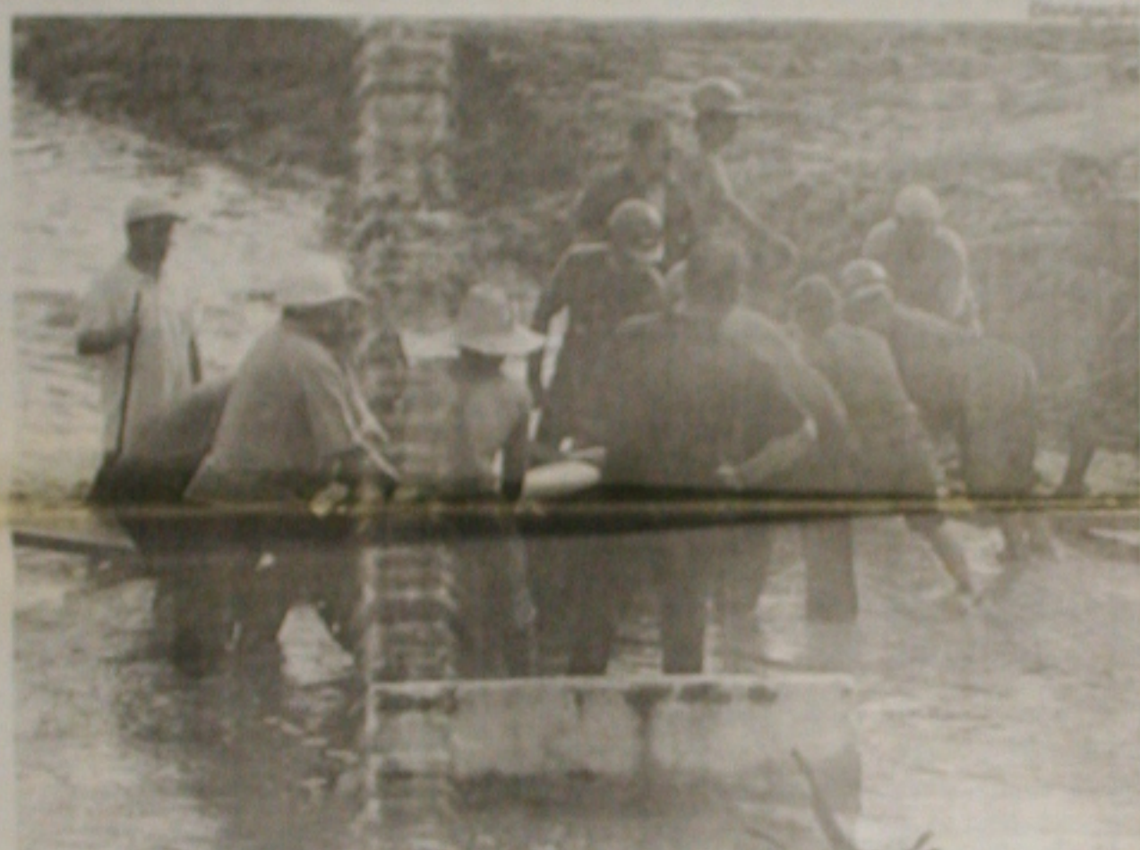
No sertão, homens trabalham desde a semana passada na recuperação da tubulação que rompeu