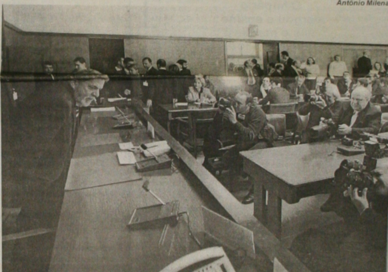
O presidente Lula, ao participar ontem de entrevista coletiva no Palais des Nations, em Genebra, procurou desfazer boatos sobre uma possível concentração de poderes pelo ministro da Casa Civil, José Dirceu. (Página 09)

O líder da oposição na Assembleia Legislativa, deputado estadual Belivaldo Chagas (PSB), negou ontem que esteja se licenciando da Casa para assumir uma secretaria na administração do prefeito Marcelo Déda (PT). "Seria uma honra poder contribuir com uma administração séria e competente, como a do prefeito Déda", disse Chagas, salientando porém nunca ter recebido qualquer convite para assumir qualquer cargo na Prefeitura de Aracaju. (Página 03)