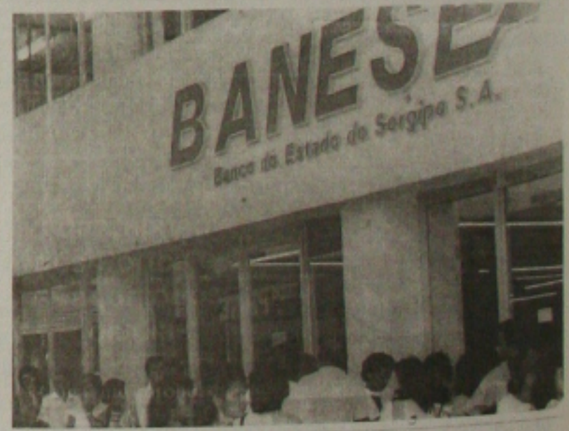
Banese anuncia abertura de concurso público

O salário inicial para o cargo de Trainee é de R$ 1.084,33. Já os candidatos aprovados para Técnico Ban-