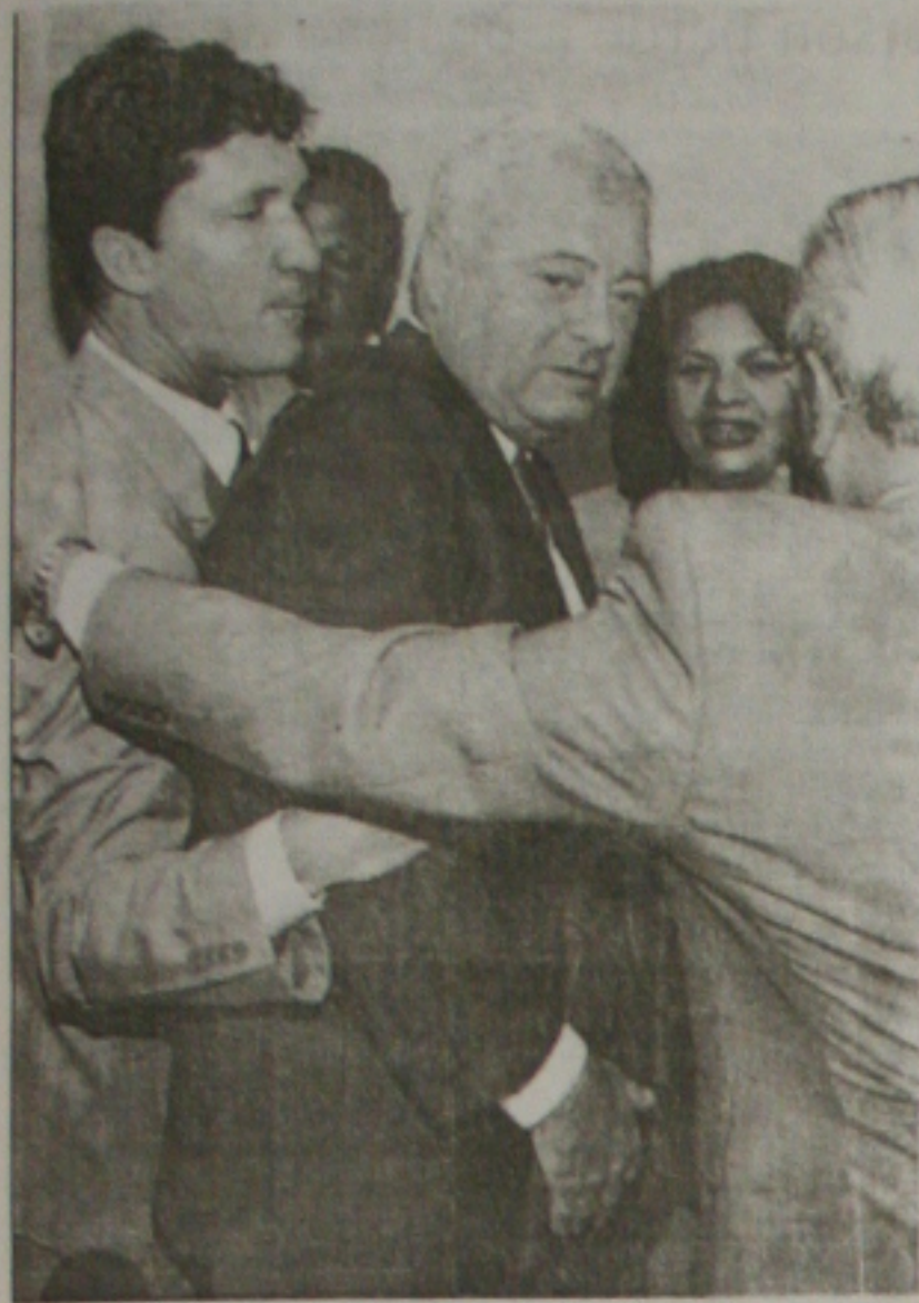
Ricardo Teixeira garante jogo em Minas

Tudo foi definido ontem entre a Confederação Brasileira e o Governo de Minas Gerais