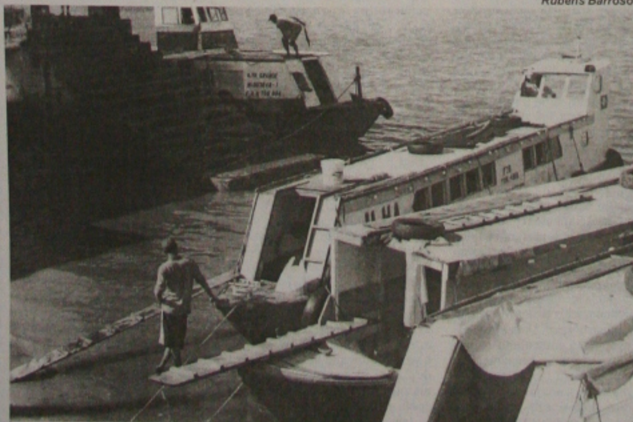
Embora os canoeiros neguem, a Capitania admite que há superlotação em to-to-tós

cou 1,12%, para 98.938% do valor de face; e o risco Brasil avançou 6,52%, para 474 pontos. Mas durante o pregão, o índice chegou a subir 18%, atingindo a máxima de 511 pontos. O dólar também continuou a escalada dos últimos cinco dias e fechou em alta de 1,21%, cotado a R$ 2,931. (Página 09)