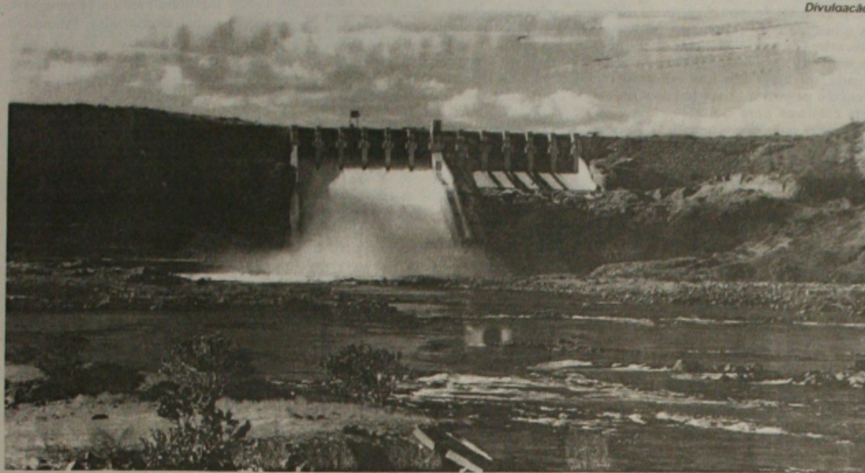
Em Xingó, a vazão deve chegar a 3,5 mil metros cúbicos por segundos neste final de semana

Telha é o primeiro município atingido; vazão em Xingó pode chegar a 5,5 mil metros cúbicos por segundo