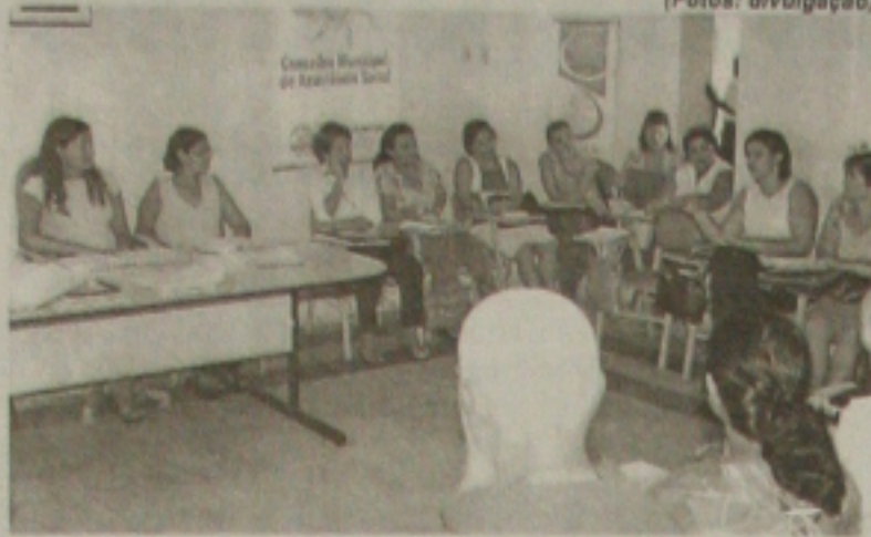
Eleição de Conselho: transparência na política pública