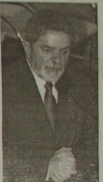
Lula: contenção de despesa

que presta serviços de limpeza à Prefeitura de Aracaju e consiste na idéia de conscientizar banhistas para não poluir as praias da capital. Durante o domingo, o grupo vai levar mensagens aos banhistas e clientela de bares e restaurantes da orla através de panfletos educacionais e explicativos traduzindo as formas que cada um, individualmente, pode contribuir com a campanha.