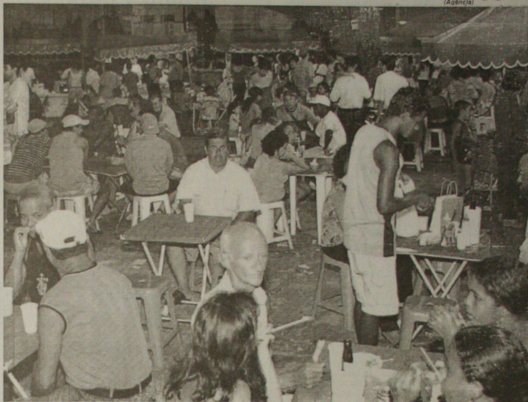
Projeto Freguesia que será realizado na Praça Tobias Barreto terá duas atrações artísticas