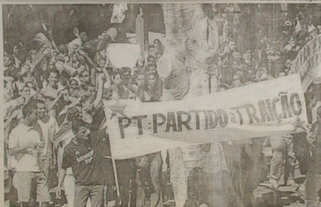
Manifestantes protestam contra o Governo Lula no dia do 24º aniversário do PT, no Rio de Janeiro