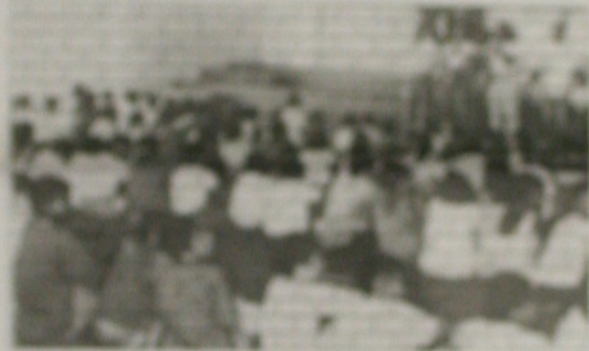
Atividade de formação continuada para professores em Sergipe.