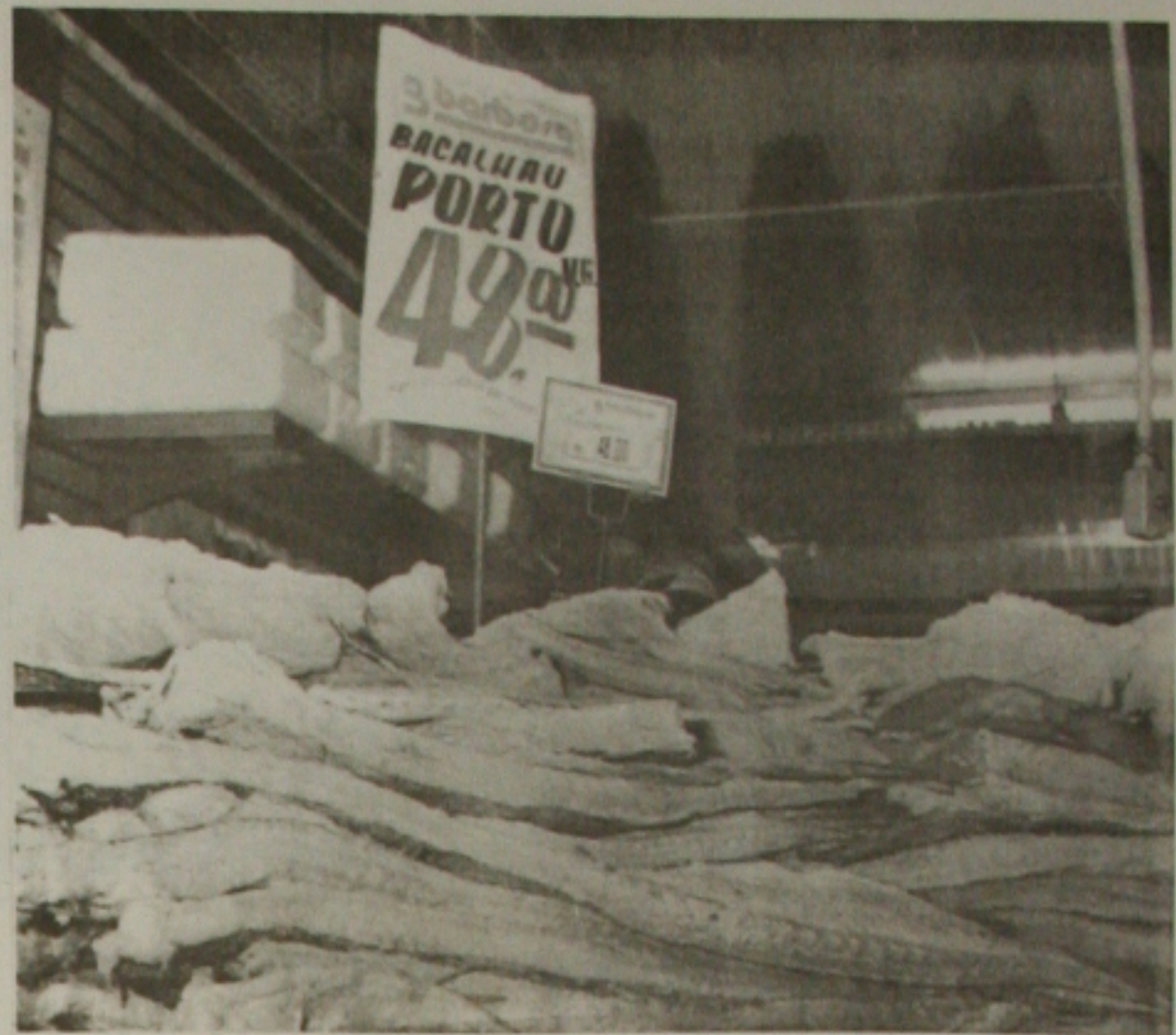
As redes de supermercados de Sergipe esperam início da quaresma para formar estoque de bacalhau

Tanto o peixe como o bacalhau, sem dúvida, os preços praticados serão outros. Cabe ao consumidor procurar comprar o mais barato. Vão sempre existir os espertalhões, porém, o consumidor deve valorizar o seu dinheiro. Vá aos supermercados e compare com os valores da feira livre e bom apetite. (Raimundo Feitosa)