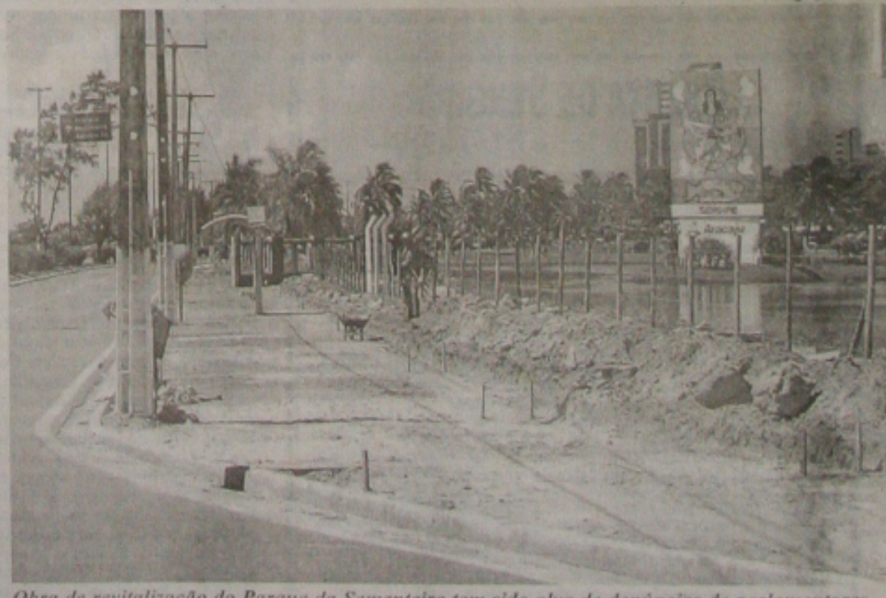
Obra de revitalização do Parque da Sementeira tem sido alvo de denúncias de parlamentares