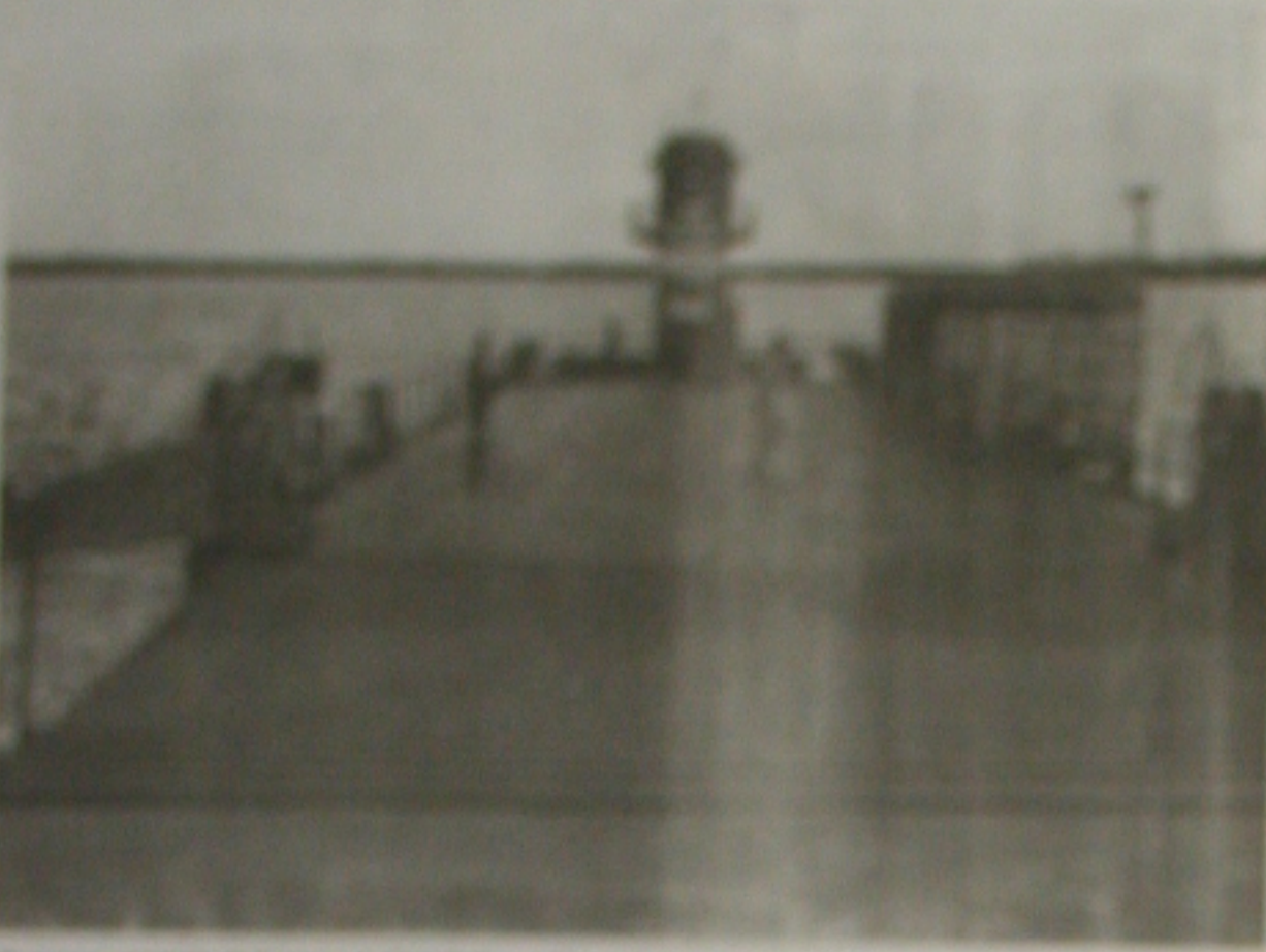
Assalto a caminhão de concreto da obra representativa do projeto de construção de uma ponte

Bando já praticou dezesseis assaltos e mantém depósitos espalhados por todo Estado