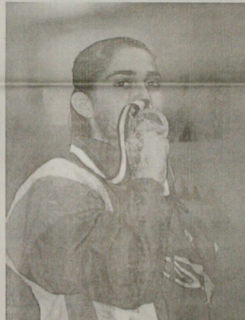
Daniele Hypólito atração em Curitiba

"Nosso grupo sempre se destacou pela união, pois precisamos de todas e isso é o