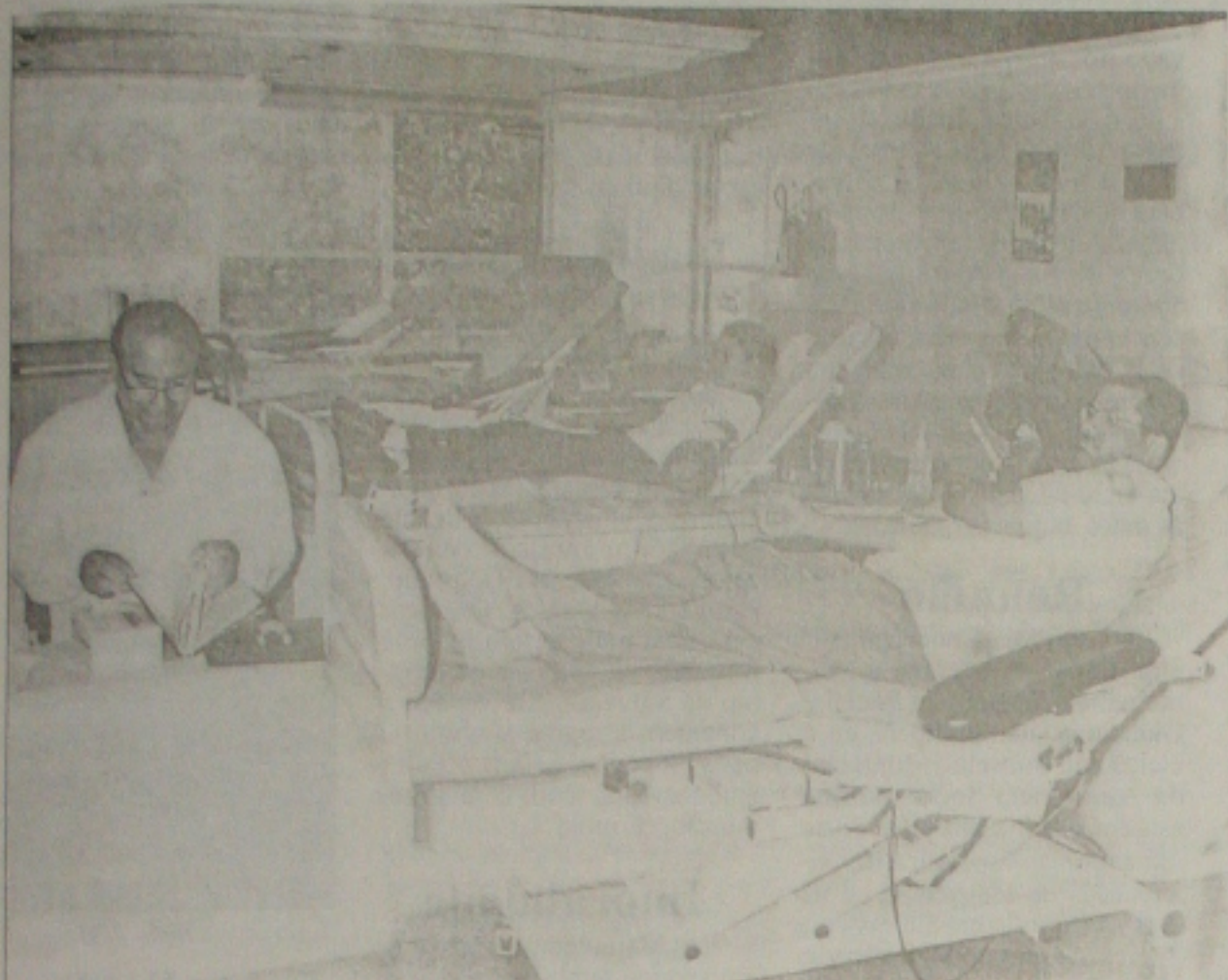
Hemose mantém campanha de doação de sangue para garantir estoque durante a realização da festa mimosca

Professor recorre ao Ministério Público para evitar o surgimento de faculdades ilegais