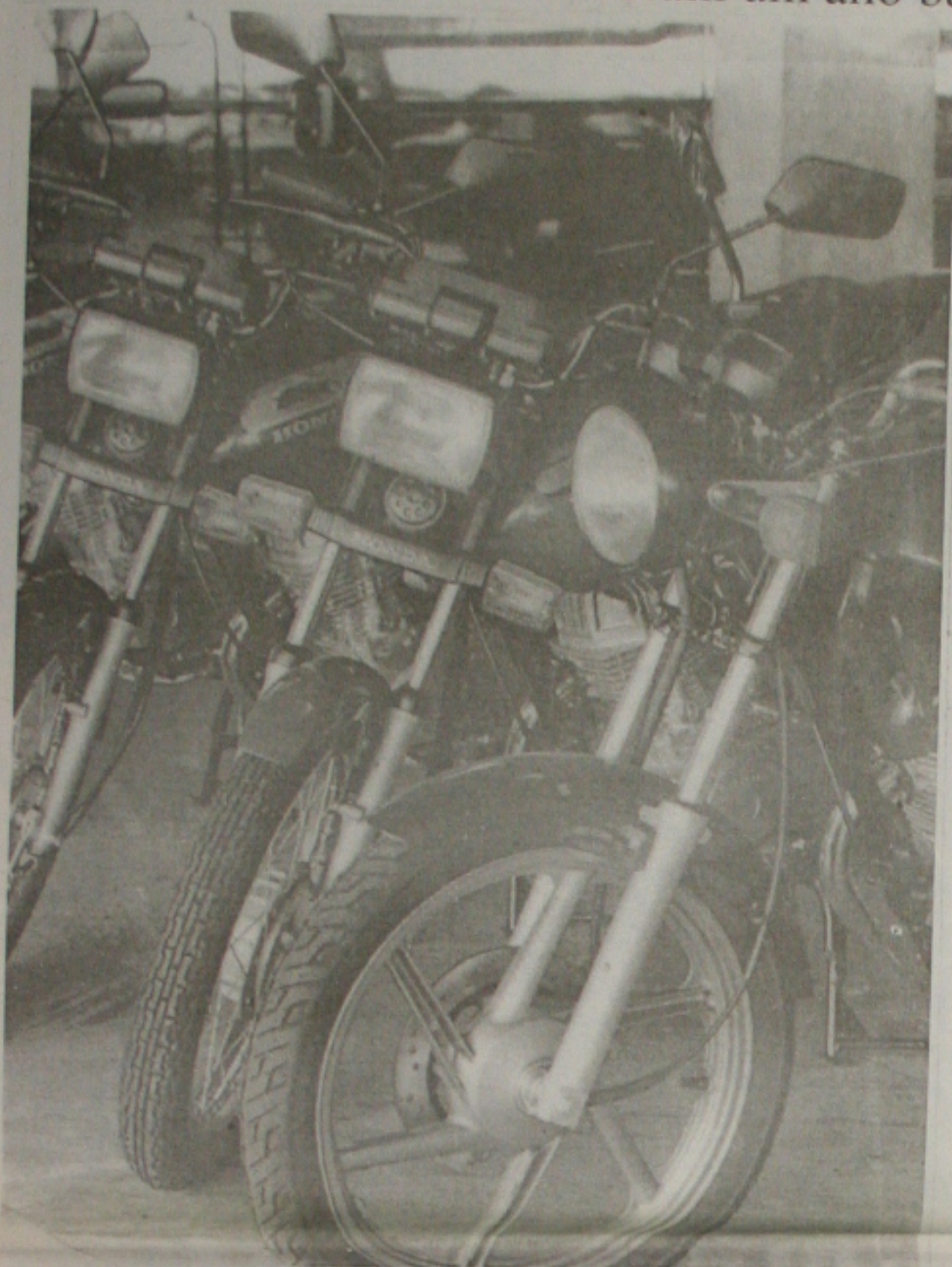
As concessionárias registraram crescimento nas vendas de motocicletas de 14% no ano passado

As concessionárias consideram um ano bastante positivo para o setor em todo o País