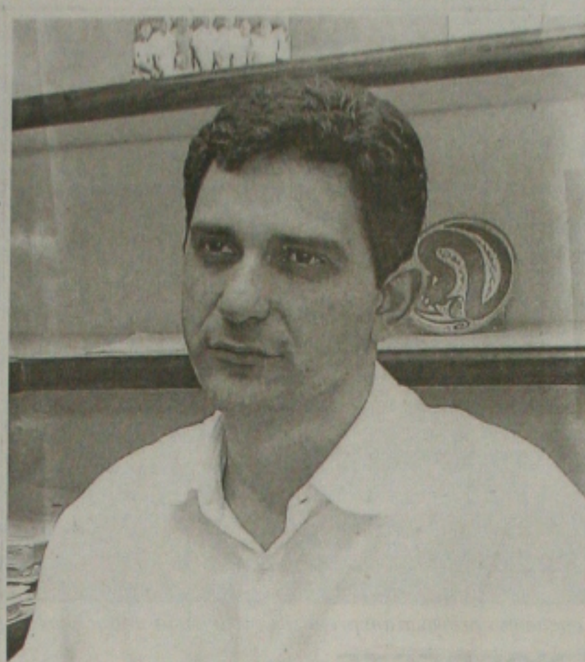
Rogério: município tem interesse em parcerias

RC - Não. Acho que nós que estamos fazendo parte dessa gestão estamos sujeitos a erros e equívocos, e os adversários vão sempre tentar pegar qualquer erro e qualquer equívoco administrativo e dá um tratamento político a essas questões. O que acho que é