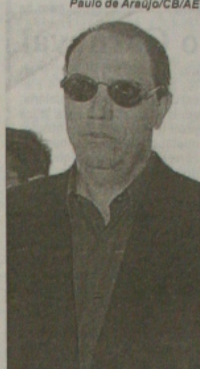
Paulo de Araújo/CB/AE