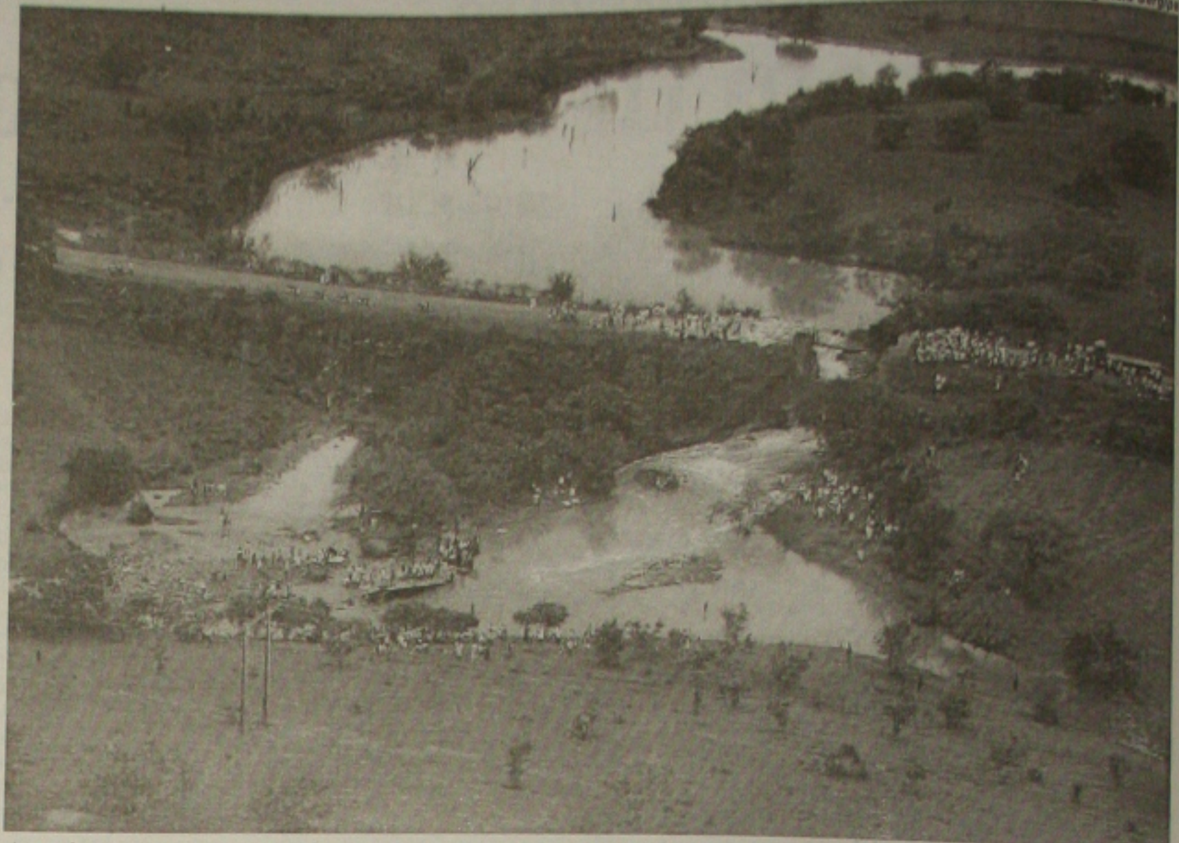
As enchentes provocaram prejuízos em diversos municípios sergipanos, como em Poço Redondo, onde as pontes caíram

O Ministério das Cidades está liberando R$ 16 milhões para que a prefeitura de Aracaju invista na construção de casas populares em áreas de risco. As obras serão executadas ainda este ano.