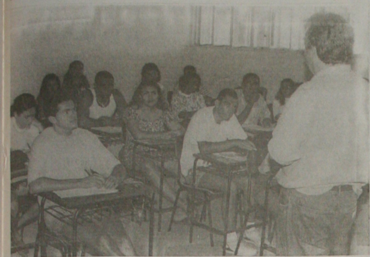
A OAB de Sergipe é contra a abertura de novos cursos de direito e recorre ao Ministério da Educação

Entidade pede ao Ministério da Educação que barre as propostas de criação dessa área