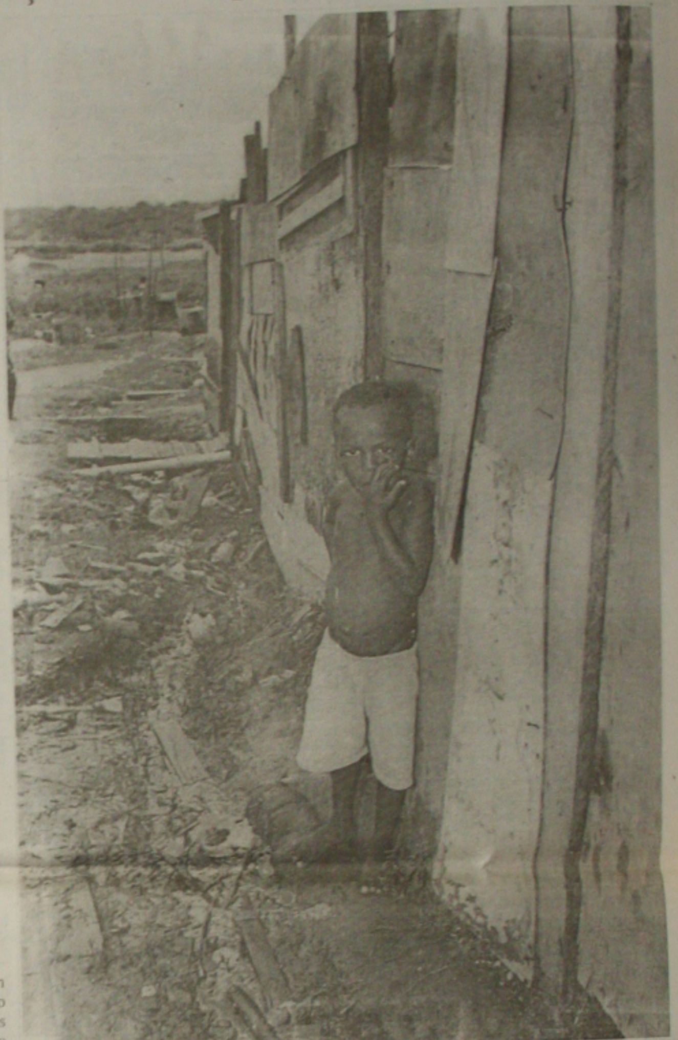
As famílias que moram em favelas aguardam por moradia digna para os filhos crescerem saudáveis