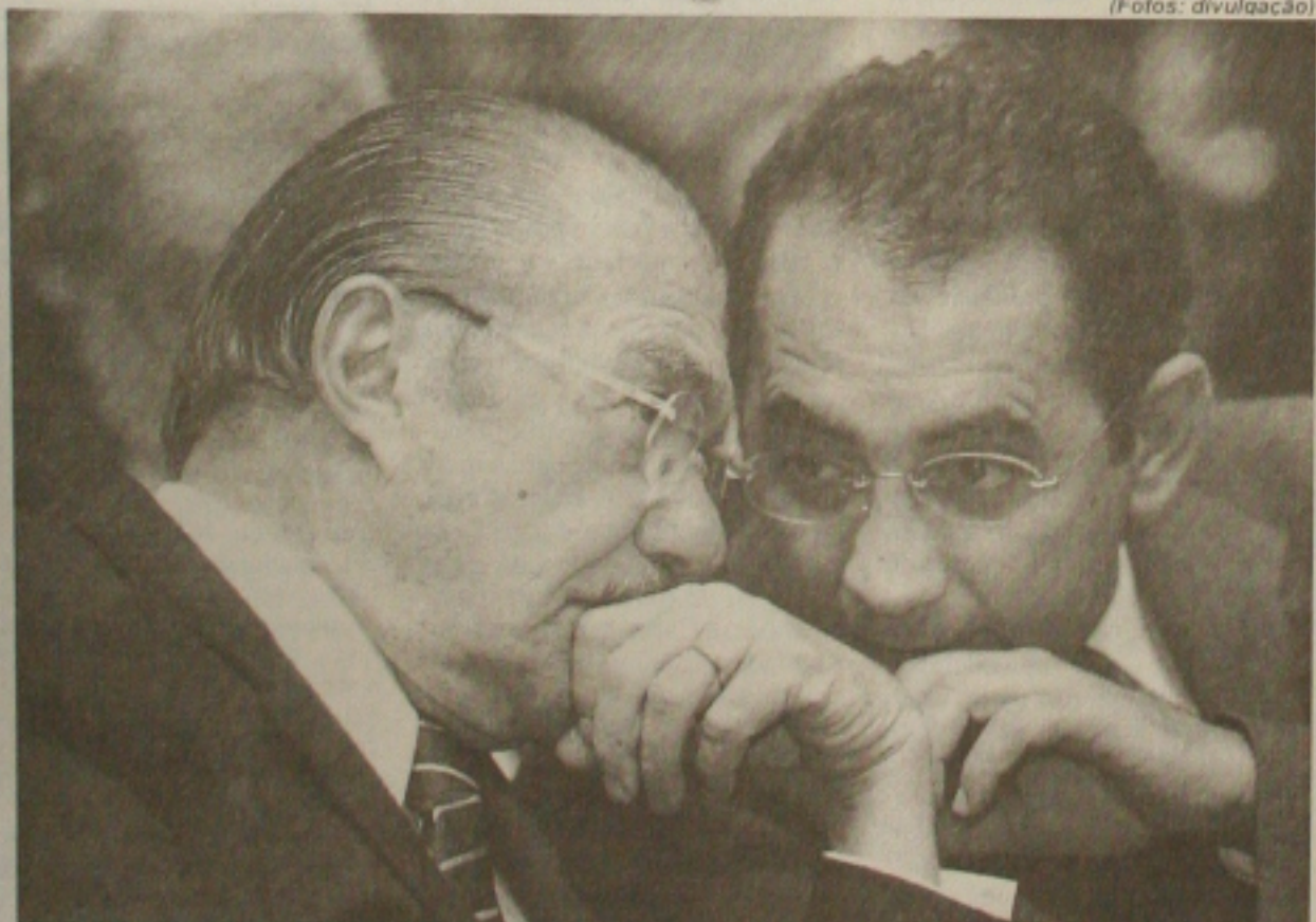
Os presidentes do Senado, José Sarney, e da Câmara, João Paulo Cunha, ajudaram o governo a esfriar o clima no Congresso.