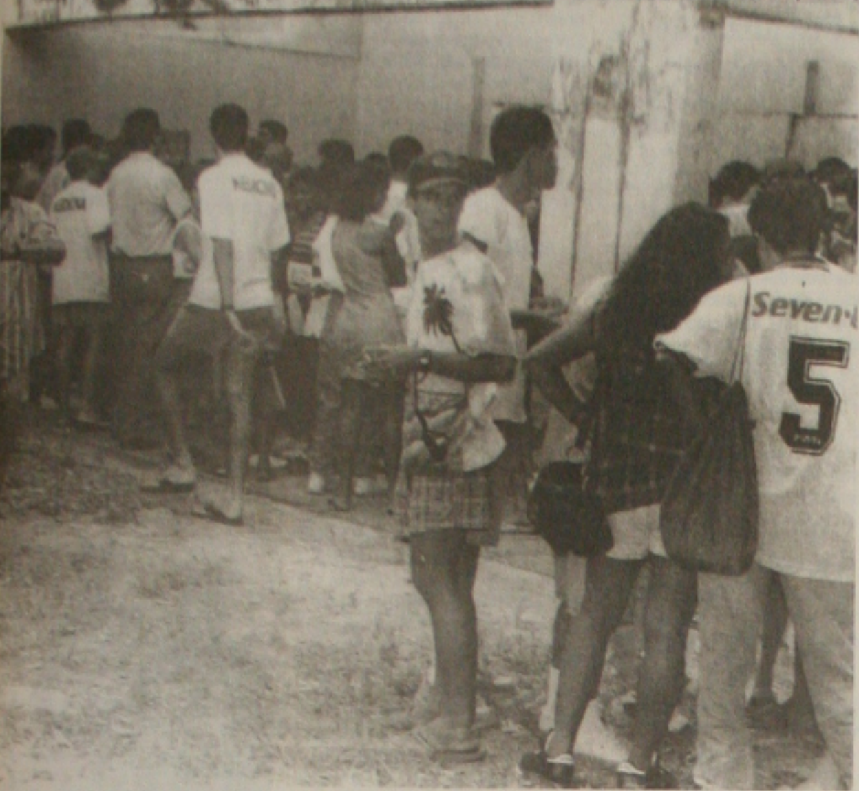
Estudantes da UFS elaboram calendário de luta contra a reforma universitária proposta pelo governo