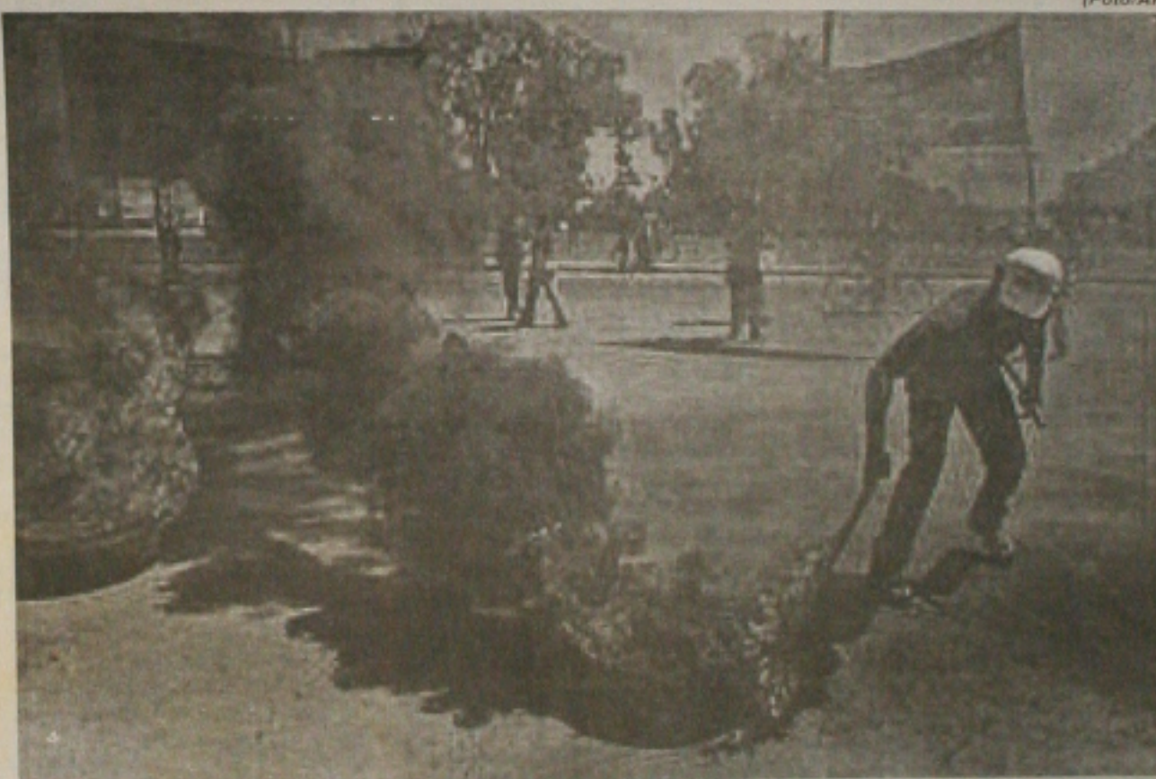
Manifestantes bloqueiam rua de Buenos Aires durante protesto contra o desemprego no país

no libere os 250 mil subsídios considerados irregulares que foram suspensos pelo Ministério do Trabalho. O governo desaprovava a manifestação, mas garante que não haverá repressão. “O que esses setores buscam é a reação do Estado para depois se converterem em vítimas”, disse o chefe de gabinete do governo, Alberto Fernández. (Página 10)