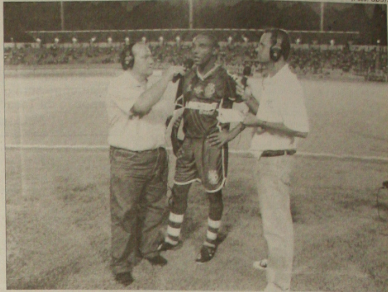
O Capitão Gil admite que o Confiança esteve bem melhor em campo e merecia vencer o Internacional. Gil acredita na classificação.

Desde ontem, que a diretoria trabalha com vistas ao jogo de volta. Segundo Miltoninho, a viagem deve acontecer na manhã do dia 02 de março ou no final da tarde do dia 01. Mas,