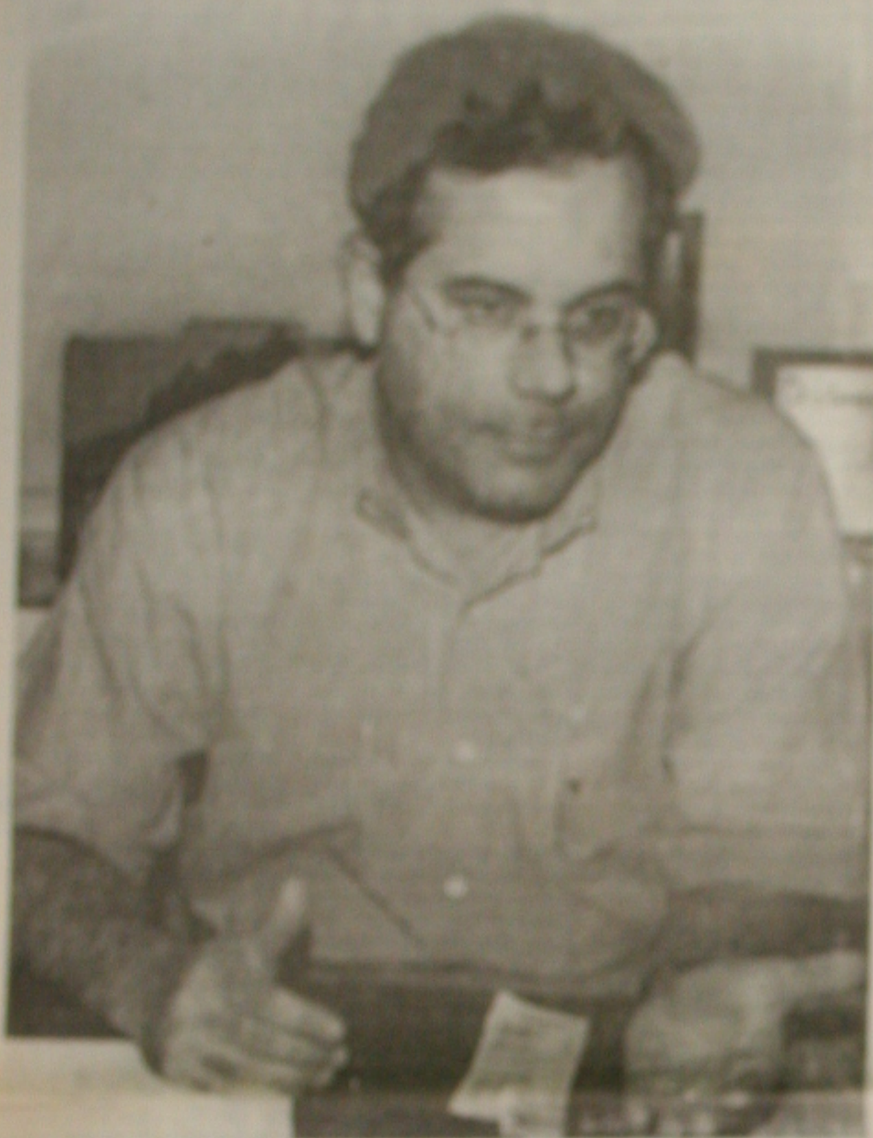
Representante dos shoppings discute o fechamento de comércio e shoppings durante o período de Carnaval

Os shoppings também vão alterar o horário de funcionamento durante a folia de momo