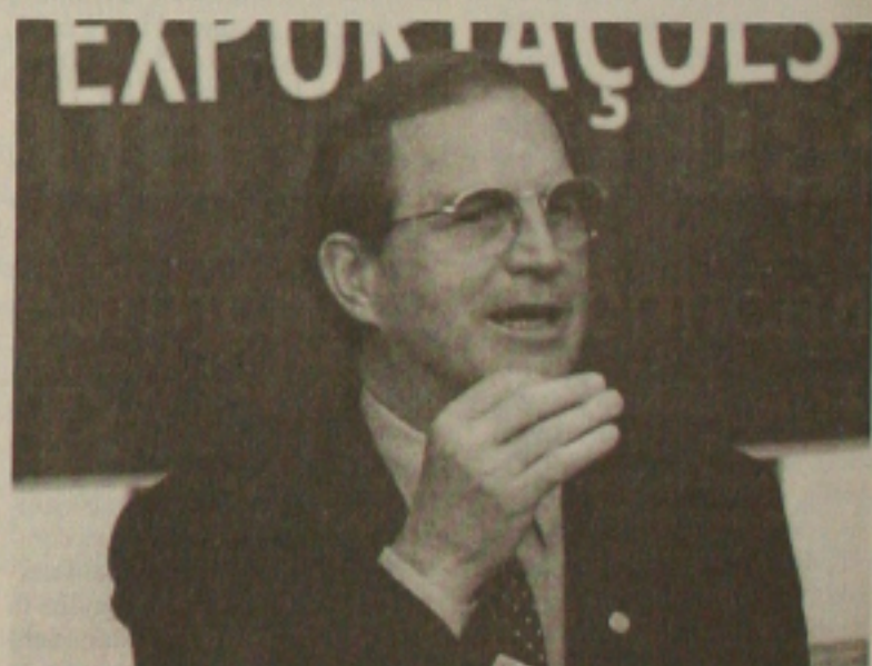
O ministro do Desenvolvimento, Luiz Fernando Furlan, afirmou que o país irá superar a meta de US$ 80 bilhões nas exportações este ano.

Perdido como cego em roteiro, o governo falhou na articulação política e permitiu que senadores da base aliada contribuíssem para reunir as