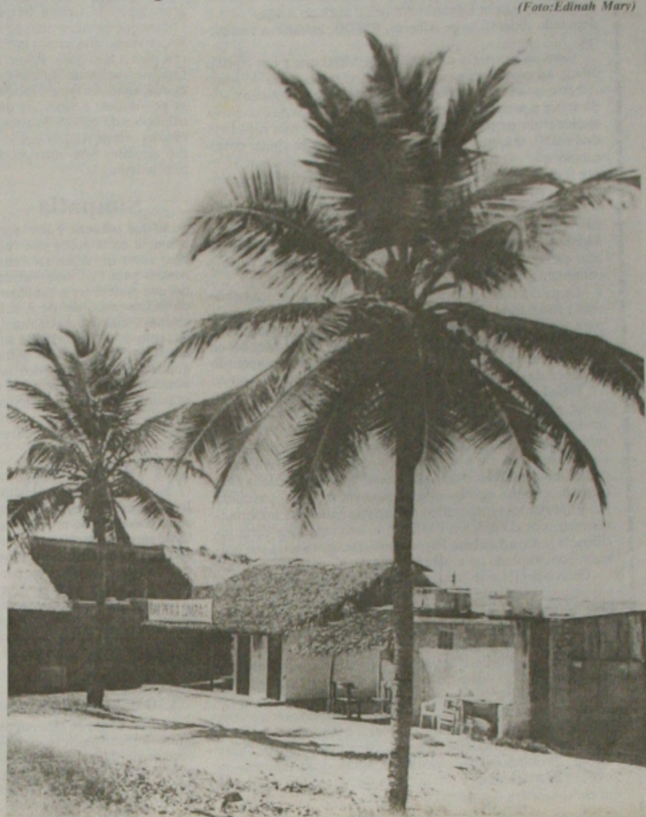
Mais quatro bares da praia de Aruana deverão ser demolidos por decisão da Justiça Federal