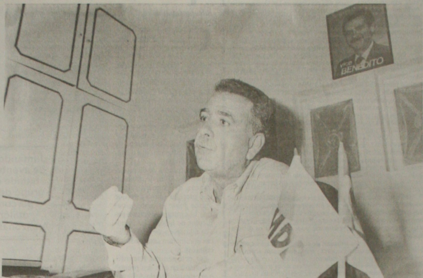
Benedito descarta qualquer composição com o PT

Sobre a aliança formulada a nível nacional, Figueiredo ressalta que foi contra a formação dessa aliança, por entender que o partido teria muito mais ganho se permanecesse sozinho,