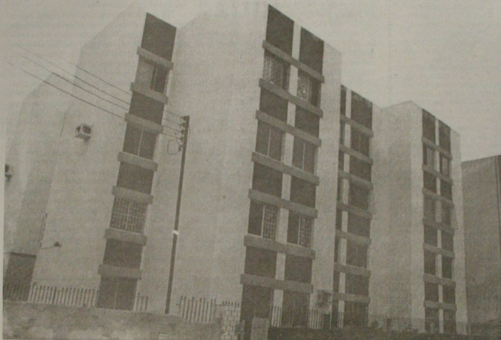
Mutuários não terão direito a optar pela continuação da obra no caso de quebra da incorporadora se suas obrigações fiscais não tenham sido pagas

O governo federal prepara um conjunto de medidas para estimular o setor de construção civil. A partir desta semana deverá entrar em vigor regras que darão maior segurança aos compradores de imóveis na planta. Técnicos estão elaborando alterações nas regras do patrimônio de afetação, um mecanismo criado para evitar que incorporadoras financeiramente quebradas continuem lançando empreendimentos, como foi o caso da Encol, que deixou 42 mil mutuários no prejuízo. O governo também vai procurar atender à população de renda média e baixa. O ministro do Trabalho, Ricardo Berzoini, estuda a possibilidade de baixar as taxas de juros nos empréstimos imobiliários com recursos do Fundo de Garantia do Tempo de Serviço (FGTS). Esse programa atende a famílias com renda mensal de até 12 salários mínimos. (Página 09)