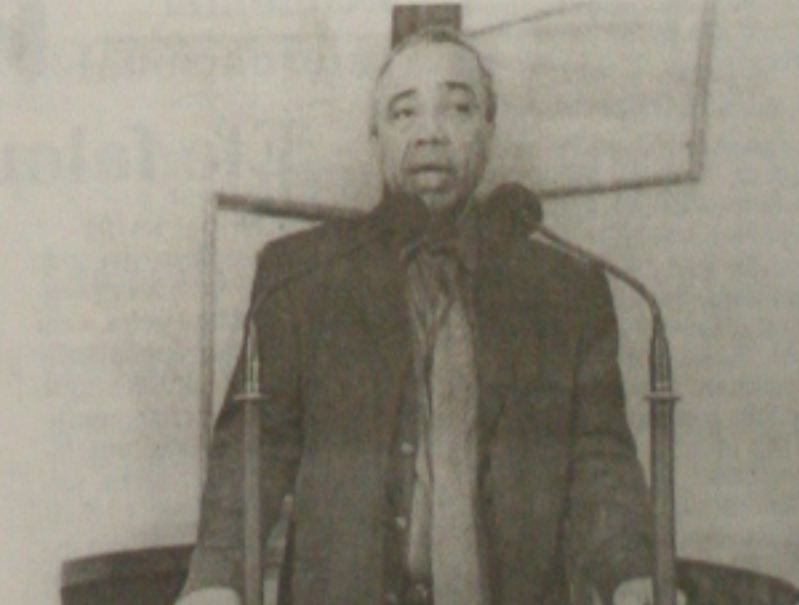
João Alves: homenagem ao judiciário

O governador João Alves considera a obra de pequeno porte ante o valor que tem a Justiça Federal que estava sendo prejudicado pela falta de acesso a sede à altura da categoria. João Alves disse que é uma homenagem ao judiciário que estava quase sem acesso, o que mostra o respeito da atual gestão. O governador ressaltou que a estrada irá beneficiar vários outros órgãos que se fazem presentes no Complexo Administrativo, como o Sesi, a Emdagro, o centro de Zoonoses, o Crea, o Tribunal da União e o