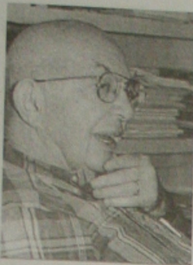
O professor Isaias Raw

Em dose única, esta vacina combinada é aplicada ainda na maternidade. Um carimbo na carteira de vacinação informa aos postos de saúde que os bebês não devem receber as duas doses subsequentes contra hepatite B, pois a própria equipe da Unicamp se encarregará de aplicá-las nas visitas domiciliares, dentro dos prazos estipu-