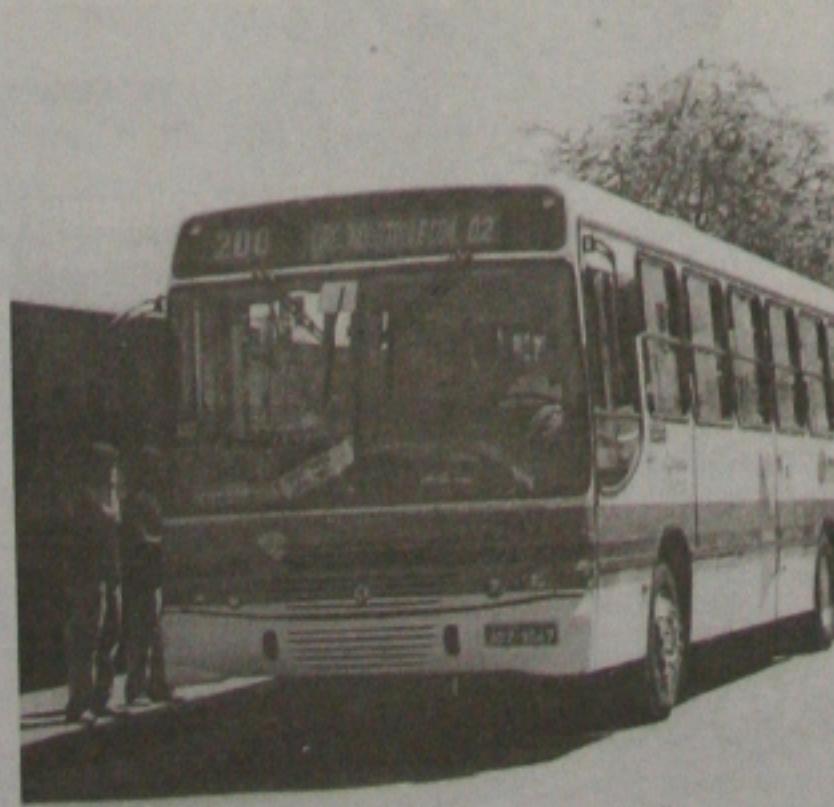
CAAF terá uma linha de ônibus a partir de amanhã

A linha 604 terá o seguinte itinerário: Terminal Mercado, Terminal Centro, Avenida Rio Branco, Terminal Zona Oeste e Centro Administrativo. Serão beneficiados funcionários e usuários de serviços do Centro de Referência da Mulher, Tribunal de Contas da União, Fórum Gumerindo Bessa, Tribunal de Justiça Federal, Hemose, Hospital João Alves Filho, Centro de Zoonoses, Tribunal Regional Eleitoral, Secretaria da Fazenda, Tribunal de Contas do Estado, Sesi e Crea.