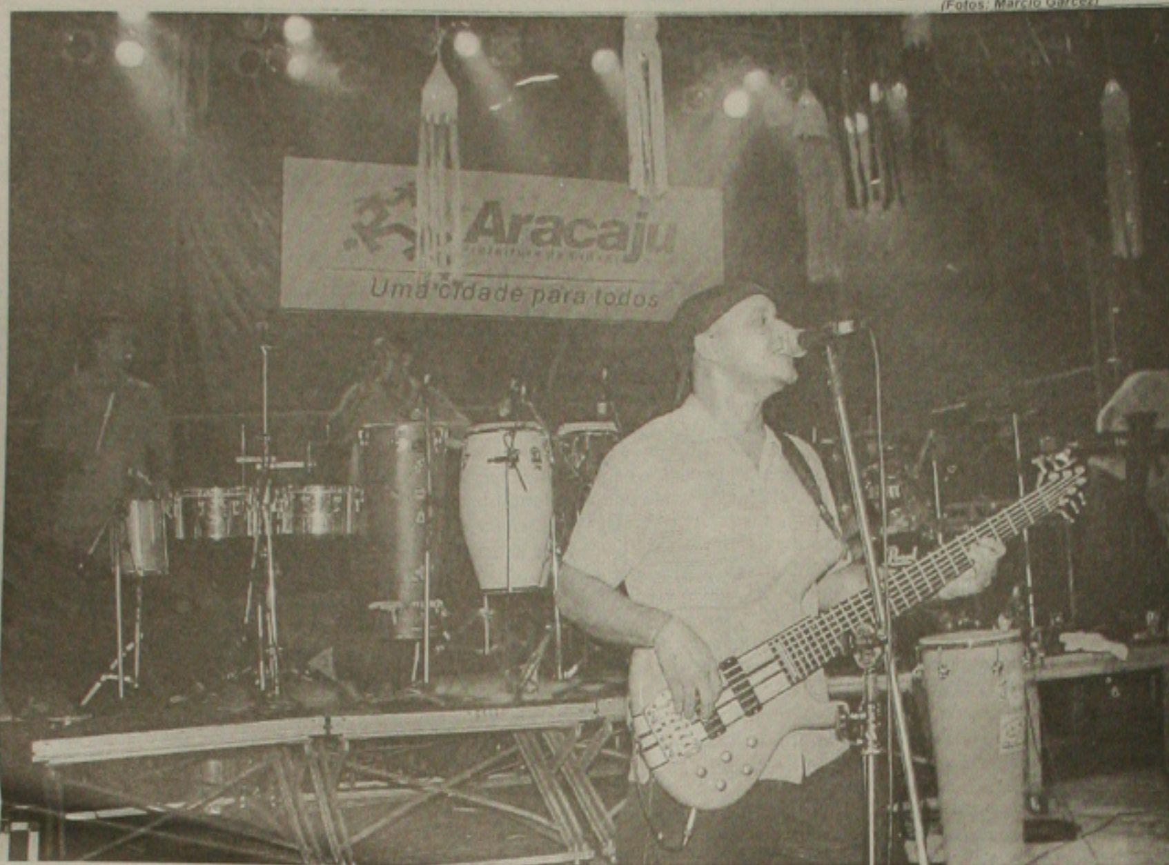
Artistas sergipanos fizeram a festa na programação elaborada pela Prefeitura de Aracaju