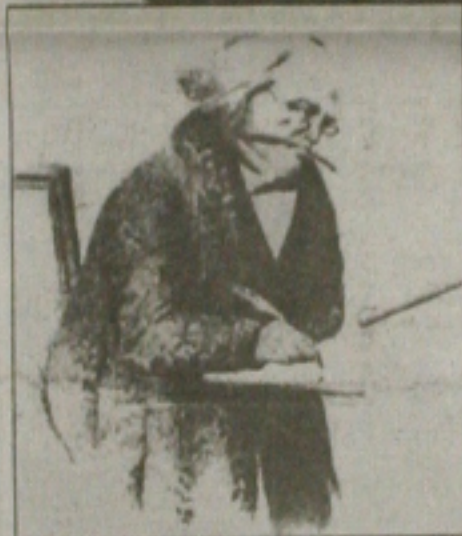
Hércules Florence: Centro de Memória da Unicamp abriga autobiografia do pioneiro