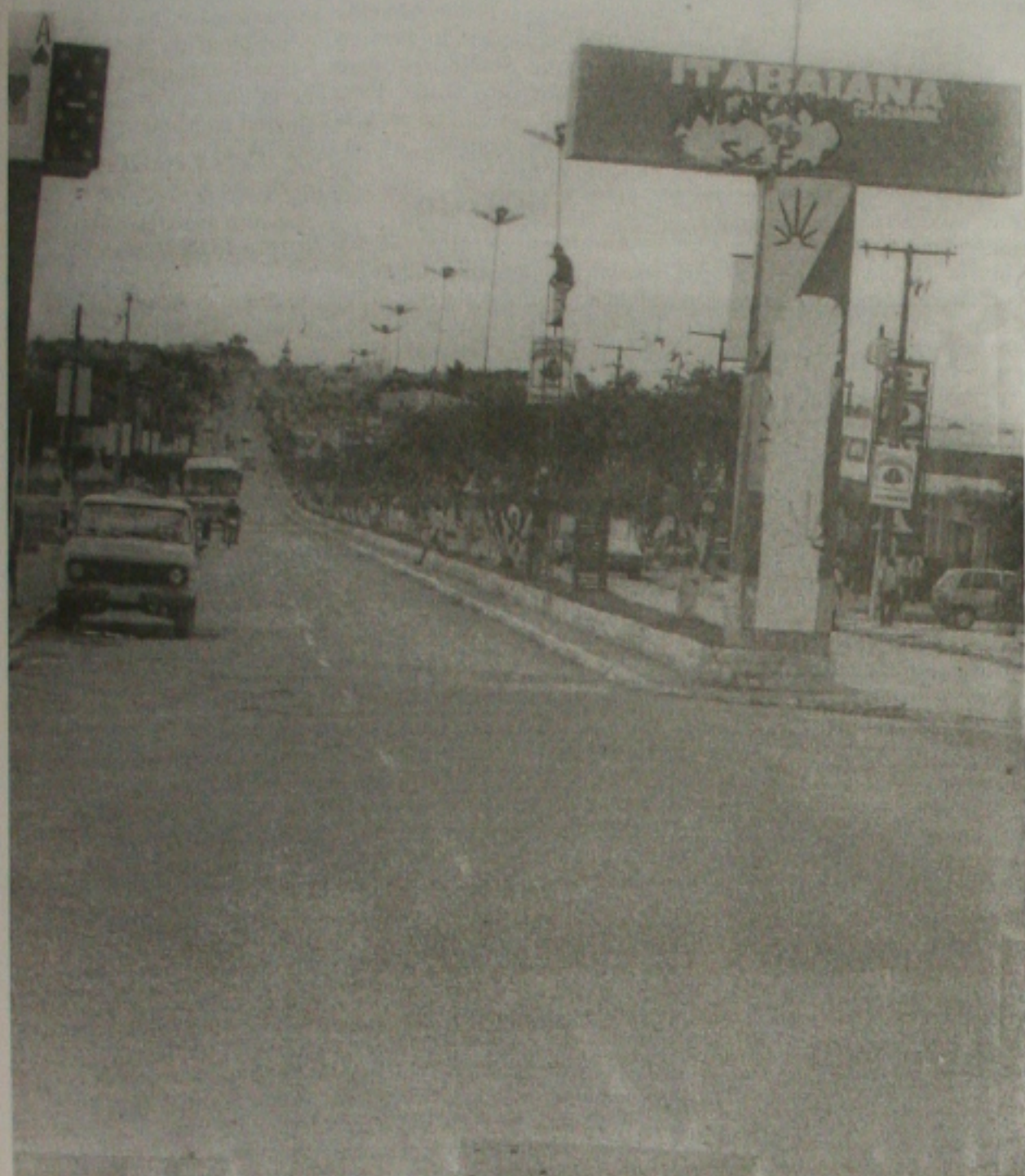
A maioria das prisões e apreensões aconteceu na cidade de Itabaiana, quartel-general da quadrilha