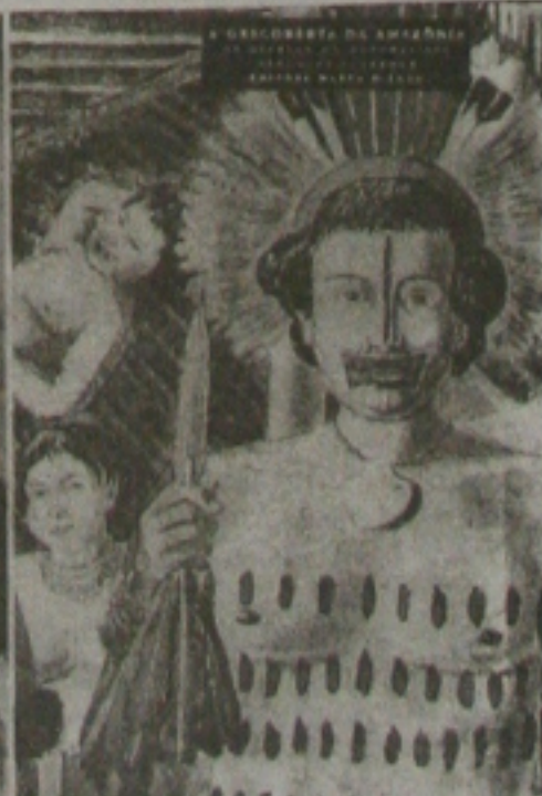
Desenhos feitos por Hércules Florence durante a Expedição Langsdorff: originalidade