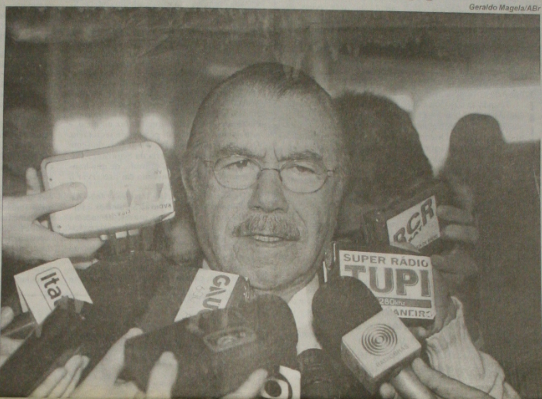
Presidente do Senado, José Sarney, foi a peça chave para sepultar a CPI dos Bingos. Ele alegou que apenas cumpre o regimento

Entre as mercadorias apreendidas estão veículos, combustível, plásticos, antenas parabólicas, caixas de sabão em pó e até roupas, provavelmente produtos de roubo. A polícia trabalha agora para prender o restante do grupo, que tem ramificações em pelo menos dois Estados - Sergipe e Bahia. Em Itabaiana foi encontrado um caminhão roubado na semana passada. Até ontem à tarde, a polícia não sabia do paradeiro do motorista, que pode estar morto. (Página 07)