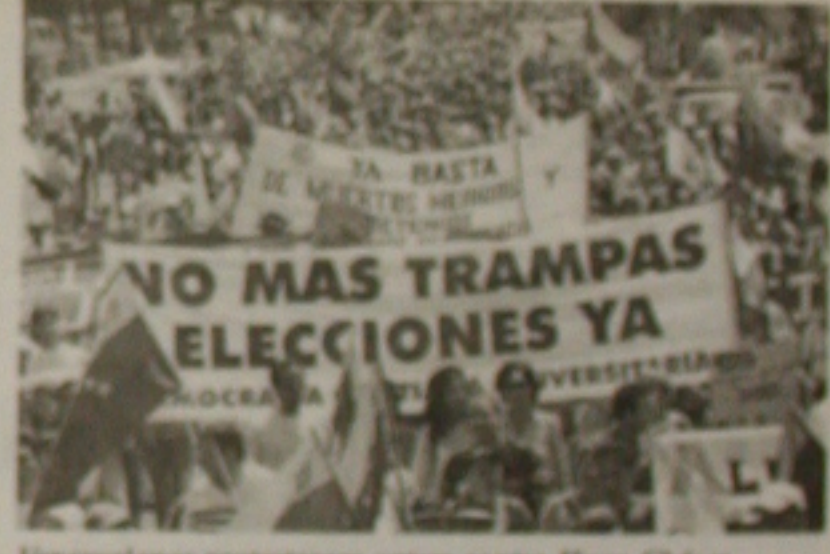
Venezuelanos protestaram ontem contra Hugo Chávez

Os militares dizem que, embora a soberania política esteja para ser transferida em meados deste ano, as forças da coalizão liderada pelos EUA vão continuar responsáveis pela segurança.