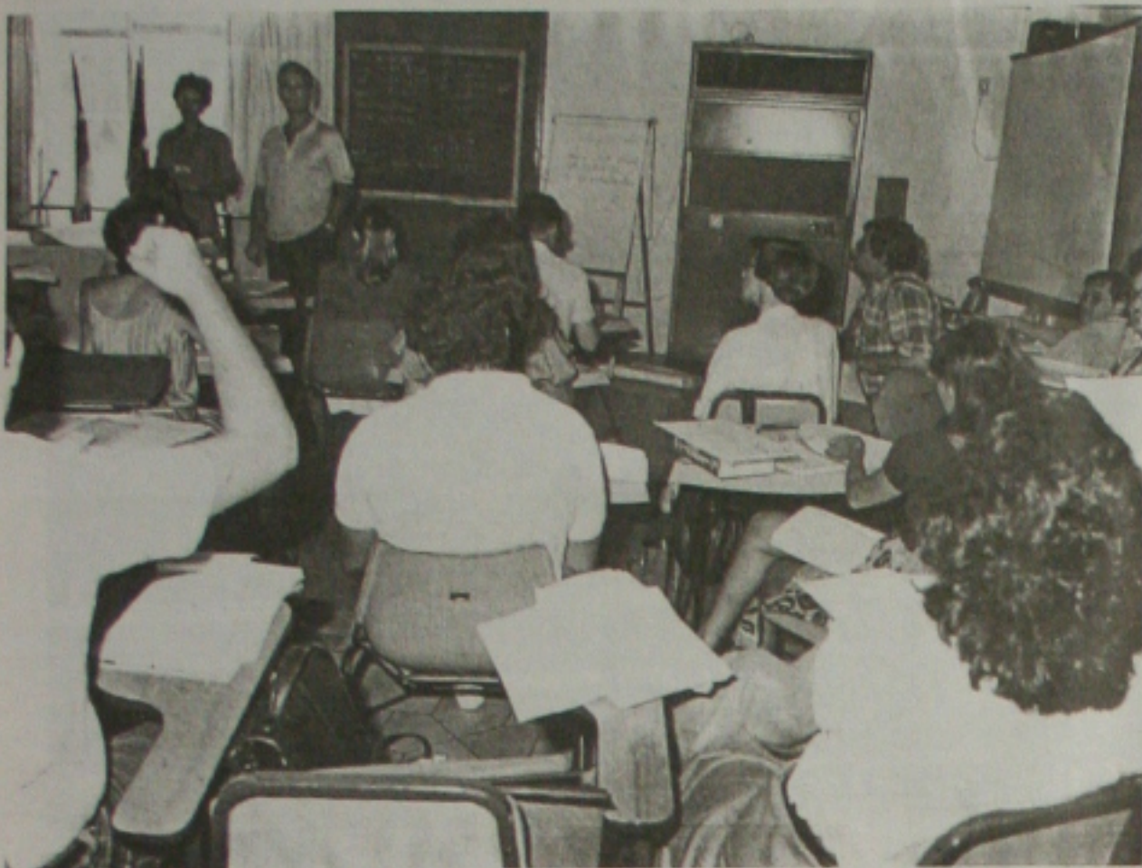
A greve dos técnicos da Receita Federal está prejudicando o atendimento aos contribuintes

Paralisação de 24 horas dos técnicos prejudica o andamento das atividades no órgão