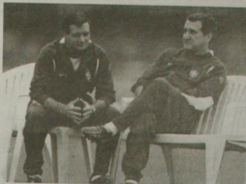
Parreira quer levar todos os titulares

Zagallo acredita que o Paraguai será o maior obstáculo para o Brasil, por ter uma equipe "aguerrida, que joga com raça e valentia". Ele destacou a ascensão gradativa do futebol chileno nos últimos anos e espera uma forte reatracção do time da Costa Rica.