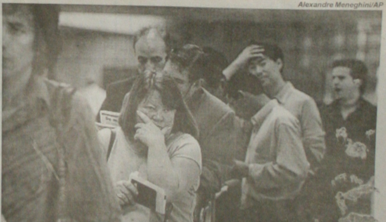
Passageiros enfrentam filas com espera de até três horas no aeroporto internacional de Cumbica, em São Paulo, devido a greve dos policiais federais. Em Aracaju apenas 12 policiais permanecem trabalhando

(PMDB), em encaminhar as contas para a Comissão de Economia, Finanças e Orçamento, impossibilitou a convocação dos membros da Comissão para apreciação a aprovação do parecer que foi favorável pela aprovação. A posição do deputado chegou a constrianger alguns colegas de parlamento, principalmente os da bancada de oposição. (Página 03)