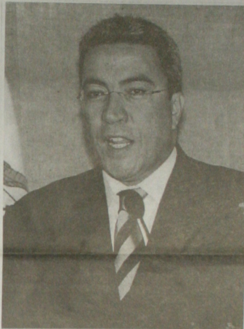
Hoje, podem enviar flores, presentes e telegrama de felicitações para o prefeito de Aracaju, Marcelo Déda. Ele é o ilustrante aniversariante do dia