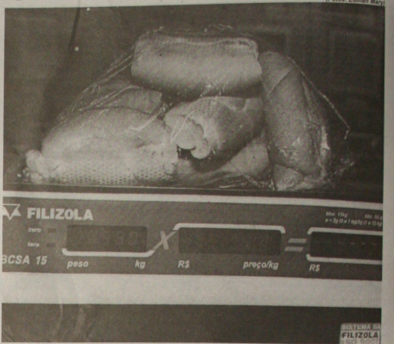
A população aracajuana a partir de amanhã terá que comprar o pãozinho francês no peso