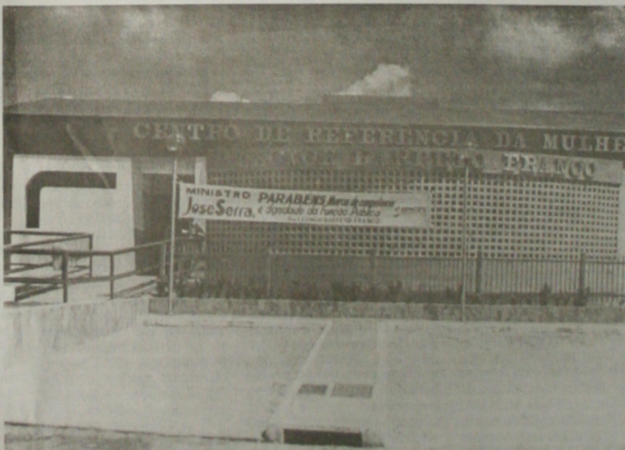
O Centro de Referência da Mulher realizou curso de capacitação para citopatologistas