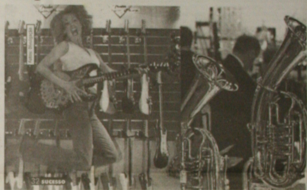
A mostra é considerada pela Messe Frankfurt a maior do mundo

E para facilitar o acesso do público aos diferentes lançamentos que são realizados em cada edição da Musikmesse, a feira, mais uma vez, será dividida em nove pavilhões, por grupos de instrumentos. Desse modo, por exemplo, poderão ser encontrados os teclados clássicos, enquanto que no pavilhão 3.1 estarão expostos