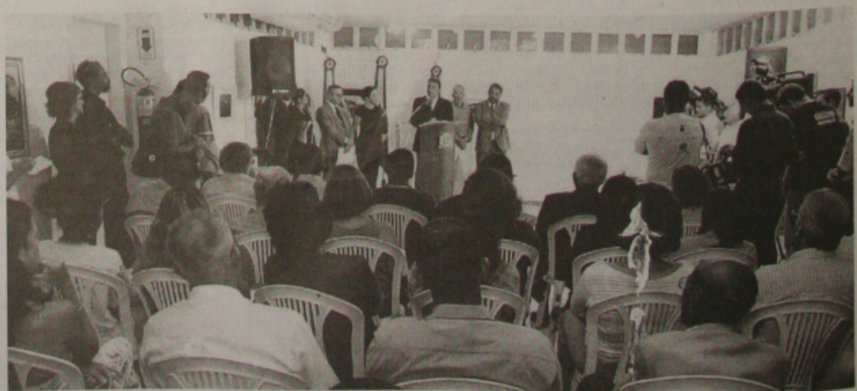
O prefeito discursa destacando a história de luta do povo aracajuano