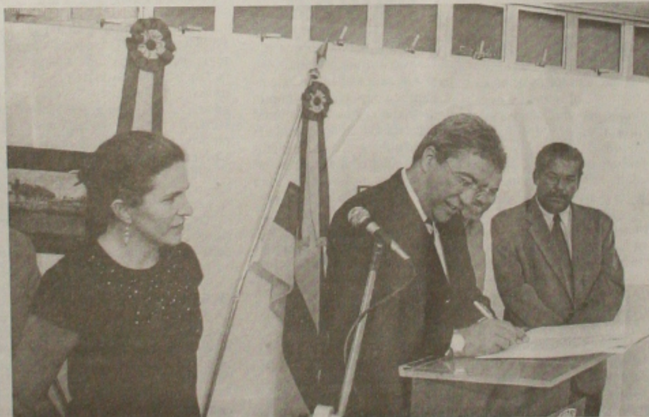
O prefeito lança concursos para escolha dos hinos da cidade e do sesquicentenário

As grandes atrações da festa que será realizada na praça dos Hilos Hilton Lo-