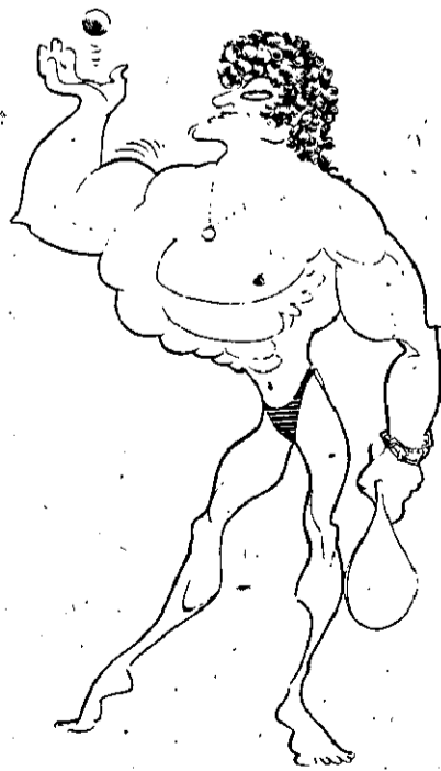
encantar as mulheres

Mas anunciar no JORNAL DA CIDADE é a maneira de atingir com maior impacto, e de uma vez só, os homens de negócio, as mulheres que trabalham, as donas-de-casa (e seus filhos), gente que lê Jornal e tem dinheiro para comprar. Com toda essa turma de seu lado, é lógico, ninguém precisa fazer contas nem consultar as estatísticas - em pouco tempo vai ser fácil constatar que a sua mensagem chegou, que seu anúncio saiu mais econômico.