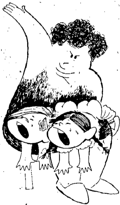
convencer a juventude