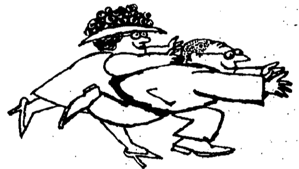
atrair a classe média