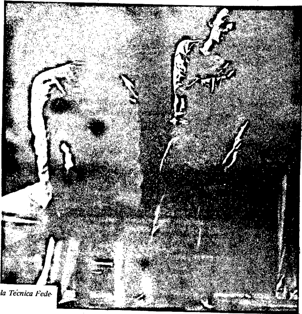
'Um Santo Homem', as 21 hrs., na Escola Técnica Federal. Promoção SCAS.

Não sei se ele vai ler esta notícia, mas se isto acontecer peço-lhe que apareça, por favor. Quero fazê-lo meu amigo. Foi a melhor aula a que assisti. A vida em toda a sua virginal brutalidade.