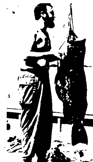
Cuba, Fidel Castro Ruz, primeiro ministro

Fontes dos exilados anti-castristas na capital mexicana disseram não saber de plano algum de invasão ou envio de armas a Cuba, acrescentando que suas informações indicam que 25 a 30 oficiais jovens foram presos por falar contra o Governo na ausência de Castro, que se encontra atualmente numa viagem pela Europa Oriental.