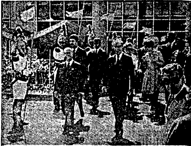
O presidente Médici e o ministro Buzaid, na inauguração do novo Palácio da Justiça

BRASÍLIA - O presidente Médici afirmou ontem, que continuará a ter, por certo, ao menos até agora, "total devotamento para que o regime da revolução prossiga, com a mesma impetuosidade, no caminho que se traçou, confundindo, pelas suas realizações os profetas do pessimismo e os negativistas de todos os matizes".