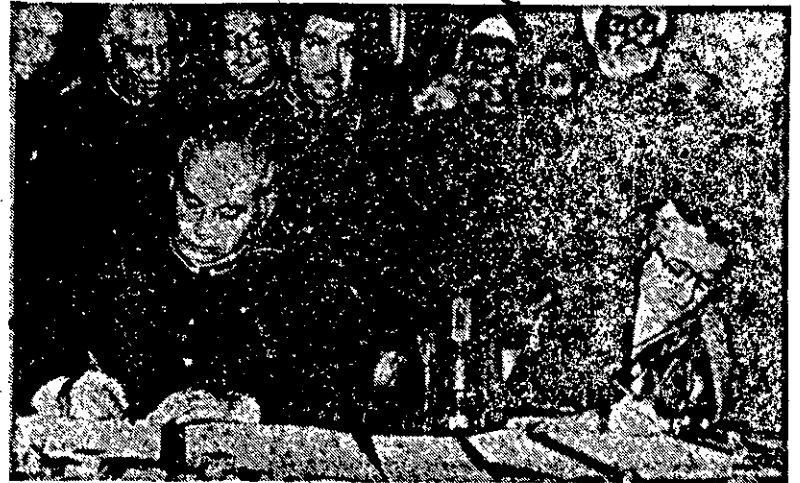
Indira Ghandi e Ali Bhutto assinaram o esperado acordo

SIMLA - O presidente do paquistão, Zulfikar Ali Bhutto, voltou ontem ao seu país, para convocar uma reunião especial da Assembléia Nacional a fim de ratificar o seu acordo com o primeiro-ministro da Índia, Indira Gandhi, o que porá fim a 25 anos de hostilidade no subcontinente.