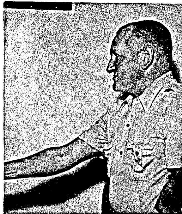
O presidente Manuel Cardoso mais uma vez desfaz tudo e classifica mais dois: Olímpico é o favorito e não pode ficar de fora.