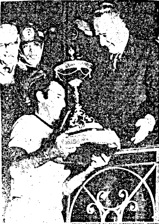
BRASIL, CAMPEÃO DA TAÇA INDEPENDÊNCIA (GERSON)

Um total de Cr$ 25 mil foi quanto recebeu cada jogador do Brasil que participou da Taça Independência. Pela conquista do troféu, cada um recebeu Cr$ 12.500,00 e pela vitória ante Portugal Cr$ 4 mil.