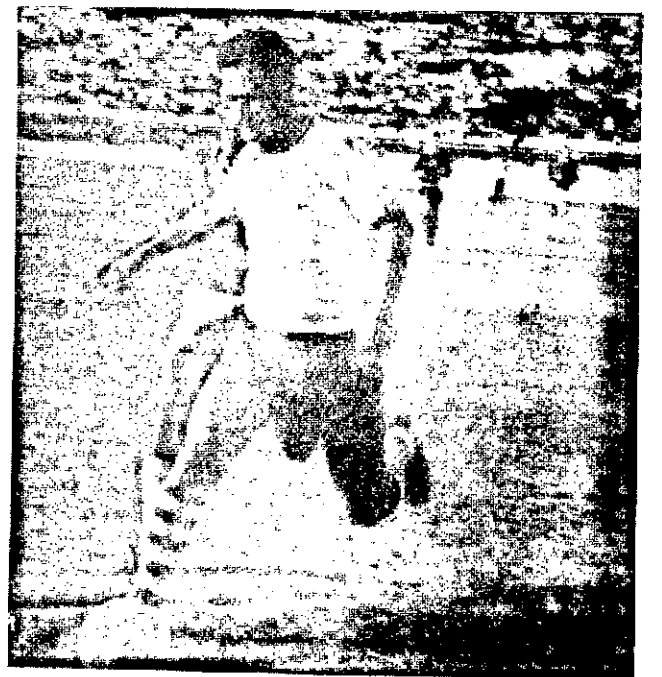
A CORRIDA PARA UM NOVO CONFIANÇA