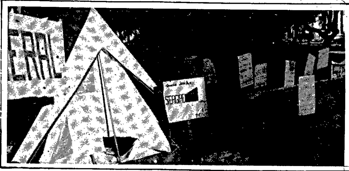
Acampados, os médicos voltam a...