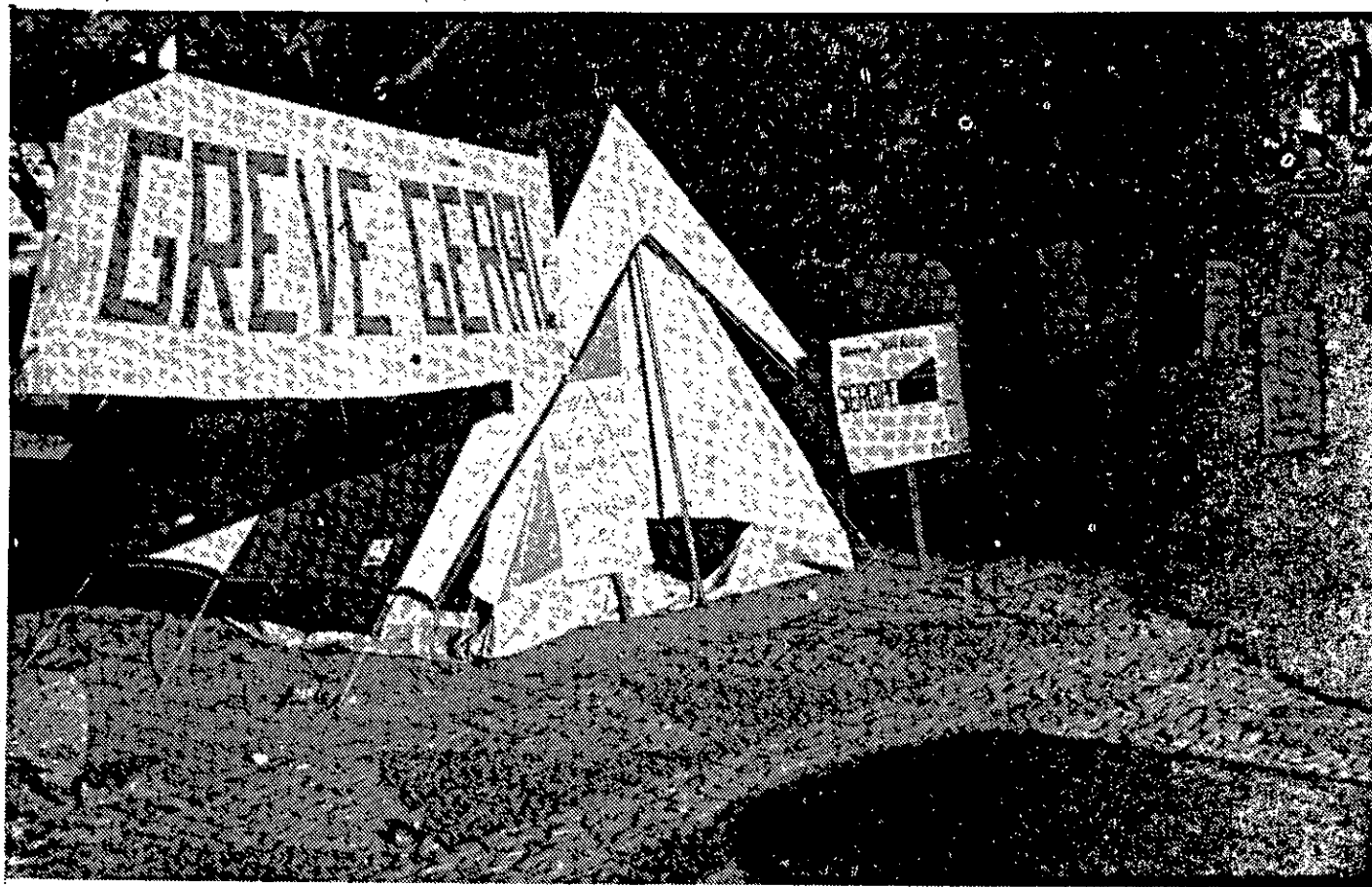
Os profissionais de Medicina voltam a acampar em frente ao Palácio.

Os profissionais da área de saúde que prestam seus serviços ao Estado, voltaram a acampar em frente ao Palácio Olímpio Campos, onde também estenderam uma faixa com o seguinte dizer: "Queremos Diálogo". Na parte da tarde, os representantes da categoria, presidentes de sindicatos e de associações de moradores, reuniram-se na sede da Sociedade Médica de Sergipe.