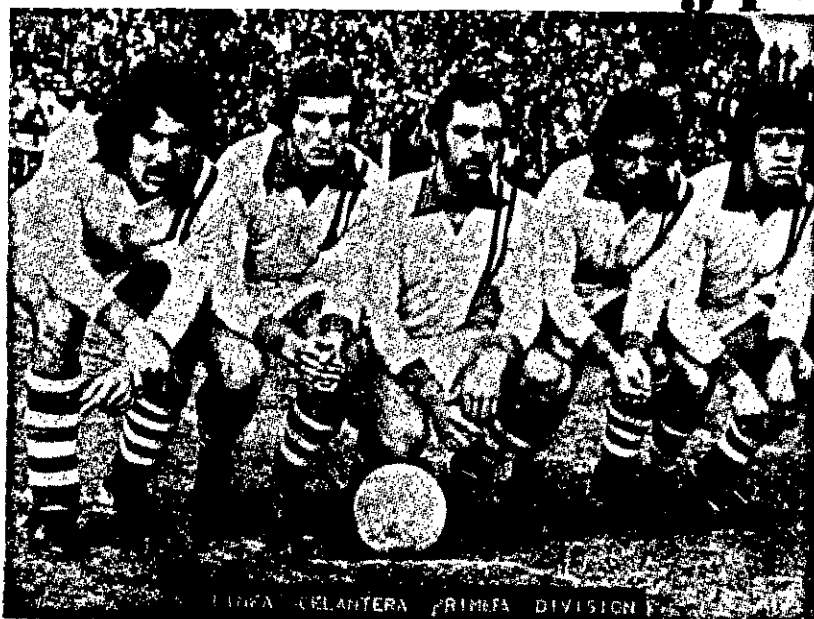
ESTA É A LINHA OFENSIVA DO ARGENTINO JÚNIOR, QUE NO DIA 7 VAI ENFRENTAR O MAIS QUERIDO NA REABERTURA DO BATISTÃO.