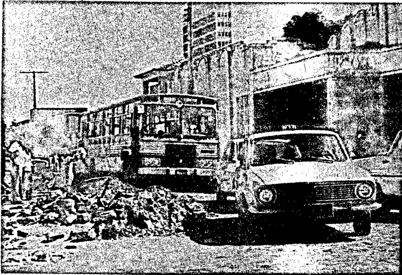
O "funil" da rua de Capela dá passagem apenas para um veículo. A confusão reina, como bem se pode observar.