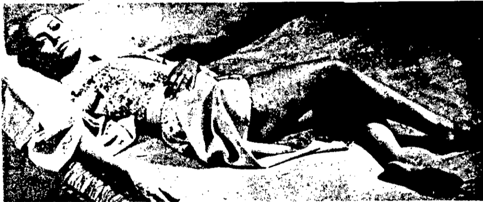
A NOITE DA VERGONHA — A vida de três jovens numa cidade industrial.