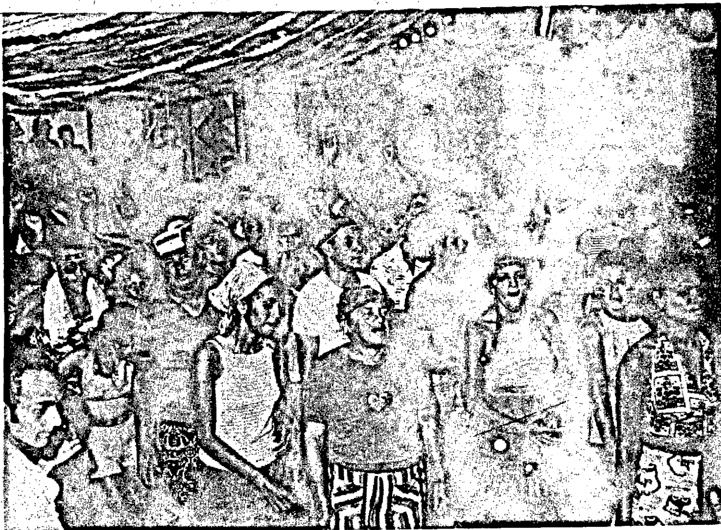
...e no Cotinguiba, havia muito espaço para se dançar.

O desfile das escolas e blocos premiados, na noite da terça-feira primou pela desorganização. Talvez sentindo que ninguém iria a praça ver desfiles vazios e sem graça, a Polícia não mandou patrulha para a praça. Assim, as poucas pessoas que foram à praça invadiram a pista, deixando uma nesga de rua para o desfile. A partir da rua de Laranjeiras podia-se ver o desfile com muita tranquilidade, simplesmente porque não havia muita gente nas ruas. O Trio Elétrico da Bomfim, foi quem animou o carnaval de rua. Por onde ele passava, trazia — incorporando-se ao seu rebanho — novos foliões que, poucos trechos adiante se dispersavam.