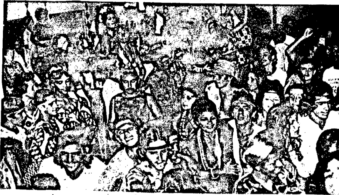
A Associação Atlética teve um dos melhores Carnavais dos últimos tempos, seguida de perto pela...