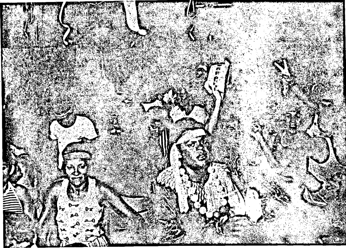
O Vasco esteve bastante incrementado nos quatro dias de Momo...