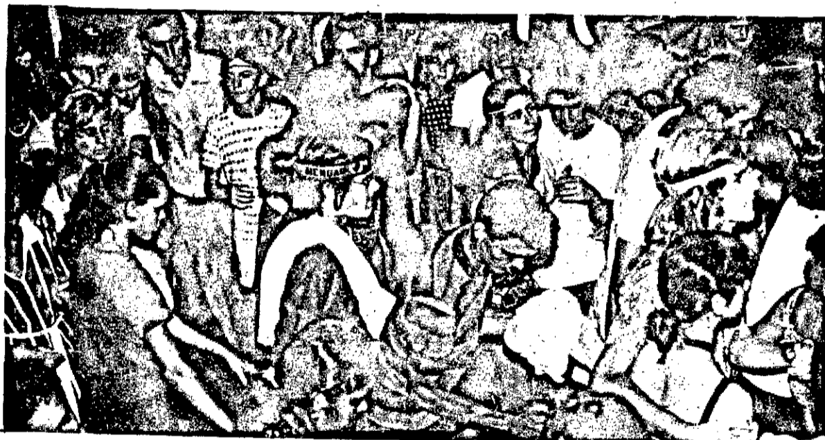
AABB que realizou na opinião, de muitos, o melhor Carnaval de clubes.