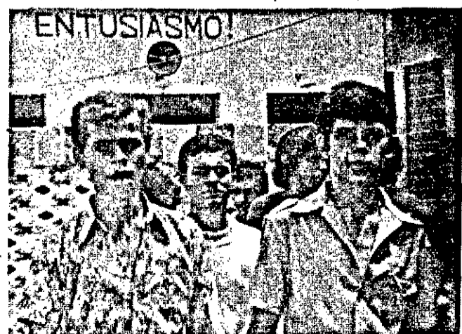
ENTUSIASMO! É a palavra que define realmente o estado de espírito dos alunos que reiniciam seu currículo escolar no Jackson de Figueiredo.