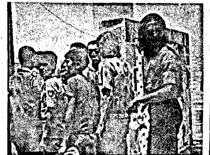
Após o período de férias os alunos do Jackson voltam ao reencontro com os mestres e ao convívio dos antigos e novos colegas.

Aos diretores, professores, funcionários e alunos do Colégio Jackson de Figueiredo as justas homenagens da comunidade sergipana às quais se associa o JORNAL DA CIDADE.