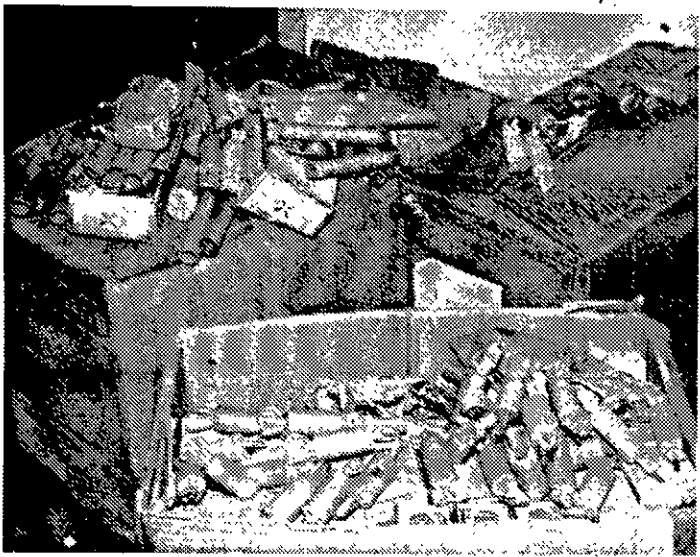
Os fogos estavam sendo vendidos em local impróprio.