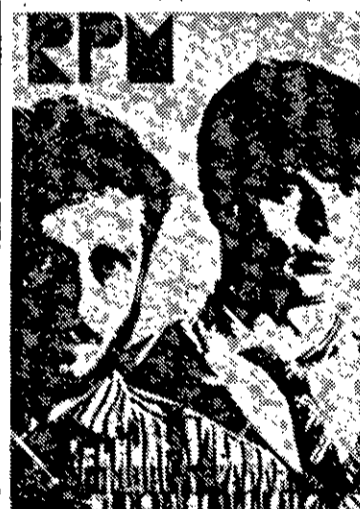
O grupo RPM que estourou nas emissoras de rádio e danceterias do Brasil inteiro com o rock Louras Geladas, não faz por menos e ataca

com seu primeiro LP, Revoluções Por Minuto (cujas iniciais dão nome à banda). O álbum pode ser caracterizado pelo som de um rock-afônico, rascante, contemporaneamente sonorizado pelos teclados de Luiz Schiavon, o baixo e os vocais de Paulo Ricardo (ambos, compositores do grupo), a guitarra de Fernando Deluqui e a pulsação da bateria de Paulo (P.A.) Pagni, o mais novo integrante.