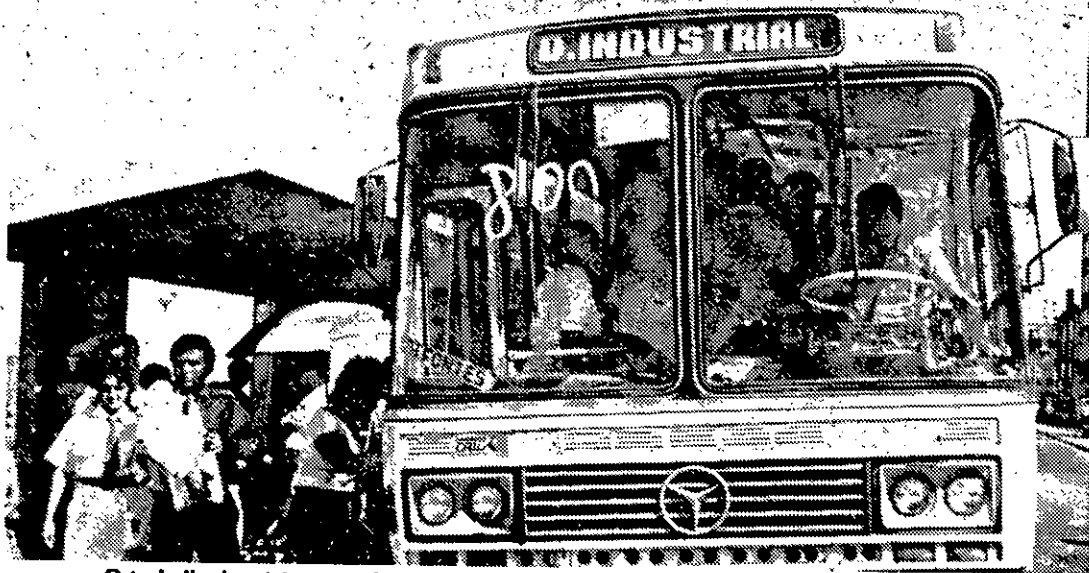
O trabalhador deixa uma boa parte do seu salário nas borboletas dos ônibus

Os maiores protestos partiram dos assalariados, que terão de gastar 64 mil cruzeiros mensais para se deslocar ao trabalho, utilizando ônibus quatro vezes ao dia, de segunda a sexta-feira. Os pais de família que ganham salário mínimo