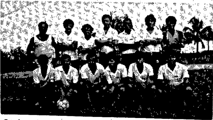
Esta é a equipe do Jornal da Cidade que venceu a Tribuna dando um verdadeiro show de bola.