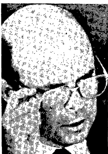
Dornelles: acusado de intransigência.

Esses dois trabalhadores já vieram várias vezes a Aracaju nos dois últimos anos solicitar providências do Governo do Estado que até hoje nunca foram tomadas. A direção da Codevasf por sua vez, alega que não pode fazer nada porque aguarda decisão judicial.