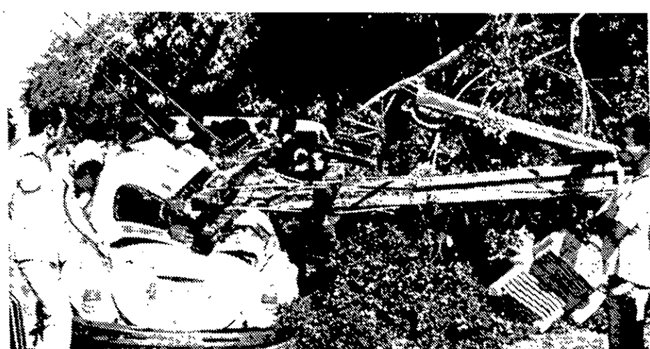
O impacto provocou um pequeno curto-circuito.