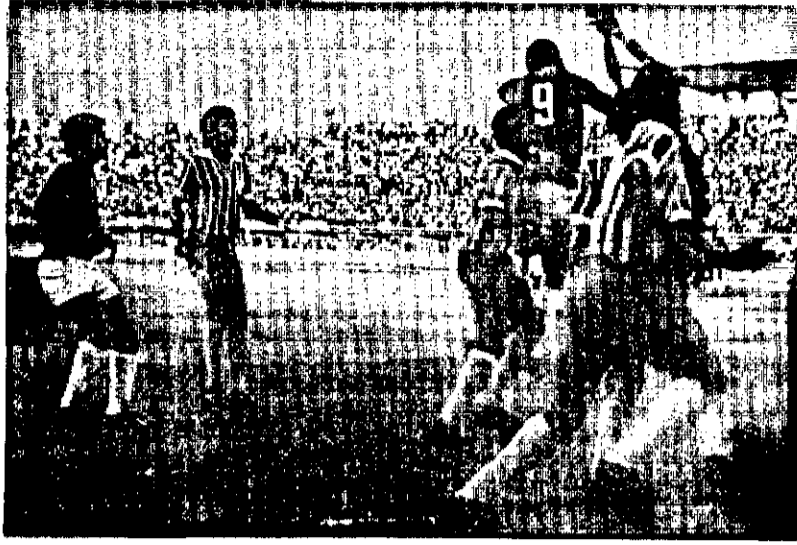
Muita garra e muita luta é o Itabaiana hoje na Fonte Nova.

Atendendo convite do Vitória da Bahia, o Itabaiana estará se apresentando hoje à noite na Fonte Nova em sensacional partida amistosa. Levando em sua delegação todos os titulares, o time serrano deixou nossa capital no dia de ontem e espera um bom resultado hoje diante do Leão da Barra. Pelo que já apresentou em campos da Boa Terra, o time serrano goza de um grande prestígio na Bahia, podendo levar um bom público ao Estádio da Fonte Nova.