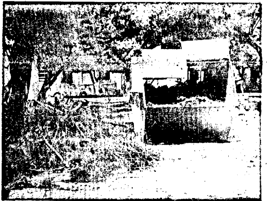
Apesar das providências que estão surgindo para combater o lixo em nossa capital, muita água ainda vai ter que correr sob a ponte, para que esta cidade fique realmente limpa. No Parque, o depósito de lixo já cheio, parece fitar preguiçosamente o munturo ao seu lado que dia a dia, mais aumenta...