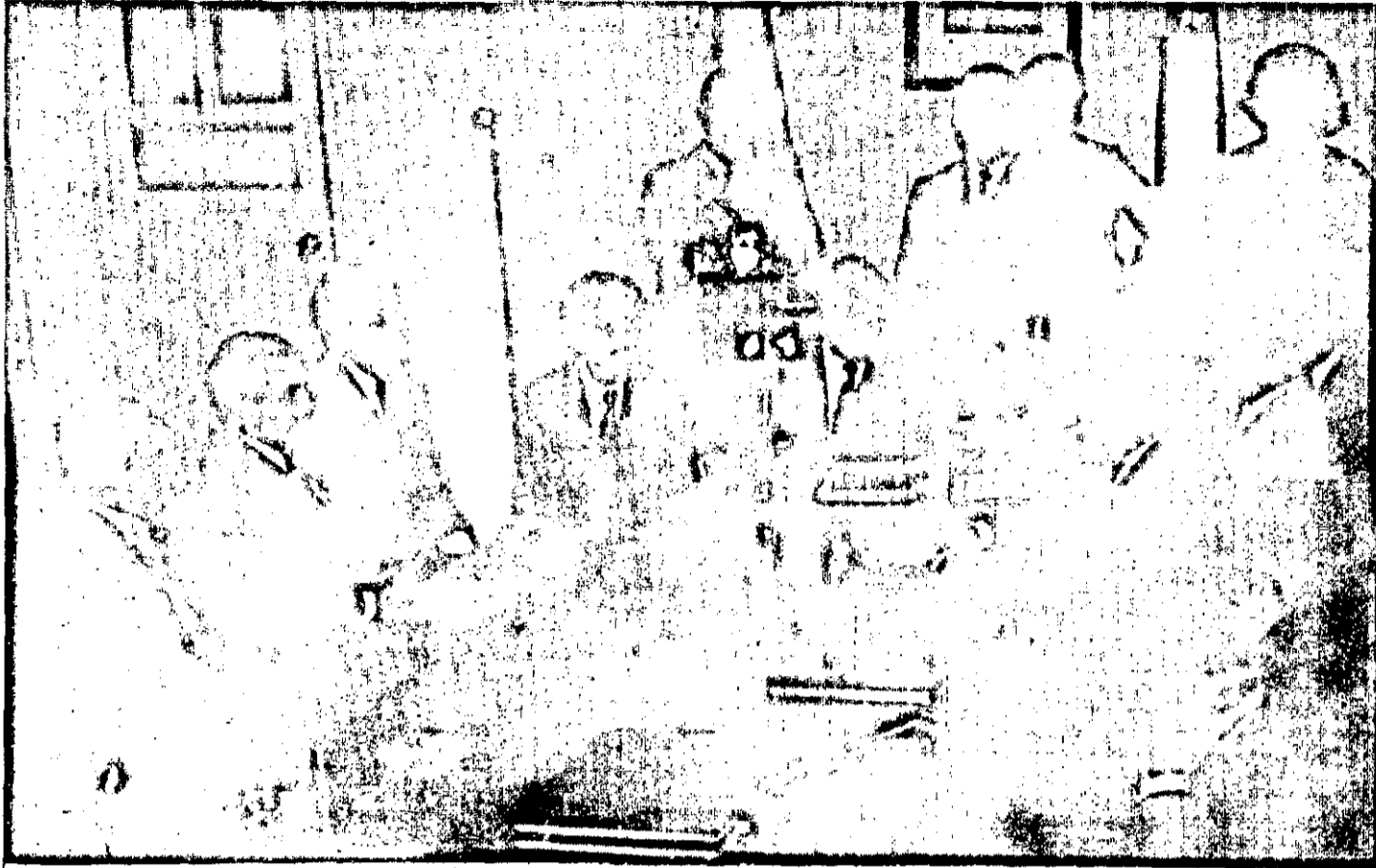
Momento solene para o amadorismo sergipano: o Governador Paulo Barreto assina o contrato para construção do novo Ginásio de Esportes.

O dr. Wellington Ribeiro, que integra o grupo responsável pela futura implantação da Abais Fiação S/A, pronunciou ontem pela manhã, importante discurso na solenidade realizada no Palácio Olímpio Campos, quando o Governador Paulo Barreto, assinou contratos para construção de cinco galpões industriais localizados no Distrito Industrial de Aracaju e mais um Ginásio de Esportes junto ao Estádio Lourival Baptista.