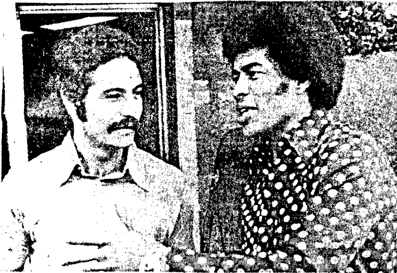
Jairzinho e Rivelino dois tricampeões, são os atletas mais procurados pelos italianos para as entrevistas e autógrafos. O primeiro vem liderando bem seus amigos dentro de campo, transformando-se no

maior atleta dessa excursão. O segundo faz sua estréia hoje e promete muito gols, revivendo jogo do México.