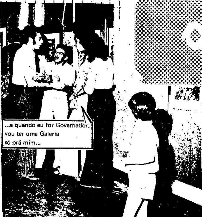
...e quando eu for Governador, vou ter uma Galeria só prá mim...

O "Diário de Aracaju" de ontem fez uma matéria que é um primor de desinformação.