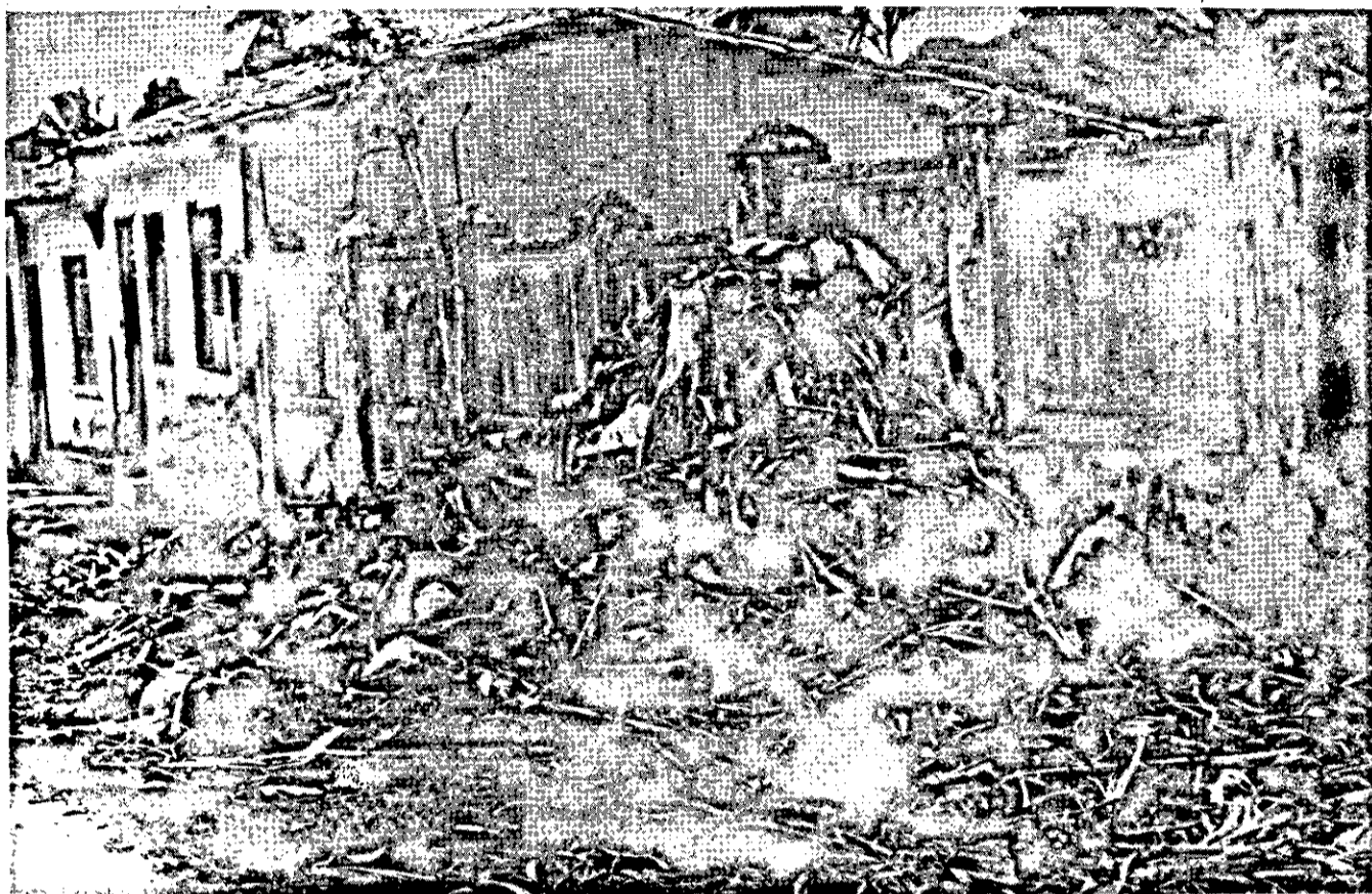
O lixo jogado nos fundos da Igreja do Espírito Santo.