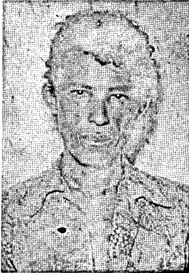
O criminoso de Propriá.