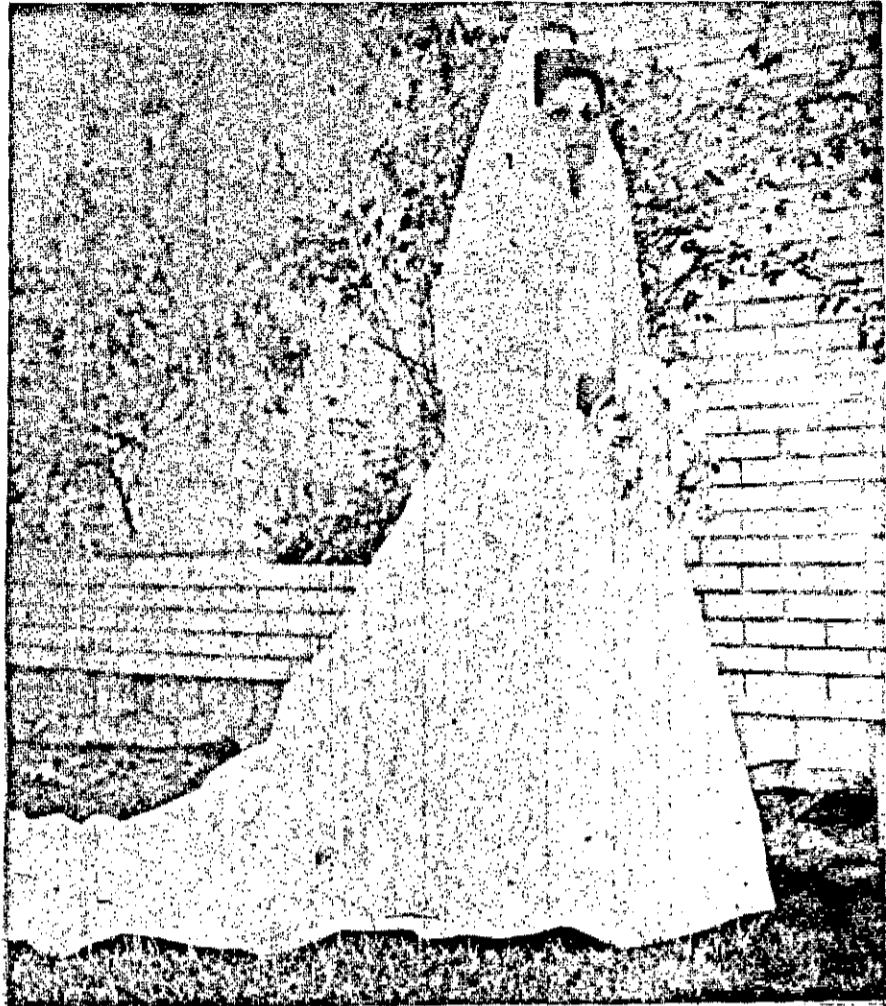
Tereza Cristina foi outra noiva de dezembro das mais belas.