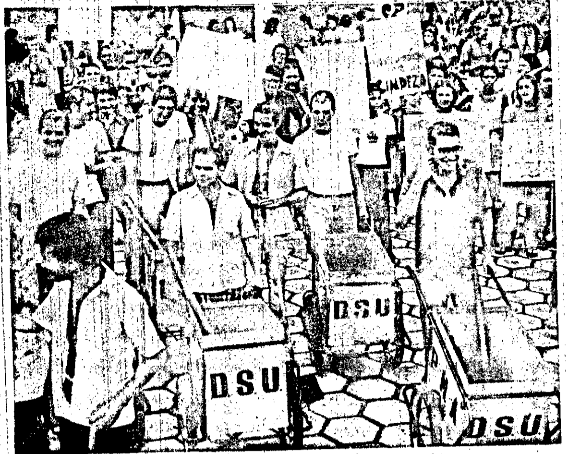
Estudantes de Biologia, Medicina e Odontologia realizaram um trote coletivo em meio a grande euforia, como bem atesta o flagrante acima.