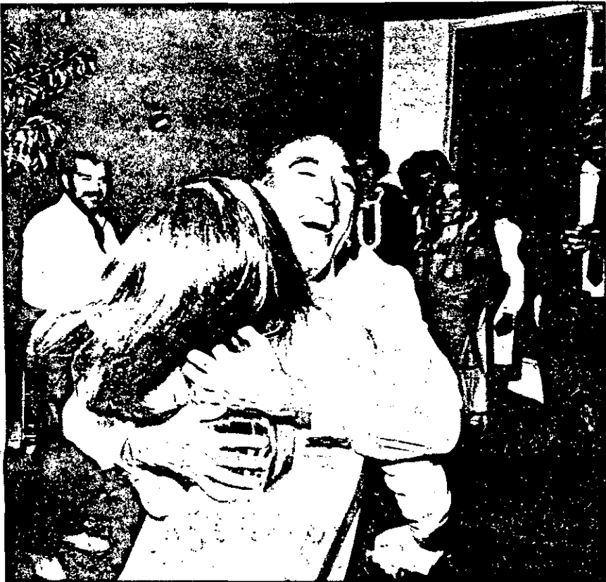
A vocação para escritor se revelou em Anthony Quinn aos 56 anos.