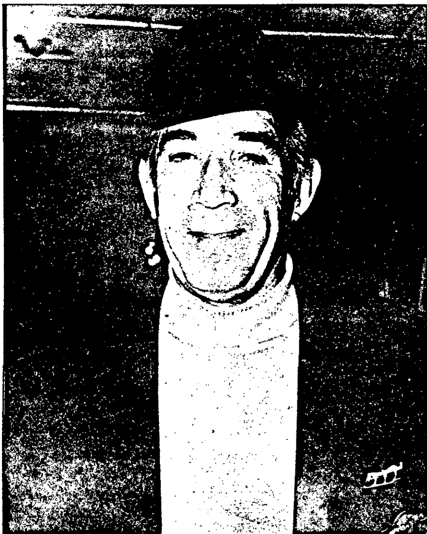
Em seu último filme, Os Amigos , Anthony Quinn interpreta um papel totalmente diferente dos anteriores, de um surdo-mudo. Mas nem esse personagem consegue devolver-lhe o entusiasmo antigo pelo cinema.

" D EPois de lutar muitos anos para conseguir chegar ao cume de minha carreira, me convenci de que não só não sentia apreço por mim, como realmente não podia suportar-me."