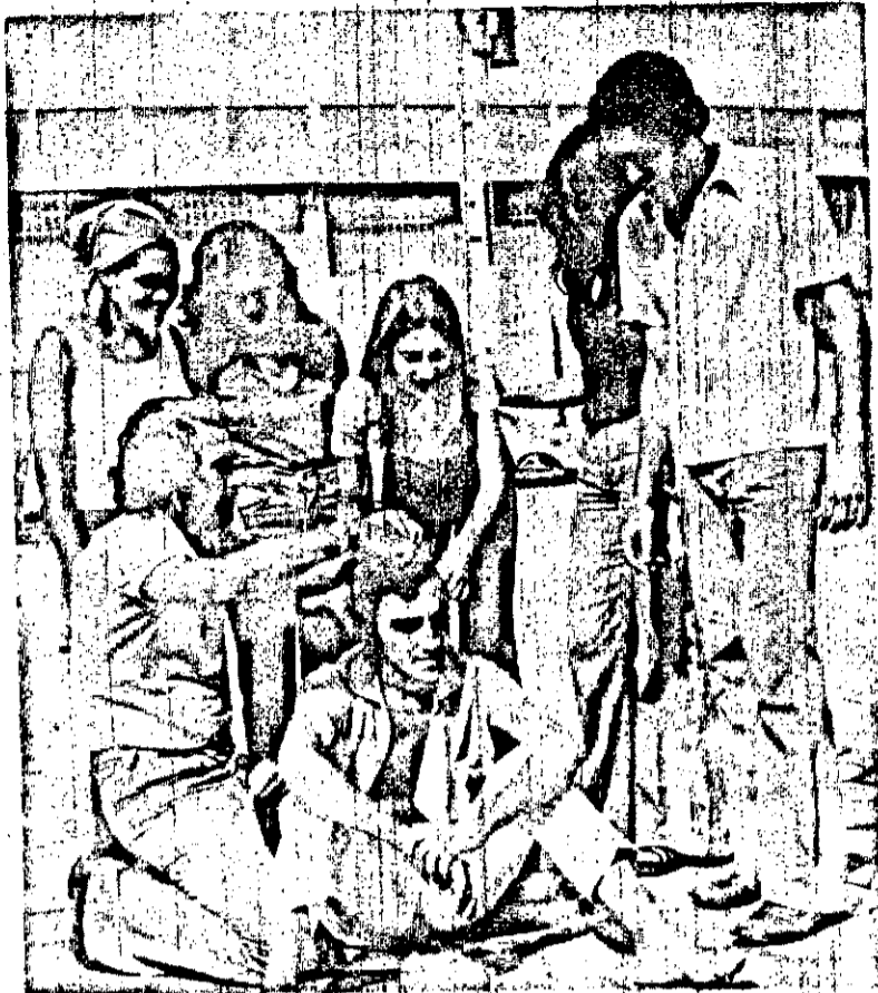
Estudantes veteranos de Medicina cortam o cabelo do calouro que, a julgar pela foto, não está nada satisfeito...