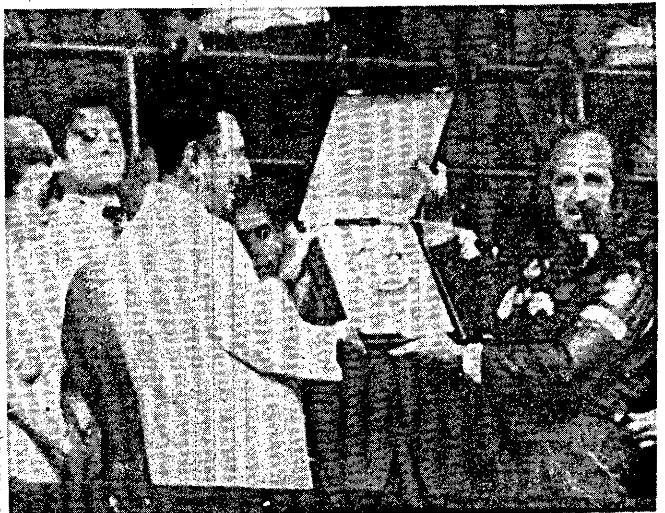
O Presidente da Argentina, Juan Domingo Peron, entregou a Hulme o prêmio da vitória

OBSERVAÇÃO:—Devido à crise do petróleo, o Governo da África do Sul cancelou o Grande Premio que seria disputado em Kyalami no dia 2 de março. Os organizadores, porém não desistiram e ainda estão tentando a revogação da medida governamental.