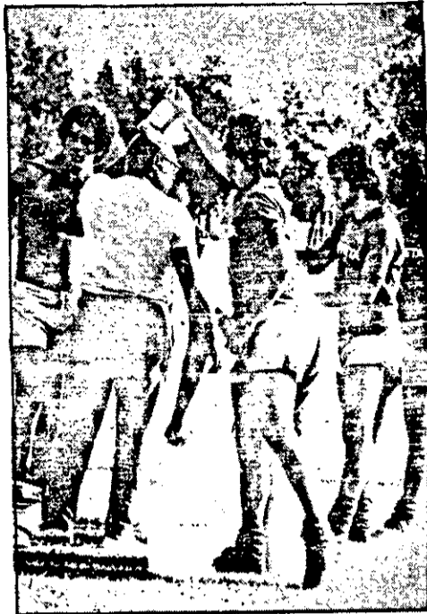
O BOM AMBIENTE ENTRE TODOS TEM SIDO CONSTATADO.