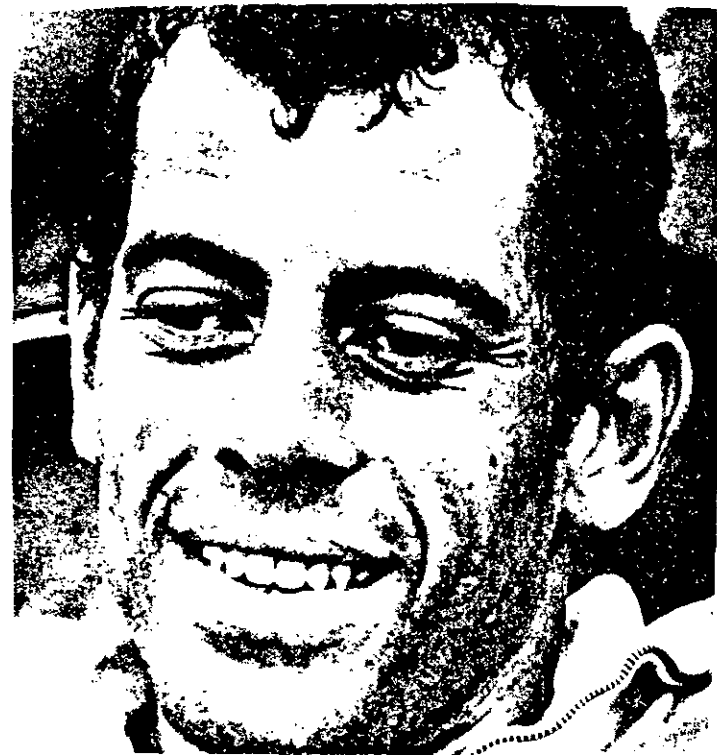
O ex-capitão Carlos Alberto (forte)

Na verdade, o jogador brasileiro vem sendo exigido de forma absurda nos quilométricos campeonatos nacionais e regionais. Pode estar havendo uma espécie de saturação da bola. O tricampeonato contribuiu, também, para essa visível desmotivação que não somente assalta os jogadores mas a própria torcida, hoje não tão ruidosa nem apaixonada como há quatro anos atrás. Enfim, somos o país do futebol, tudo pode acontecer e, mesmo sem esperar (ou querer), tornarmo-nos, mais uma vez, campeões do mundo.