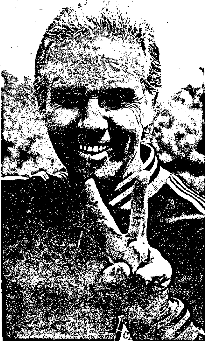
Apesar dos pesares, a esperança na vitória final.