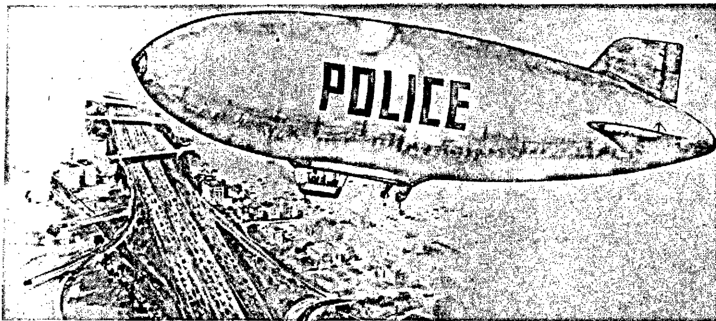
Dirigíveis para uso no combate ao crime foram propostos pela Goodyear à Polícia da cidade de Tempe, Arizona, EUA. Com 43 metros de comprimento o dirigível policial cruzaria a 66 Km por hora a baixas altitudes, proporcionando uma plataforma aérea para serviços de vigilância em grandes centros urbanos.

Os infratores das leis de segurança terão que olhar um pouco mais para cima se os representantes da lei e da ordem aceitarem a proposta da Goodyear Aerospace Corporation (EUA).