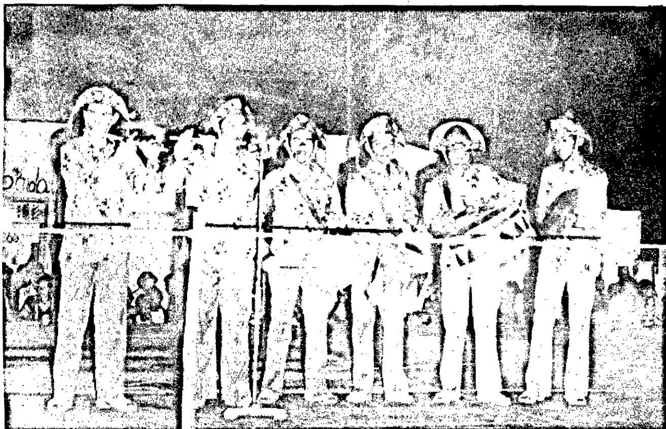
A Banda de Pífanos de Caruaru, que dia a dia se firma no cenário artístico nacional, também estará abrindo o III Festival de Arte de São Cristóvão.

A partir de amanhã estão abertas as inscrições, na Reitoria para as pessoas que queiram instalar barracas de Artesanato, este ano na Praça da Matriz e de comidas, que ficarão na Praça da Bandeira. A informação é da Comissão do Festival, que nada tem a ver com as instalações de restaurantes portanto os que pretendem instalar os mesmos devem alugar os imóveis em São Cristóvão.