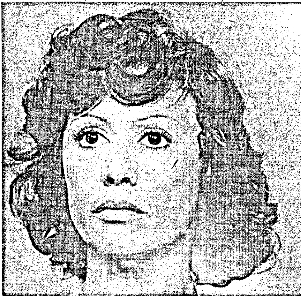
Uma das atrizes mais lindas deste país. Dina Sfat é uma das presenças marcantes da novela "Os Ossos do Barão", que termina em agosto, cedendo lugar a "O Espião". Dina, além de bonita, esbanja uma enorme dose de talento...