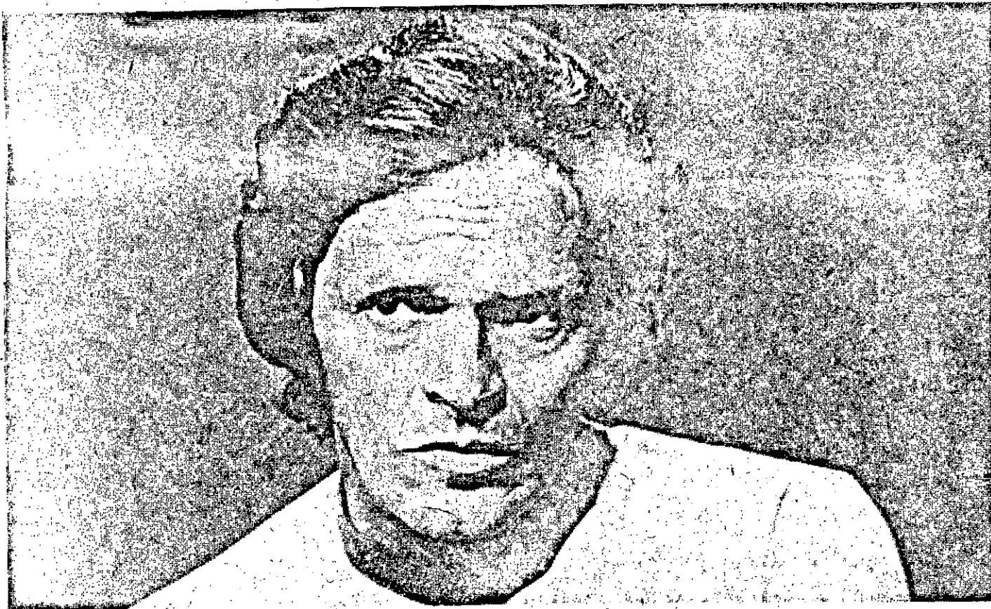
Um dos melhores atores brasileiros, o Milton Moraes, está no elenco de "O Espigão", vivendo Lauro Fontana.

trabalhou muito tempo no rádio. Foi diretor da Rádio Nacional, Rádio Clube do Brasil e Rádio Bandeirantes. Na segunda fase de teatro, todas as peças foram encenadas e motivaram Dias Gomes a escrever dois volumes: O Teatro de Dias Gomes , com as seguintes obras: Pagador de Promessas , A Invasão , A Revolução dos Beatos , O Bem Amado , O Berço do Herói , O Santo Inquérito e Doutor Getúlio .