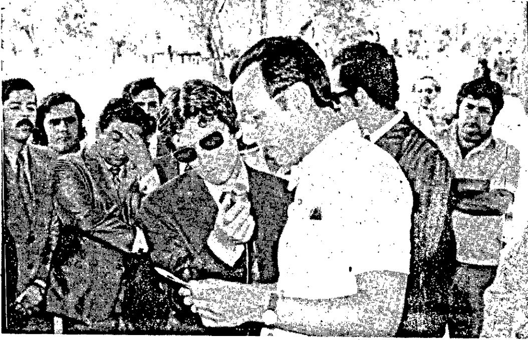
O diretor do DESO fez importante pronunciamento dando destaque a grande obra da Ibura.