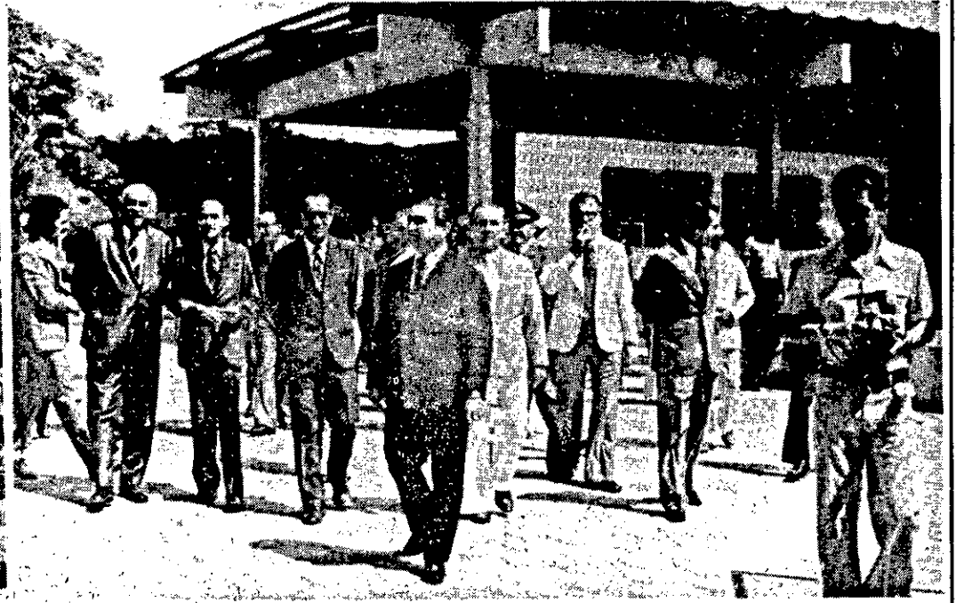
O investimento global da obra atingiu Cr$ 4,6 milhões.