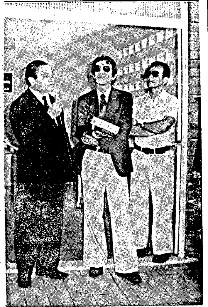
O Governador Paulo Barreto enalteceu o trabalho do DESO proporcionando água farta para diversos Municípios sergipanos