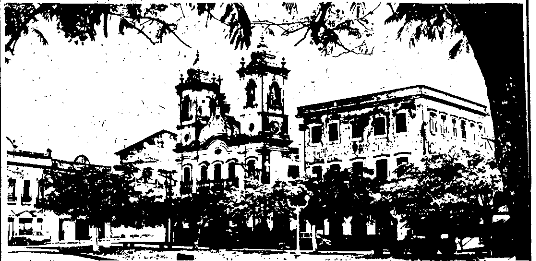
Aspecto da cidade de Penedo, uma das mais antigas do país, que será palco do I Festival de Cinema promovido pelo Departamento de Assuntos Culturais da Secretaria de Educação e Cultura de Alagoas, a partir de quinta-feira próxima.