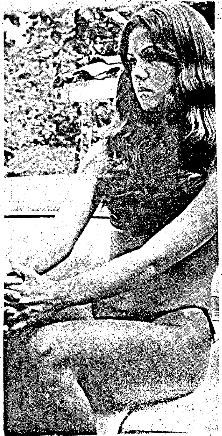
Elogiada por muitos e condenadas por grande número de pessoas, as tangas continuam mostrando com maior autenticidade a beleza feminina.

Já um ateu, que também pediu a não divulgação do seu nome, falando sobre as tangas disse que para as jovens que usam ou que não usam, o badalado invento brasileiro, é preciso apenas que ela tenham em mente que "Não existe Deus e sim uma força superior que manobra todos os seres vivos, existentes na terra, ou melhor, tudo o que existe no mundo, ao exemplificar que a lei natural pune a quem destruir os vegetais".