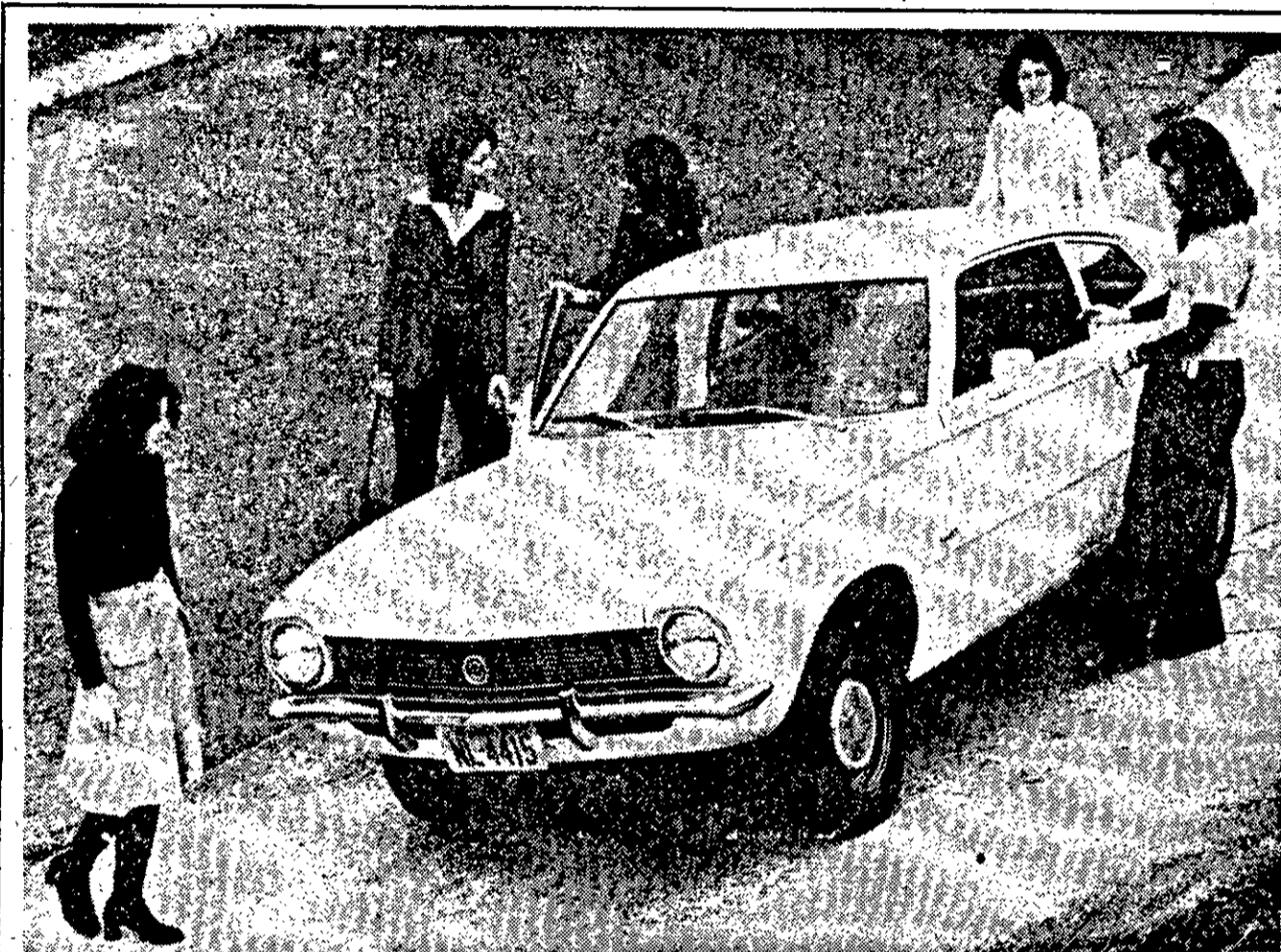
Elegante e confortável ao dirigir, esta foi a opinião geral

conseguiu ludibriar os policiais fingendo para lugar ignorado em um veículo dirigido por seu esposo, que também está implicado e a exemplo dela deverá ser identificado criminalmente.