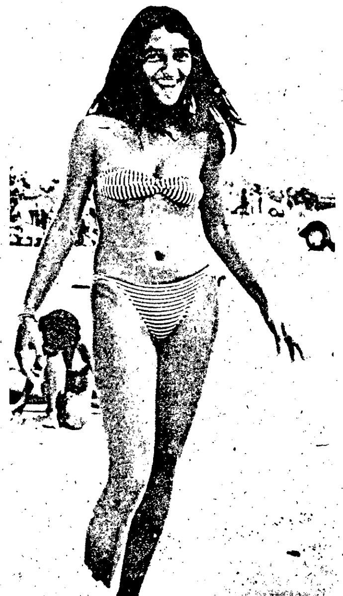
Invenção brasileira, a tanga ganhou o mundo, e em Aracaju elas contribuem para mostrar os encantos da mulher sergipana.