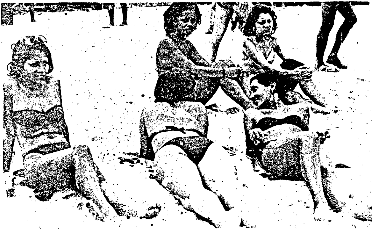
Há quem condene as tangas, mas há quem as adorem...