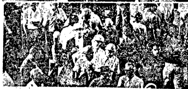
O movimento das eleições do Corinthians.