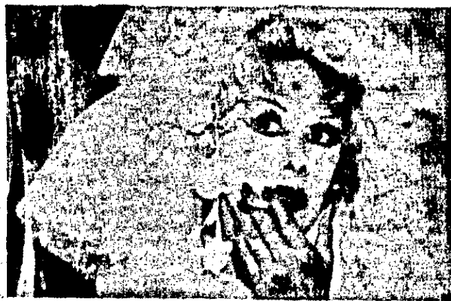
Aí está Dercy Gonçalves, comedianta que estará amanhã no auditório do Colégio Estadual, fazendo o público rir...