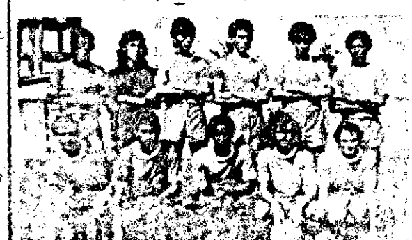
O time do Tiradentes que vem de uma grande invencibilidade

Dentro das comemorações do Dia do Trabalhador, a presença da Federação Sergipense de Futebol de Salão organizou o Torneio Albano Franco que será disputado no ginásio "Lourival Baptista", em São Cristóvão. Eis a ordem dos jogos: 1º Farmácia Globo x Bamarindus; 4º Polícia Militar x FAB Farmácia Globo x Bamarindus; 2º DNER x C. Ddebrecht 3º Marinha do Brasil x Jornal da Cidade; 34º Polícia Militar x Fab. Cimento; 5º Prefeitura de São Cristóvão x Banco Itau; 6º Colorado x Itabaiana; 7º Rádio Cultura x DER; 8º Venc. 1º x Venc. 2º; 9º - Venc. 3º x Venc. 4º; 10º - Venc. 5º x Venc. 6º; 11º - Venc. 7º x Venc. 8º; 12º Venc. 9º. Venc. 10º; 13º - Venc. 11º x Venc. 12º. O primeiro jogo será iniciado às 8h30m.