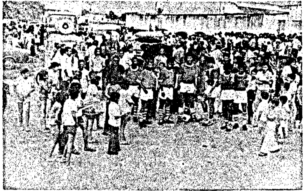
Jogadores do Estanciano e torcedores esperaram o jogo que não houve

der do campo da Fonte Nova que se não o ferer condições de jogo o ensaio dos vascaínos resumir-se-á a exercícios físicos que serão desenvolvidos na quadra de esportes na Avenida João Rodrigues.