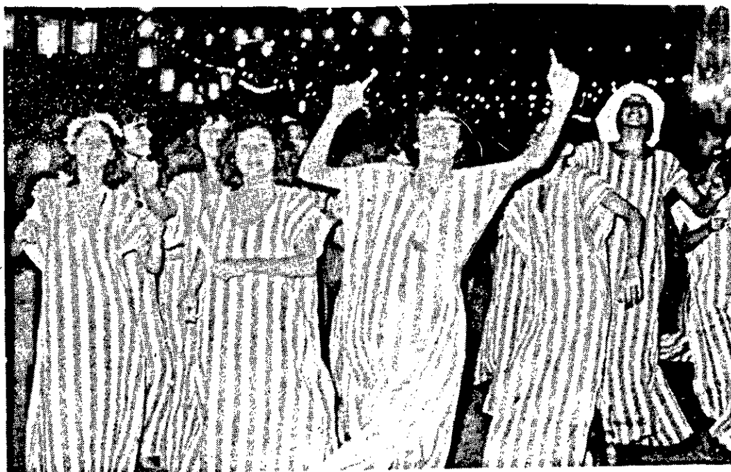
A turma está se preparando para o Carnaval.

Blocos e Escolas de Samba prosseguem os ensaios para o carnaval deste ano. Os desfiles dos dias 29 de fevereiro e 2 de março, poderão ganhar em brilho, pelo acirramento das rivalidades entre as escolas. Apesar da pequena ajuda recebida, costureiros desenvolvem intenso trabalho, no preparo das fantasias que no entanto só ficarão prontas na véspera do carnaval, devido à demora na liberação do dinheiro para a ajuda. Desfilarão as Escolas de Samba Império Serrano, Império do Morro, Amigos do Samba, Batuqueiros do Morro e Acadêmicos do Samba e os Blocos: Brasil Moreno, Unidos de São José, Novo Paraíso, As Italianas, Bloco da Paz e o Bloco do Amigão. Este último, terá cerca de trezentos participantes, mas não desfilará oficialmente.