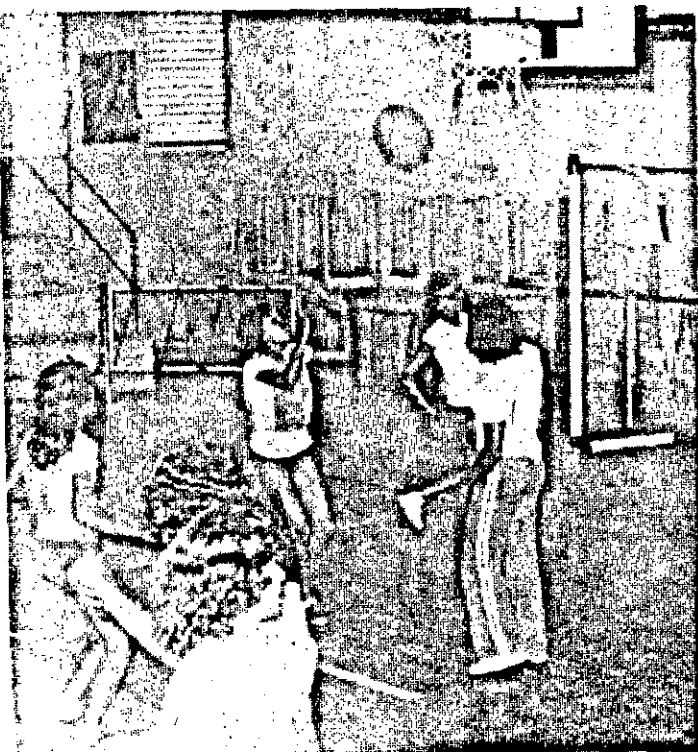
O basquete no curso de "Iniciação Esportiva"

O programa elaborado pelo Sesi para o encerramento do curso de "Iniciação Esportiva" é o seguinte: 1. Parte: 15:30hs - Pátio Interno - Hasteamento de Bandeiras - Demonstração de Basquete e Voleibol e entrega de certificados. 2a. Parte: 19:30hs - Demonstração de Judô com entrega de certificados; demonstração de Dança; competição de Handebol (feminino e masculino) com entrega de certificados e medalhas. Todas estas práticas, no Ginásio do Clube do Trabalhador.