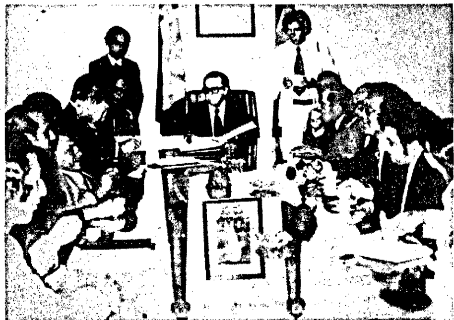
Na foto, flagrante da assinatura do convenio com a presença de prefeitos.

Inesperadamente, foi adiada a ida do Governador José Rollemberg Leite a Propriá, amanhã, quando despacharia daquela cidade recebendo em audiências os prefeitos da região do São Francisco. Nem o Boletim do Palácio Olímpio Campos, nem nenhuma outra fonte oficial explicou o motivo do adiamento. Mesmo em Propriá, até o dia de ontem não se sabia do adiamento, com muitos prefeitos da região se preparando para a audiência que manteriam com o Governador do Estado.