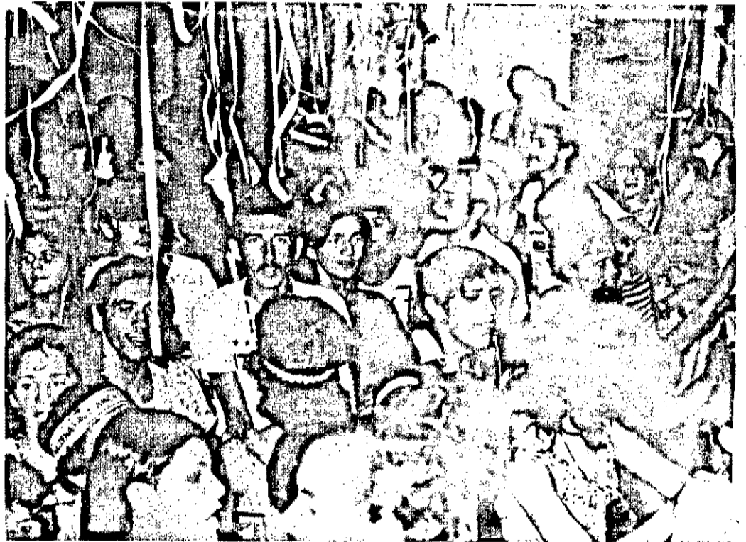
A alegria e a participação geral é o forte do nosso Carnaval, que no dia de hoje tem seu badalado início, com o IV BAILE DOS ARTISTAS, numa alegria e felicidade indiscutível.