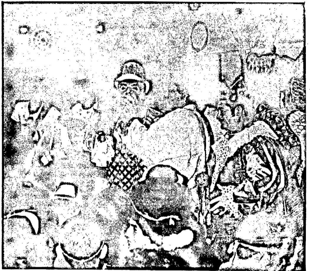
Houve época em que nossa cidade tinha um Rei Momo... mas como isso (graças a organização) é coisa do passado, a festa será mesmo comandada pela RAINHA DOS ARTISTAS.