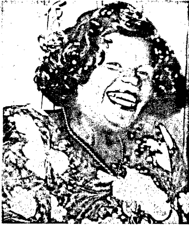
A TV Atalaia coroa hoje a Rainha dos Artistas.

O Juizado de Menores acaba de estabelecer normas gerais para o comportamento de adolescentes e crianças durante o carnaval. A principal delas é o aumento