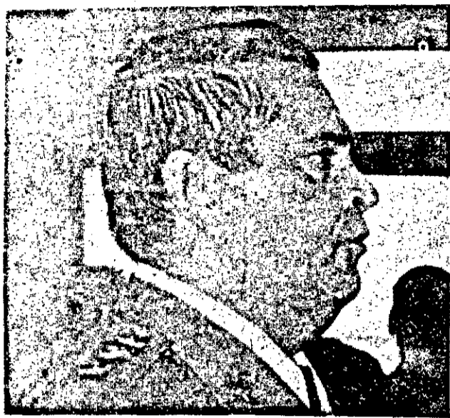
O Comandante da Polícia Militar concedeu entrevista sobre as atividades da corporação.

O regulamento que estuda a nova padronização da Polícia Militar poderá extinguir a função gratificada na corporação.