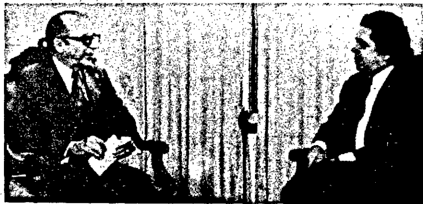
O início do fim