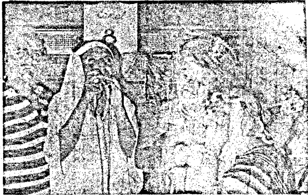
No BAILE DOS ARTISTAS, a grande abertura do carnaval sergipano, que hoje tem seu início oficial.

Ainda para hoje, temos carnaval na boite "Só Drink's" e na boite "LA BARCA" do Hotel Beira Mar, onde a gente bem já tem mesa reservada, aproveitando o requinte ambiental e o som da pesada que fará o carnaval de lá. No mais é muita disposição para entrar na folia... curtir as coisas... um gole e outro de Royal Label Black (o whisky que eu tomo)... botar o bloco na rua e ver todo mundo neste carnaval.