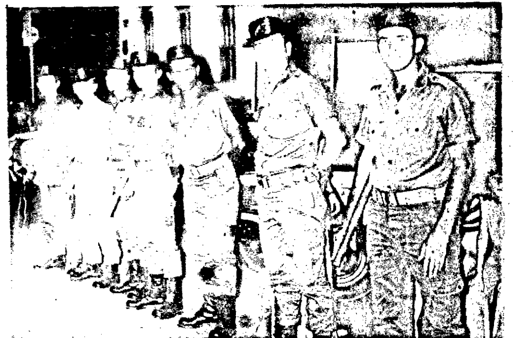
Polícia Militar: consciência do dever cumprido. Houve ordem e segurança nos festejos de momo.