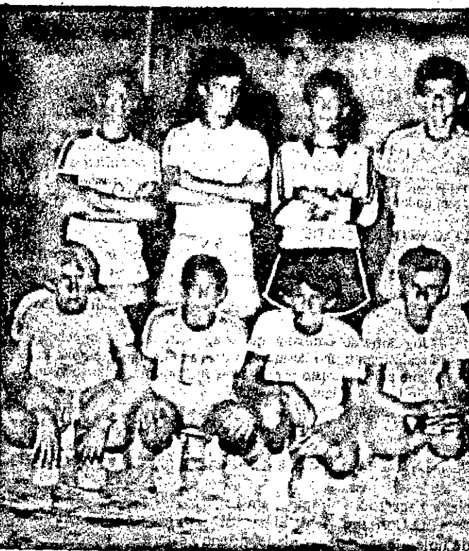
Time infanto-juvenil do Sesi que entra no turno final disposto a levar o título para conseguir uma melhor-de-tres com a Atlético.