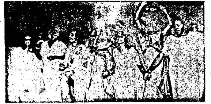
A terça-feira na Praça Fausto Cardoso foi das mais animadas. Os foliões não queriam que o trio elétrico parasse.