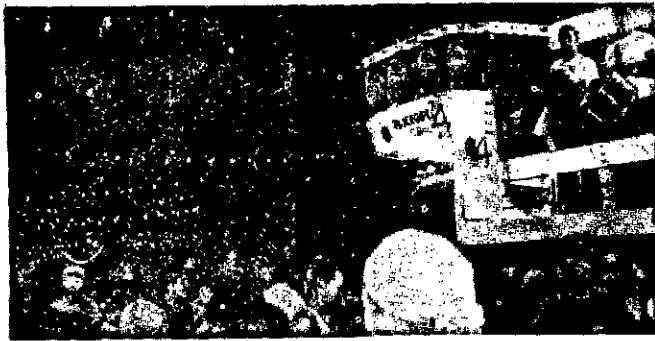
O Bloco da Paz ficou no Cotinguiba até o encerramento da folia, na quarta-feira, e depois saiu às ruas brincando.

Segundo o Secretário de Segurança Pública, Adroaldo Campos Filho, este foi o carnaval mais calmo que Sergipe já viu. "Não houve o registro de nenhum crime ou qualquer incidente de grandes proporções. Tudo funcionou de acordo com o esquema montado, com o funcionamento normal do sistema de rádio-comunicação. Até as portarias mais primárias foram respeitadas, como a proibição de venda de bebidas alcoólicas a menores e a que fiscaliza os menores dirigindo veículos automotores".