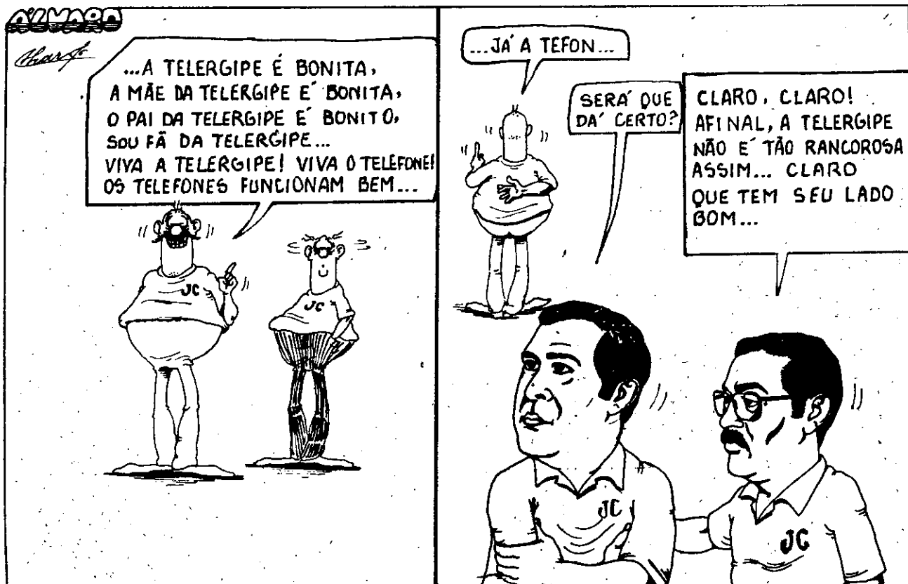
Dos Jornais: Os responsáveis pelo JORNAL DA CIDADE estão preocupados com a indiferença da Telergipe em relação à instalação dos seus telefones.