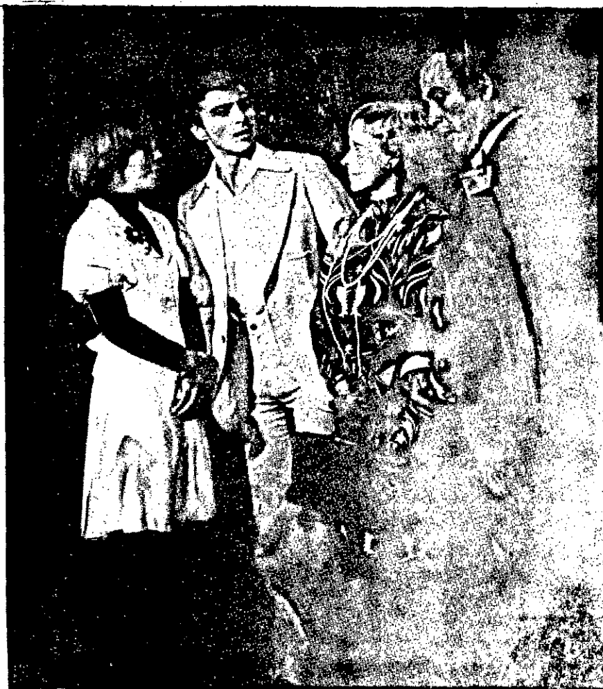
Uma das cenas de "A Viagem" a novela coragem da rede Tupi de Televisão, sucesso absoluto em todo o País.