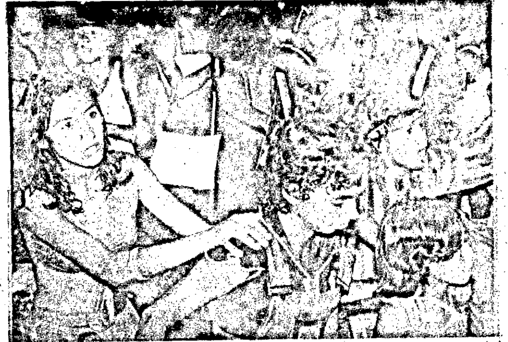
Os matinais e matinées carnavalescos da terça-feira foram animados em todos os clubes. A criançada também queria a despedida do carnaval bem animada.