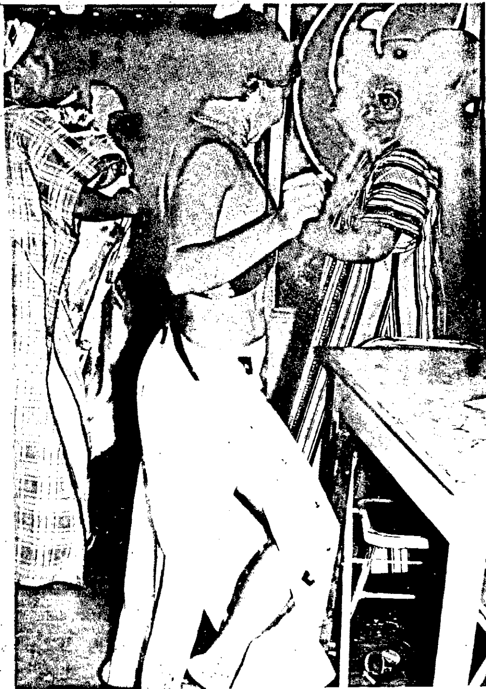
Na AABB a juventude, e mesmo os de idade mais avançada, brincaram, fantasiados, os últimos instantes do carnaval que passou.