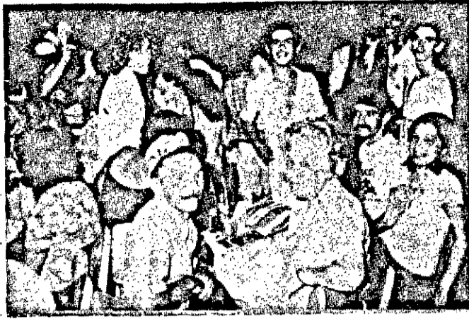
Muito animado o carnaval no Cayçara Clube, de Simão Dias.

(Do Correspondente) - O carnaval de Simão Dias decorreu num clima de muita animação com as escolas de samba e blocos desfilando com grande acompanhamento de foliões. Um trio elétrico percorreu as ruas da cidade aumentando a vibração do povo simão-diense, que brincou como nunca. Os festejos carnavalescos atingiram o seu auge nesta cidade no Cayçara Clube, onde o deputado Antônio Carlos Valadares e sua esposa esbanjaram alegria.