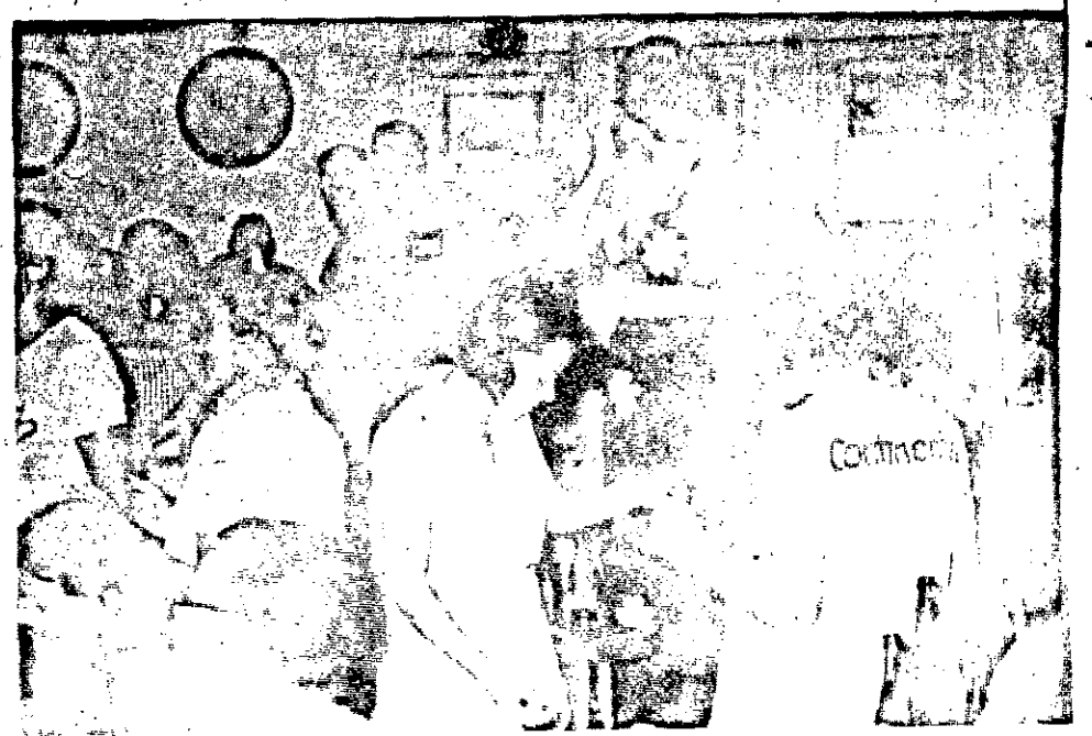
Ao raiar da quarta-feira, o cansaço tomava conta de todos, e trazia uma fadiga lembrança. A hora da volta às atividades normais do dia a dia, com as preocupações de cada um.