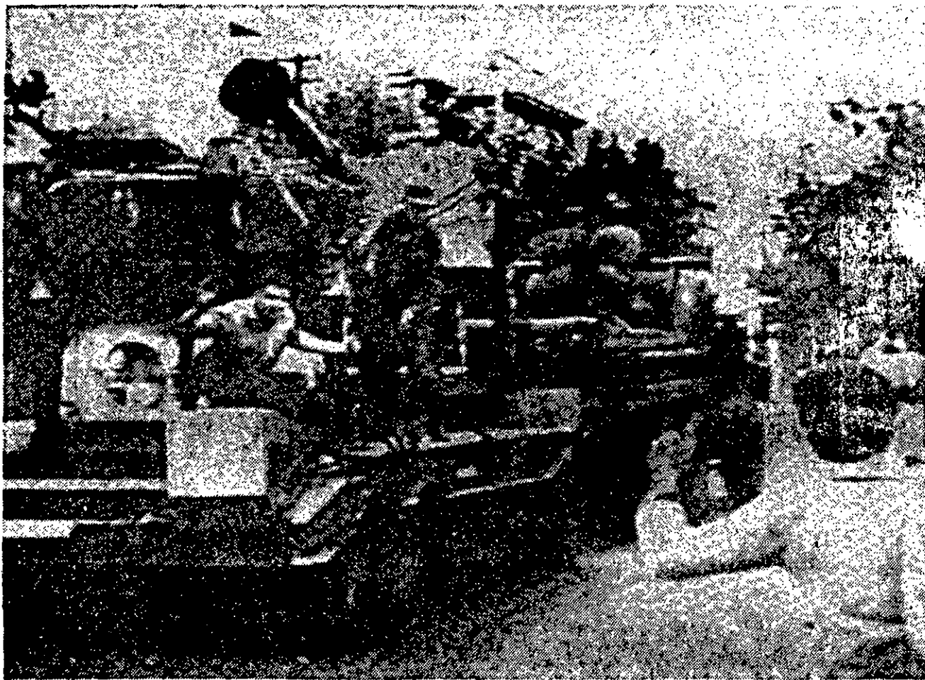
Os tanques saíram às ruas para depor Isabelita.

rádio. Os carros particulares, ônibus e táxis circulam normalmente pelas ruas centrais e o único indício de que os militares estão no poder são os caminhões e jipes lotados de soldados nas esquinas de Buenos Aires.