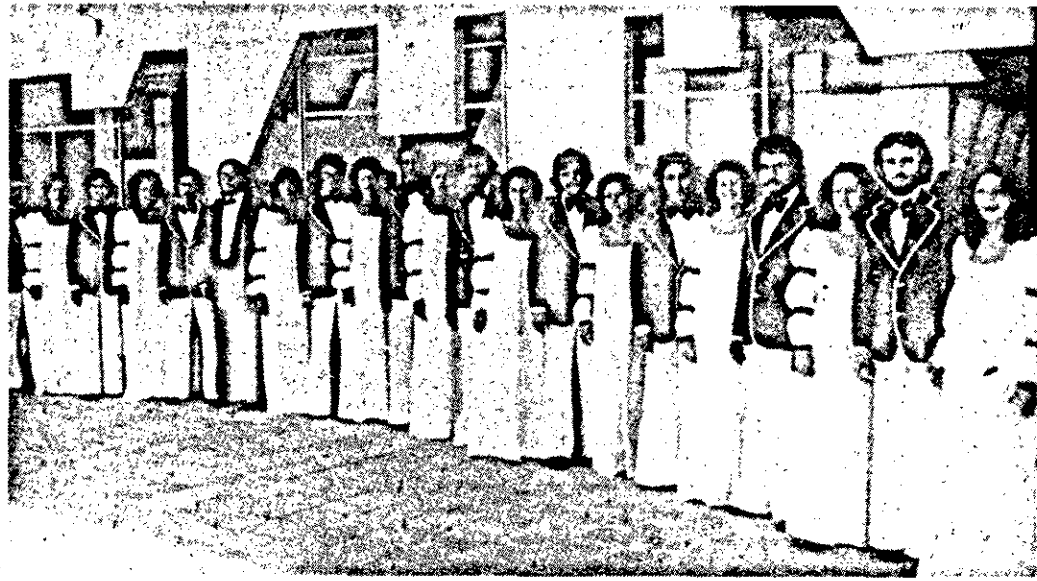
Aí está o Coral da Universidade Federal de Sergipe, responsável pelo concerto da próxima quinta feira, no Auditório "Villa Lobos" do Conservatório de Música do Estado. Não deixe de assistir... nós recomendamos.