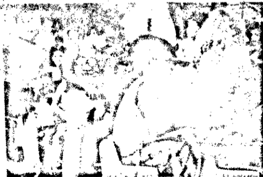
A criançada se divertiu a valer no Parque, durante três dias. Além dos jogos, doces e brincadeiras, haviam brinquedos amados.