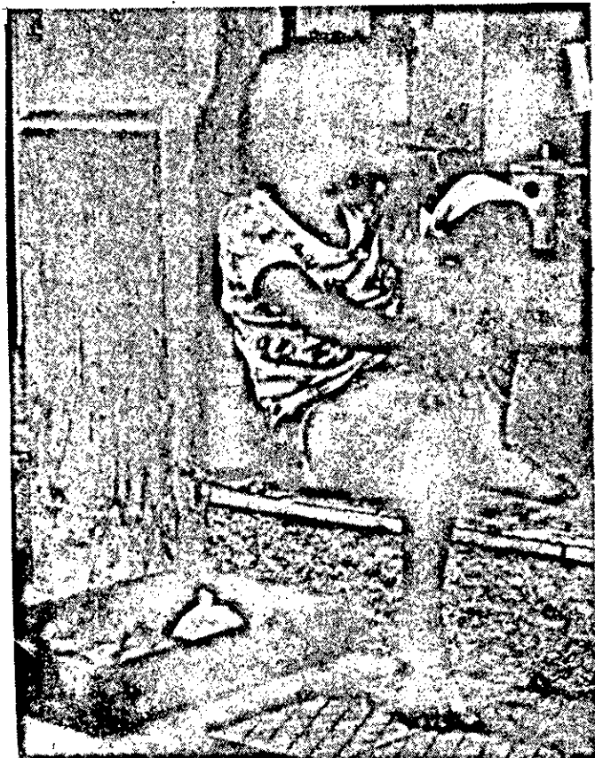
A Semana da Criança chegou. Para este menor tanto faz, pois não tem tempo para essas coisas. O que lhe interessa é um pouco de alimento ou um pouco de dinheiro para diminuir sua fome.

Lembrando a criança feliz, não podemos nos esquecer a infelicidade de tantas outras, que pagando pela omissão ou irresponsabilidade de pais, nem sempre encontram por parte da sociedade a indispensável compreensão e, por isso, descambam para o pior. A referência é especial para o menor abandonado. Exatamente aquele que todos os dias é visto perambulando, à tarde e à noite, pelas ruas centrais da cidade, vagando pelas praças, jardins e restaurantes, pugnando em ônibus.