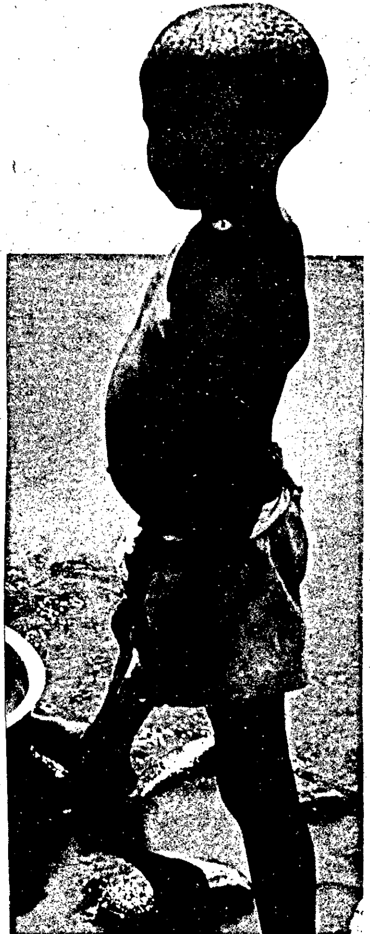
Perambulando pelas ruas, jardins, portas de restaurantes e na orça marítima, gran de número de menores abandonados vive "ao Deus dará". Assim, passam semanas e mais semanas dedicadas à criança.