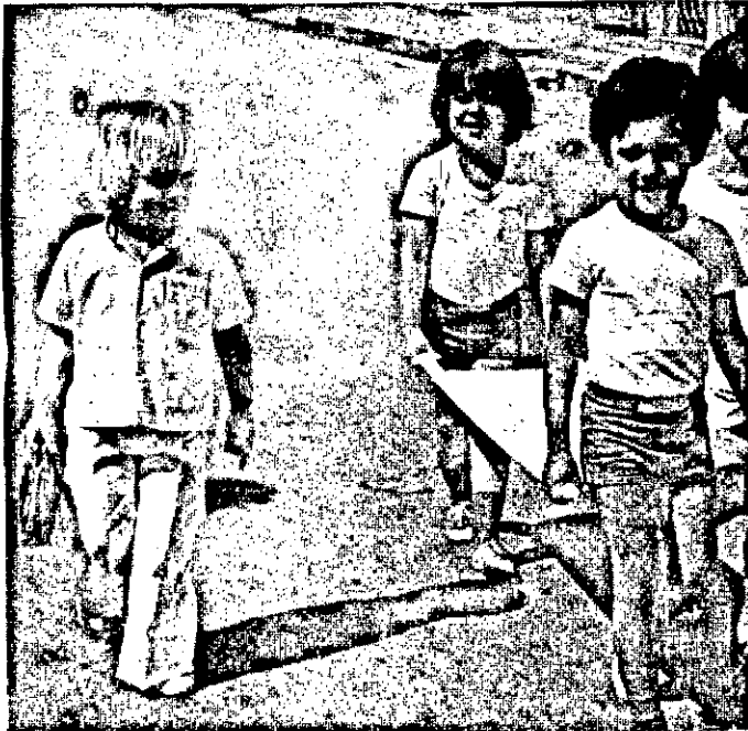
Na Semana da Criança muito se fala na doçura de cada uma delas, nos seus sorrisos e da alegria que emanam.

Lembrando a criança feliz, não podemos nos esquecer a infelicidade de tantas outras, que pagando pela omissão ou irresponsabilidade de pais, nem sempre encontram por parte da sociedade a indispensável compreensão e, por isso, descambam para o pior. A referência é especial para o menor abandonado. Exatamente aquele que todos os dias é visto perambulando, à tarde e à noite, pelas ruas centrais da cidade, vagando pelas praças, jardins e restaurantes, pugnando em ônibus.