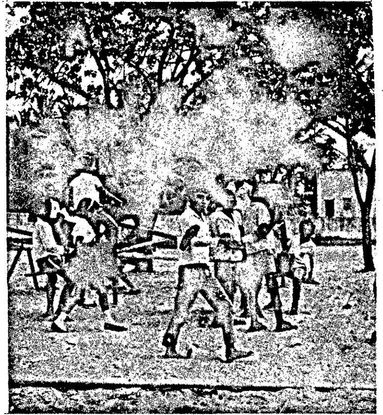
Mal alimentadas e sem capacidade para assimilarem os ensinamentos escolares, milhares de crianças exigem uma melhor atenção, durante a Semana da Criança e depois que esta termina.

Um maior cuidado para o menor abandonado, para o carente de recursos e sua educação escolar, para a mãe pobre, são apelos que se faz na Semana da Criança quando a criança feliz é mais lembrada do que nunca, e mesmo depois da passagem desta.