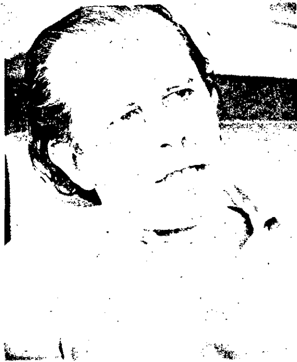
Simonsen garantiu: "Não há isenção para os táxis."