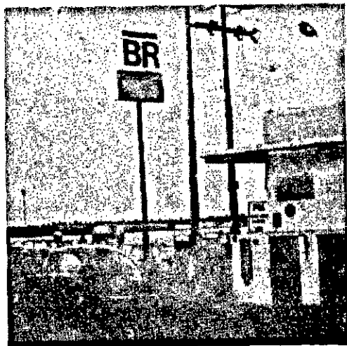
Neste fim de semana, os postos de gasolina estarão fechados: das 6hs. do sábado até o fim do domingo. Nos feriados, também fecharão.

Todo um esquema de prestação de serviços burocráticos está sendo organizado envolvendo a impressão de talões, os Bancos Central e do Brasil e os postos de gasolina, e outros revendedores de derivados de petróleo. Nas grandes