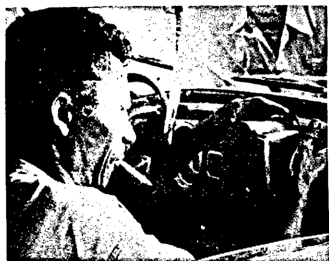
...a finalidade disso é os táxis ficarem todos parados."