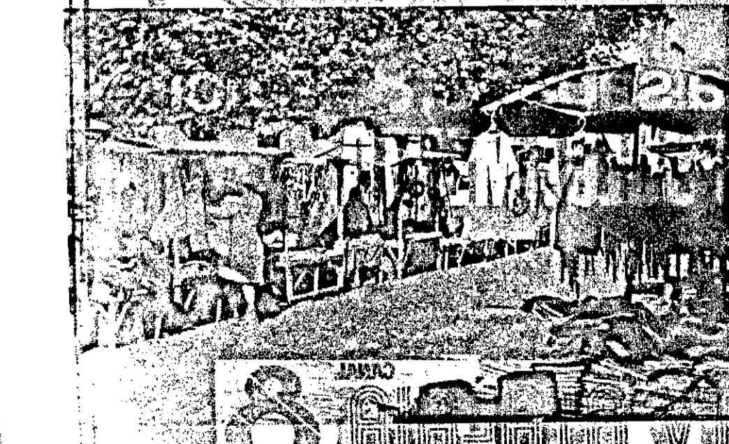
Os camelôs da rua Santa Rosa são mais organizados. Vendem de tudo, os artigos de Umbanda as confeções passando pelo ramo das ferragens.