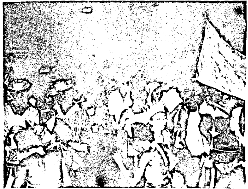
Este ano, os blocos e ranchos voltarão a desfilar na Praça Fausto Cardoso, no domingo e na segunda-feira, a partir das 20 horas.

"... O HOMEM DE MORAL, NÃO FICA NO CHÃO, NEM QUER QUE MULHER, VENHA LHE DAR A MÃO: RECONHECE A QUEDA E NÃO DESANIMA, LEVANTA SACODE A POEIRA E DA A VOLTA POR CIMA".