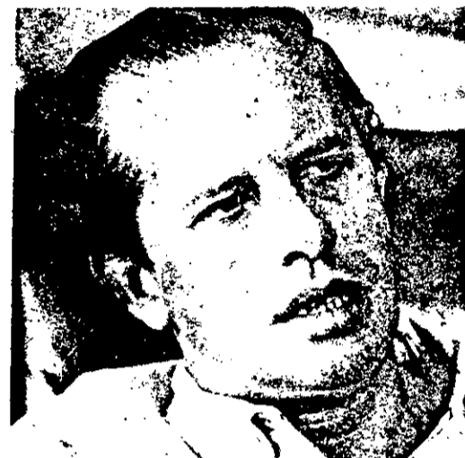
SIMONSEN COMANDA POLITICA GLOBAL

Não foram anunciadas medidas de restrição ao crédito como estava sendo esperado com grande expectativa nos meios empresariais. O crédito continua normal para evitar que se acentue a crise econômica e possa ocorrer desemprego. Se houver um excesso nos meios de pagamento como ocorreu no último mês, o Governo poderá "enxugar" o mercado através da intervenção do Banco Central no mercado aberto, lançando Letras do Tesouro Nacional em grande quantidade, e, dessa forma reduzindo o dinheiro em circulação (Pags. 2 e 3)