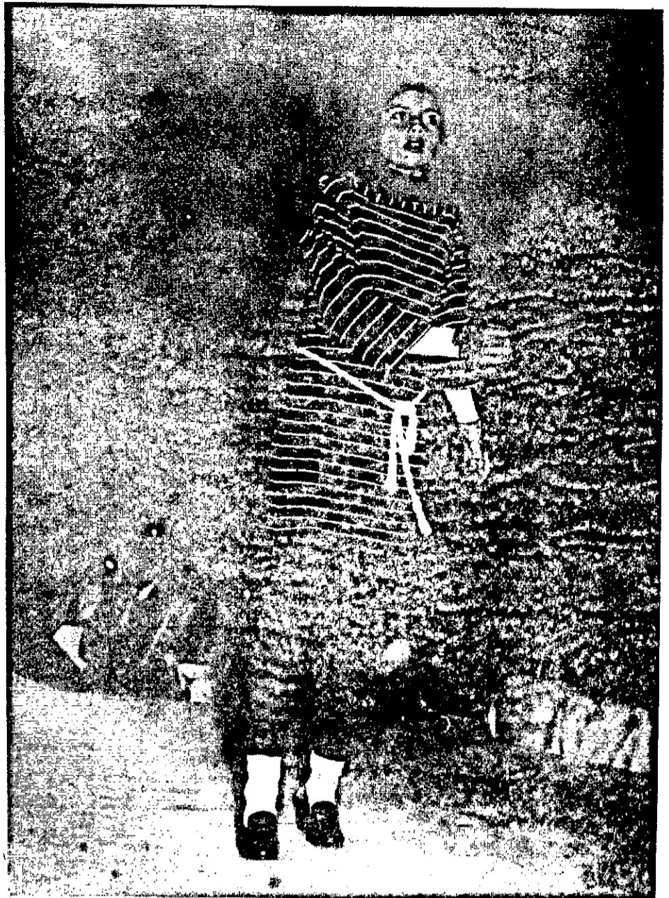
Na passarela, um modelinho quente de "Imperatriz" para os dias frios de chuva, deste nosso parco inverno. Aqui fica a sugestão...