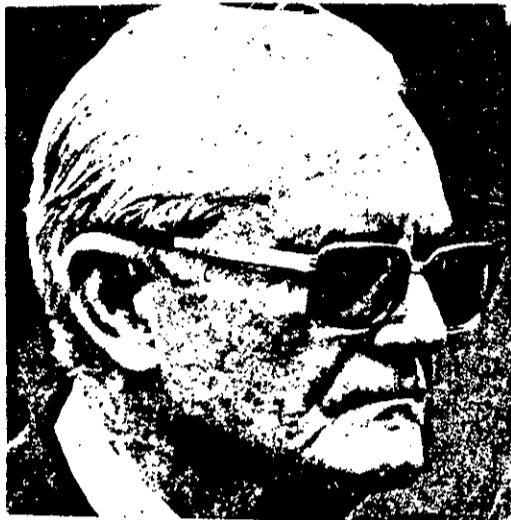
GEISEL ADOTA LINHA DURA NOS PREÇOS

* Gasolina não sobe. * Preços congelados. * Crédito normal.