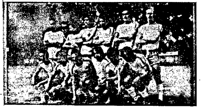
O QUADRO DO DOMINGAO.

São Domingos e Desportiva Médici, duas das mais importantes equipes do futebol de várzea, desta capital tem amistoso programado para à tarde de domingo, no campo do Santa Cruz, localizado no conjunto Médici II. Um verdadeiro clássico suburbano, com os dois quadros colocando em jogo as longas invencibilidades.