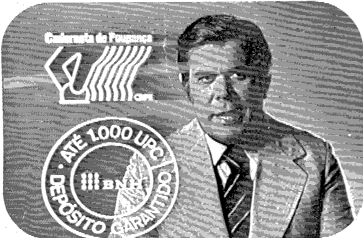
Foto tirada da televisão.

Faca mais poupança. É bom para você. É bom para o Brasil.